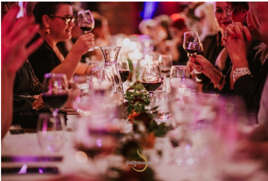
Kuva Tampereen iltajuhlasta by Eija Jokilahti

Ilmoittautuminen: https://www.lyyti.in/Joululuhla_6993