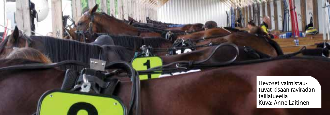
Hevoset valmistautuvat kisaan raviradan tallialueella

ja kouraisee mahanpohjasta tai sydämestä.