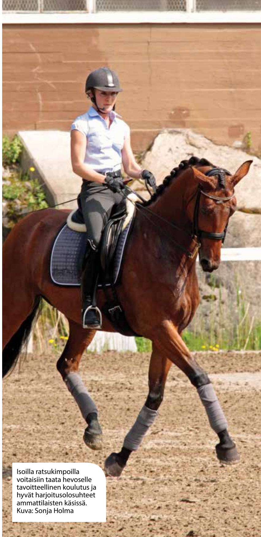
Isoilla ratsukimpoilla voitaisiin taata hevoselle tavoitteellinen koulutus ja hyvät harjoitusolosuhteet ammattilaisten käsissä.

Näistä pohdinnoista huolimatta kannustan ratsukasvattajia ja -ammattilaisia toteuttamaan omannäköisiä ja erilaisiakin kimppoja. Neuvoja saa varmasti myös ravihevosten kimpanvetäjiltä. Tervetuloa toteuttamaan ratsuhevosten kimppatalleja! Jään odottamaan myös todellista lajirajat ylittävää kimppaa, jossa suomenhevosen monipuolisuus pääsisi oikeuksiinsa – täällä on heti yksi osakas.