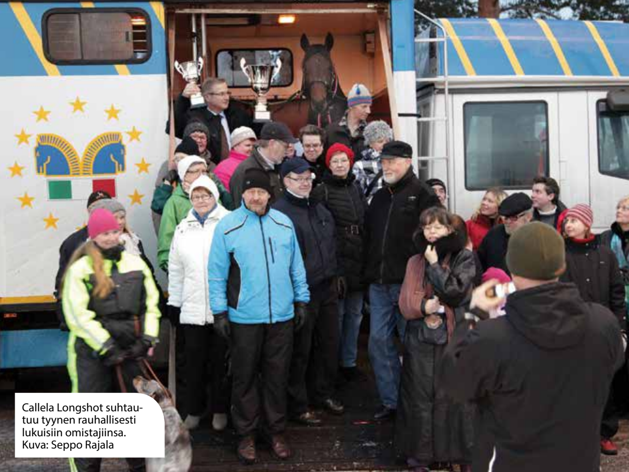
Callela Longshot suhtautuu tynnen rauhallisesti lukuisiin omistajiinsa.

putoa ulos informaation piiristä. Kaikki eivät käytä Facebookia tai edes sähköpostia, mutta heilläkin on oikeus tietää. Toisaalta, jos tuntee suurta inhoa jo tekstiviestejäkin kohtaan, on olemassa akuutti vaara, ettei ihan kaikkea tule tietäneeksi – kohtuus kaikessa. Callela Longshotin tapauksessa niistä omistajista, joilla ei ole ollut omaa sähköpostitiliä käytössään, moni on antanut jonkin perheenjäsenensä sähköpostiosoitteen viestien vastaanottoa varten.