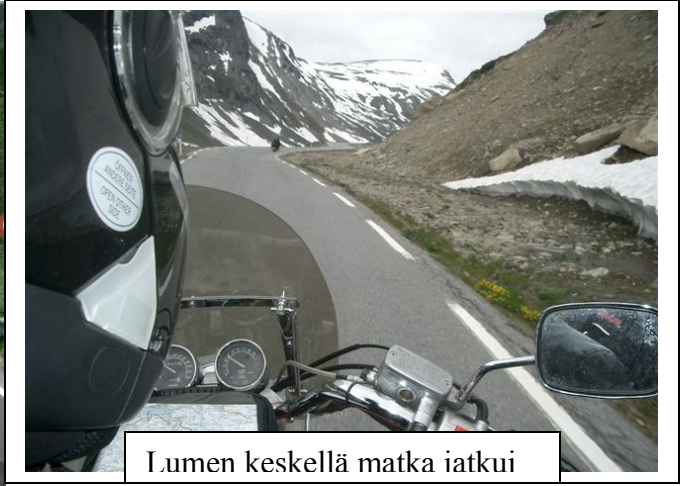
Lumen keskellä matka iatkui

Lauantaina suuntasimme Ruotsin halki Luleå:ta kohti. Matkalla meinasi porot tunkea eteen, mutta vauhtimme oli sopivaa, joten ongelmaa ei tullut. Sieltä ajelimme Tornioon ja yövyimme Kemissä.