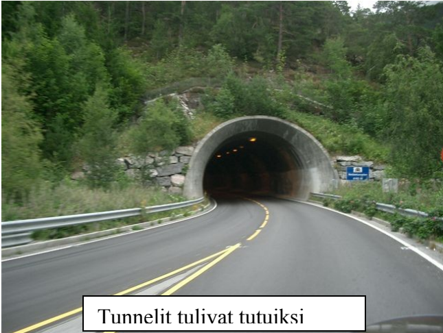
Tunnelit tulivat tutuiksi