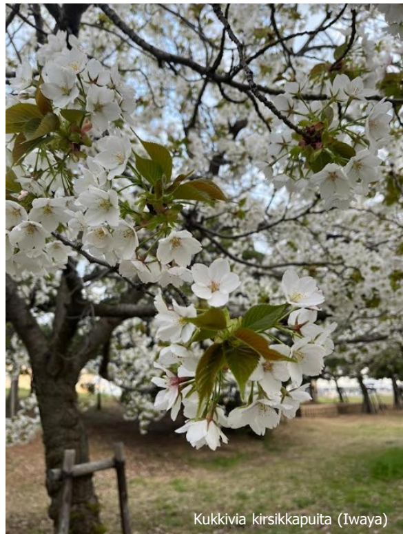
Kukkuvia kirsikkapuita (Iwaya)