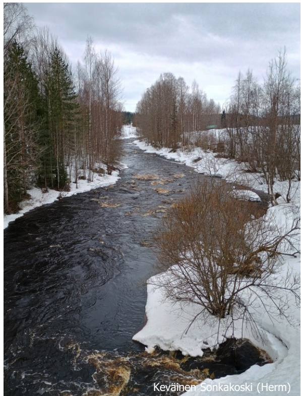
Keväinen Sonkakoski

Veljeni sai Hynysten sukuseuralta pyynnön tehdä DNA-testi ja yhteys Paloisten haaran Hynysiin saatiin vahvistettua. Sukututkimus ja sen avulla omien juurien tunteminen on mahtava asia, aina löytyy uutta. Sukuseurassa olen ollut tämän vuoden alusta varajäsenenä.