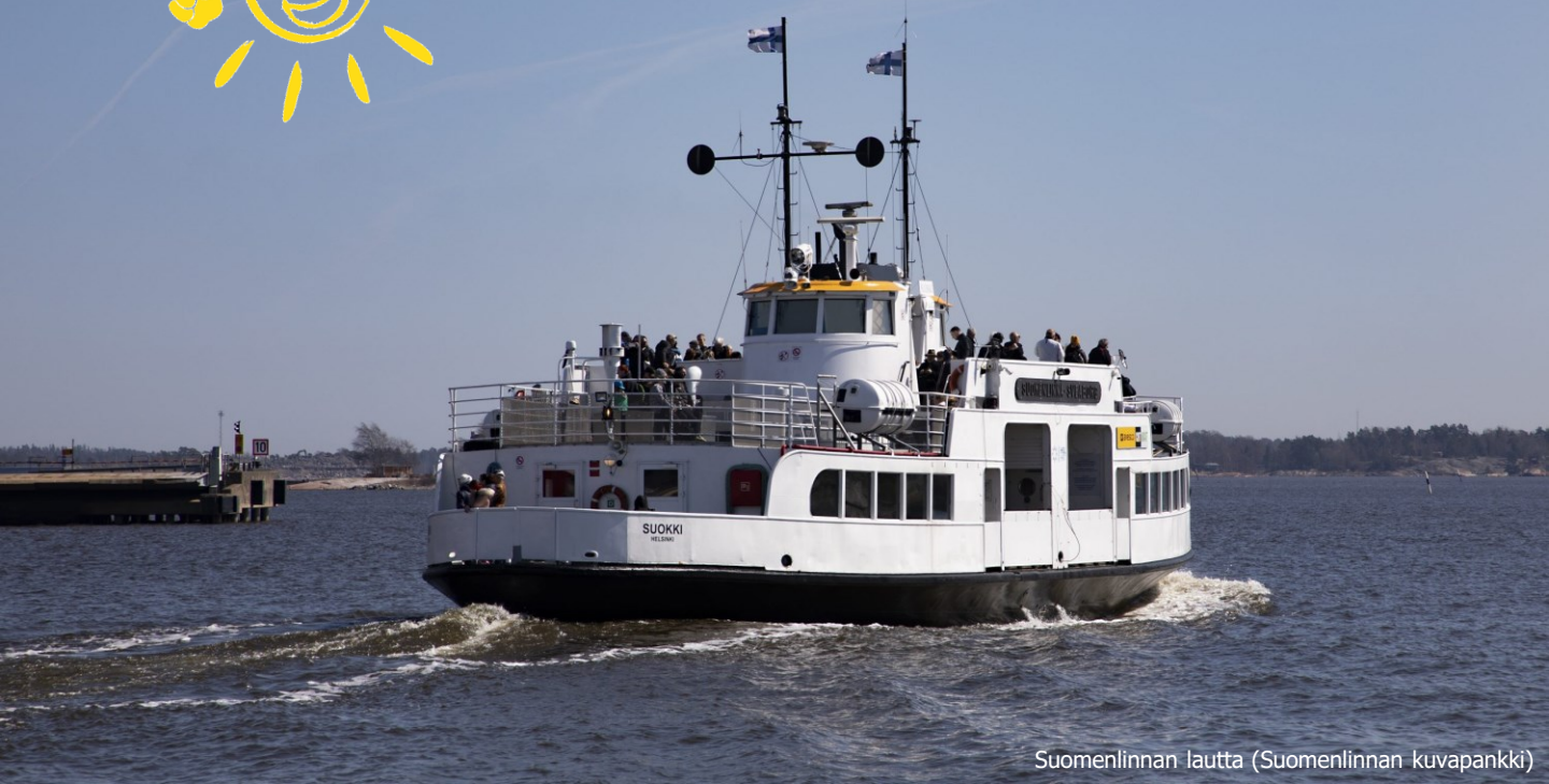
Suomenlinnan lautta

Aurinkoista kevään jatkoa kaikille ja toivottavasti näemme mahdollisimman monia teistä kesäkuun Suomenlinnan retkellä!