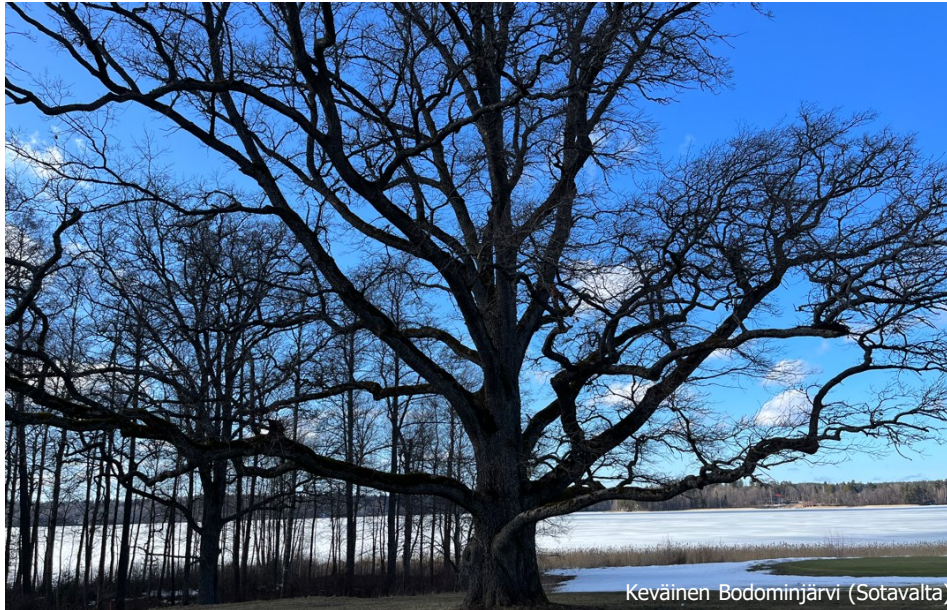
Keväinen Bodominjärvi (Sotavalta)