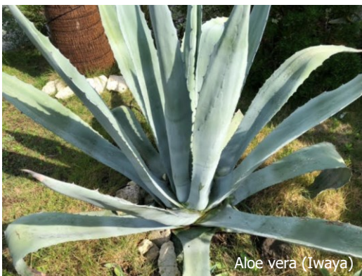
Aloe vera (Iwaya)