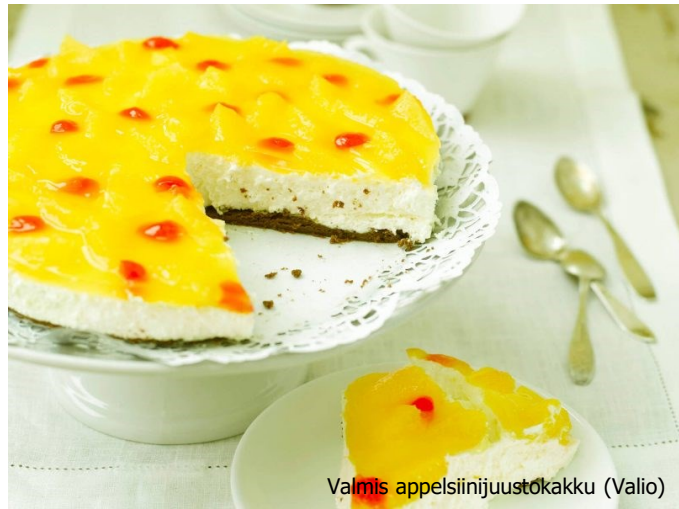
Valmis appelsiinijuustokakku (Valio)

mintun tai sitruunamelissan lehteä tai kirsikoita