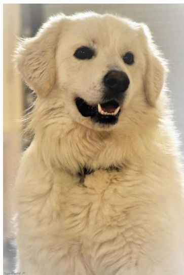
Jäälinnan Sydänten Murskaaja