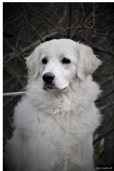
Bozena Kouzelná legenda