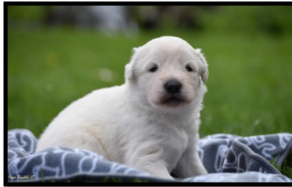
isä:Kalliovaaran Zeus Princ emä: Jäälinnan Kuun Haltiatar