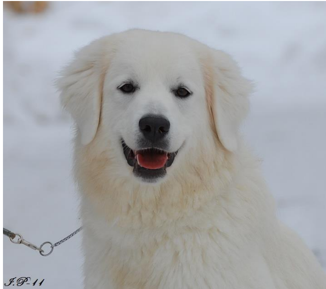
Jäälinnan Valkea Haave