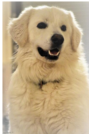
Jäälinnan Sydänten Murskaaja