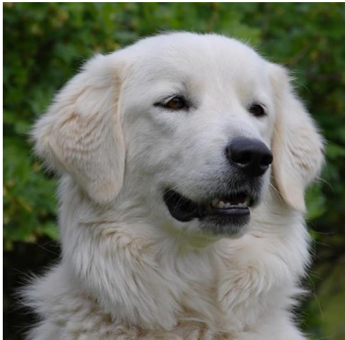
Jäälinnan Kuun Haltiatar