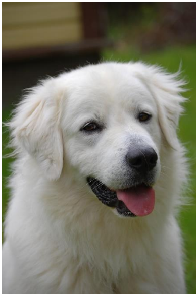
Apollo od Certova kopytka