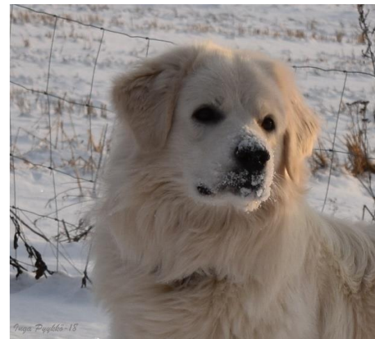
Tatrankaunottaren Bear Apollon