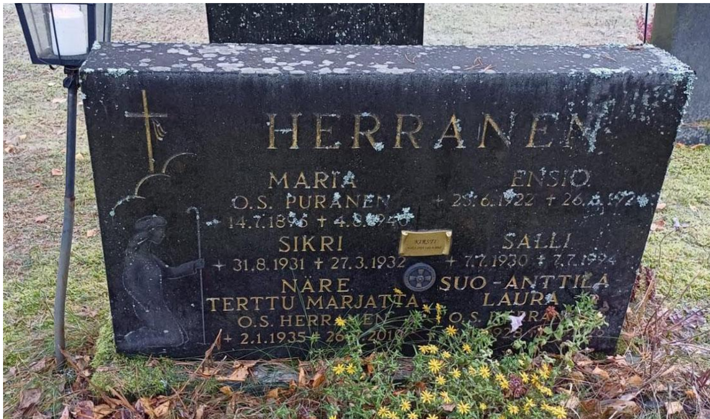
Herrasen perheen hautakivi Pihtiputaan hautausmaalla.