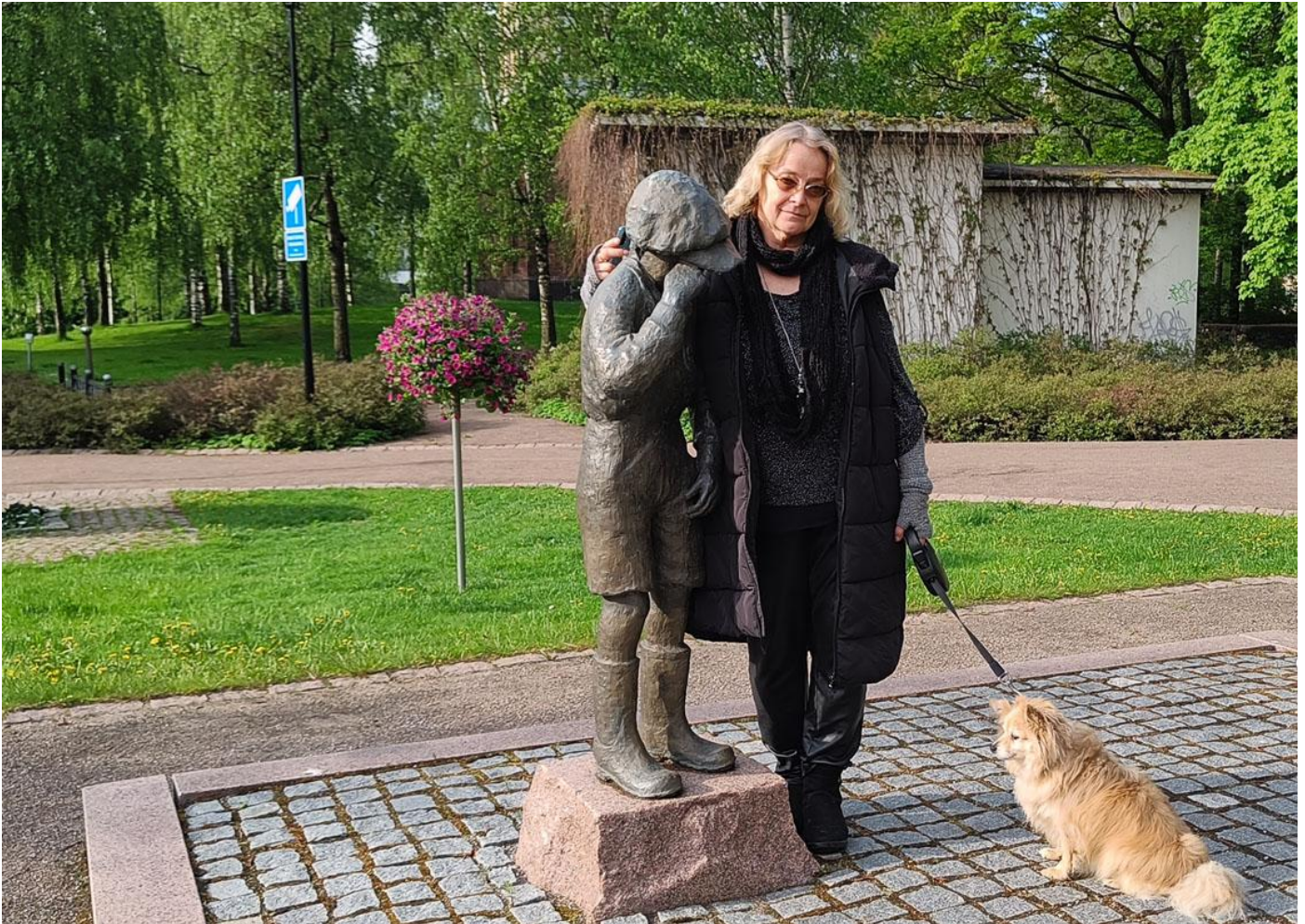
Ylhäällä Suomen sotien orpojen 1939-1945 muistomerkki Lappeenrannassa ja alhaalla siihen liittyvä patsas Sarin lohdutuksessa.