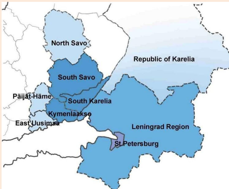
Kuva 14 Kaakois-Venäjä/Suomi