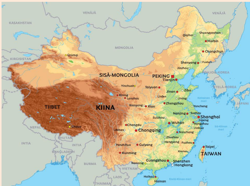
Kuva 6 Kiina

Hamppu liitetään tekstiileihin ja marihuana huumeisiin. Miksi? Sana "marihuana" on johdettu meksikon-espanjasta, kun taas "hamppu" on anglosaksista alkuperää: hennep , hamp tai vanha islanninkielinen sana hampr . Villiamppu taas on latinaksi cannabis ja kreikaksi kannabis . "Alkuperä tuntematon", huomauttaa eräs 1930-luvulla painettu sanakirja ja muistuttaa, että kasvia käytetään "purjekankaisiin, köysiin ja hirttoköysiin".