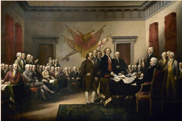
Kuva 20 MULLISTAVA KUITU. Yhdysvaltojen historian tunnetuin asiakirja painettiin todennäköisimmin hamppupaperille, joka oli peräisin Benjamin Franklinin paperitehtaasta. Nykyisin hamppupaperin osuus on muro-osa maailman papreintuotannosta.