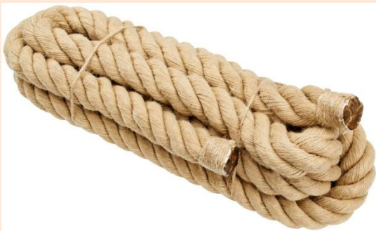
Kuva 4 HAMPPUKÖYSI. Hamppuköysi täytyi varella säännöllisin välein tervalla, jotta se pysyi kuivana eikä mädäntynyt. Tehtävä oli niin työläs, että hampuköysi jäi käytöstä.

U seimmat asiantuntijat ovat samaa mieltä siitä, että C.sativalla on pitkä ja sekava historia. Herodotos kertoo, että skyyttien maassa "kasvaa liinaa [hamppu] - - joka muistuttaa hyvin paljon pellavaa - - siitä tekevät traakialaiset itselleen vaatteitakin, jotka ovat aivan pellavasta, jotka ovat aivan pellavasta tehtyjen kaltaiset; niinpä joka ei ole erittäin perehtynyt siihen, ei voisi erottaa, onko kangas pellavaa vai liinaa". Hamppu on kuitenkin käytetty kankaana jo ennen skyyttejä: sitä käytettiin Kiinassa 4500 vuotta sitten (se mainitaan 2500 vuotta vanhoissa kirjoituksissa). Kiina jatkoi hampun viljelemistä, ja 1900 - luvun alussa se oli maailman suurin tuottaja. Seuraavina olivat Itä-Euroopan maat Romania, Ukraina ja Ukraina sekä Espanja, Chile ja Ranska.