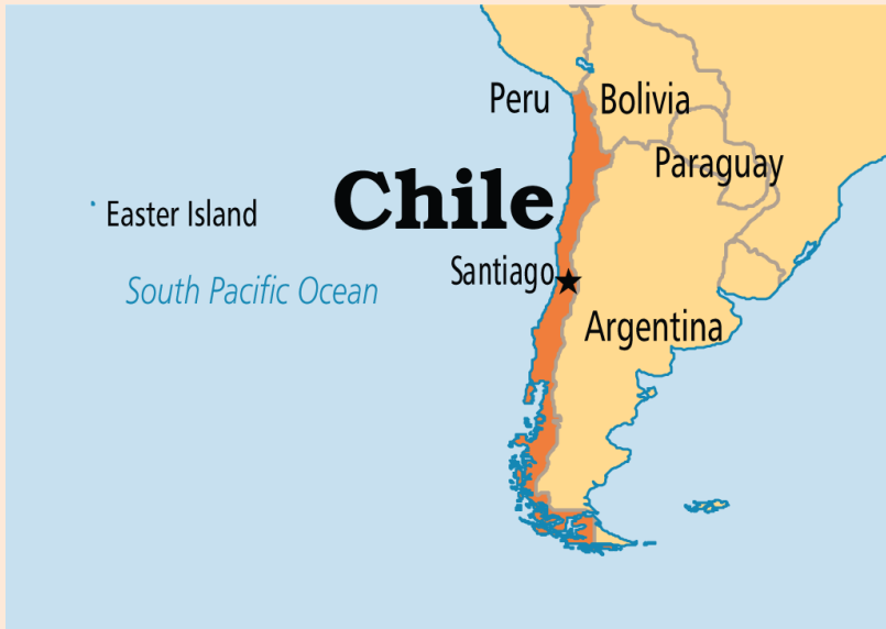
Kuva 12 Chile