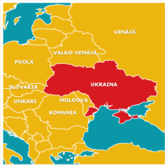
Kuva 9 Ukraina

N ykysiset hampun puolesta puhujat ovat halunneet ottaa hampun uudelleen käyttöön sillä perusteella, että siitä voi tehdä ympäristöystävällistä paperia - tukkien kuljettaminen ja puun muuttaminen selluloosaksi kuluttaa enemmän kemikaaleja ja saastuttaa pahemmin. He myös väittävät, että hamppu on ympäristöä ajatellen puuvillaa parempaa ja vaatii vähemmän torjunta-aineita ja kasvimyrkkyjä.