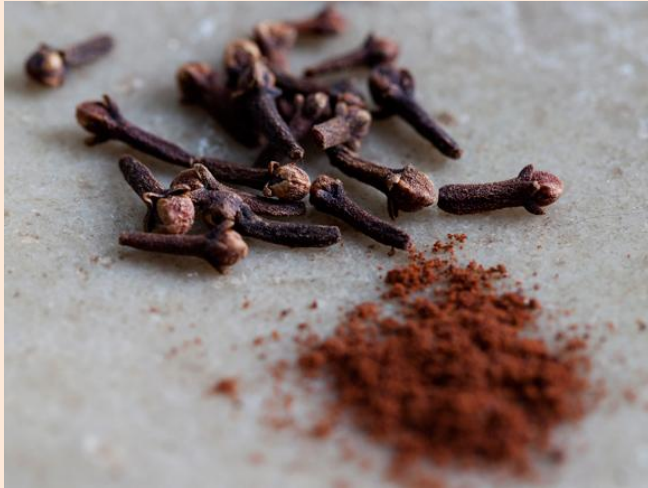
Kuva 5 jauhettu mausteneilikka