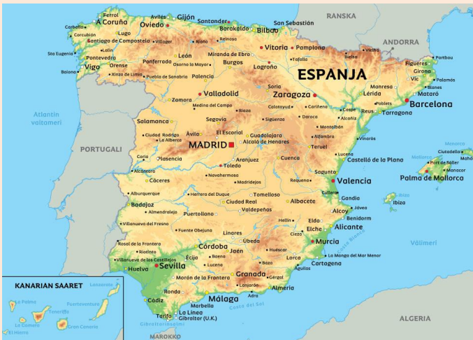
Kuva 11 Espanja

Ratsioista, pidätyksistä ja langettavista tuomioista huolimatta kotona poltettu ja salakapakoissa myyty viina kävi kaupaksi yhtä hyvin kuin ennen kieltolakia, mutta poliisin ja poliitikkojen korruptio kasvoi ennennäkemättömiin mittoihin. Hampua tai kannabista pidettiin yhtä turmiollisena päihteenä. Asiaa pahensi se, että "ruoho" oli alamaailman, meksikolaisten maahanmuuttajien ja mustien muusikkojen suosiossa. Kun vielä huumeviraston päällikkö Harry J. Anslinger ja lehtimoguli William Randolph Hearst tuomitsivat kannabiksen, arpa oli heitetty. Hearstin arvostelijat huomauttivat, että magnaatin imperiumiin kuului metsiä, joiden puista tehtiin selluloosaa, ja että siirtyminen hampusta tehtyyn paperiin olisi pienentänyt Hearstin voittoja. Hearst olisi tosin voinut ryhtyä tuottamaan hampua. Todennäköisemmin Hearst uskoi Anslingeria, joka vastusti kannabista äänekkäästi ja julkaisi liioiteltuja tai toteen näyttämättömiä raportteja kannabiksen haitoista.