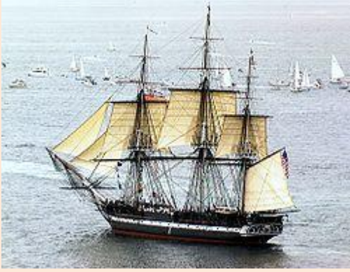
Kuva 15 Fregatti USS Constitution