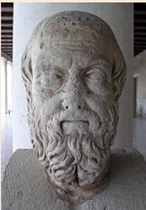
Kuva 3 Herodotos

H istoria toistaa itseään. "Savua tulee vetää syvään henkeen ja pitää keuhkoissa muutama sekunti, mikä on ei-tupakojien mielestä epämiellyttävää. Yrtti- tai mentolisavukkeen tupakka on miedompaa, mutta kurkun kannalta helpoin tapa on lisätä sätkään 6 jauhattua mausteneilikkaa. Pieninä, normaalisti nautittavina annoksina se tuottaa mukavan utuisen ja rentoutuneen tunteen. Ranskalaisilla impressionisteilla oli tapana ottaa suuria määriä, ja silloin vaikutus oli samantapainen kuin LSD:llä. "Näin kirjoitti Nicholas Saunders kirjassaan Alternative England and Wales (1975).