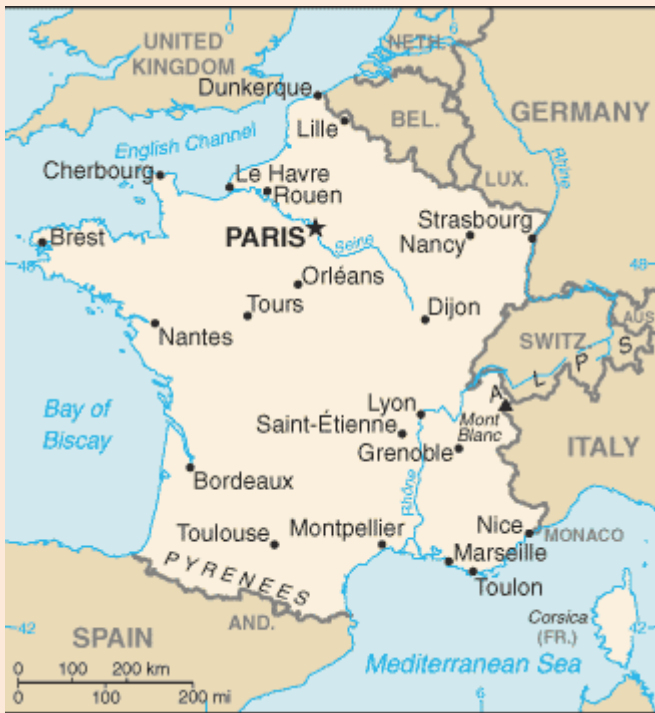
Kuva 13 Ranska