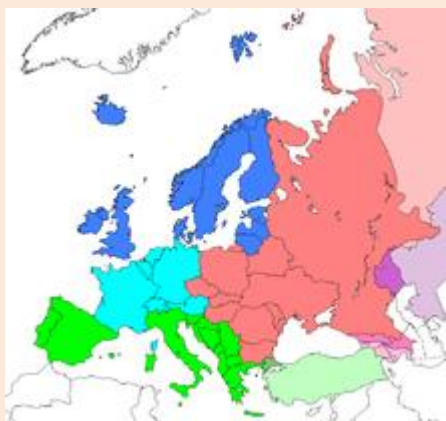
Kuva 7 Itä-Eurooppa