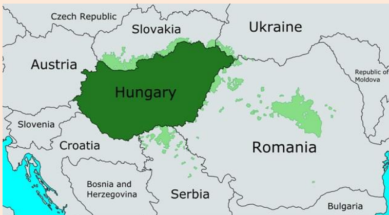
Kuva 10 Unkari

N ykysiset hampun puolesta puhujat ovat halunneet ottaa hampun uudelleen käyttöön sillä perusteella, että siitä voi tehdä ympäristöystävällistä paperia - tukkien kuljettaminen ja puun muuttaminen selluloosaksi kuluttaa enemmän kemikaaleja ja saastuttaa pahemmin. He myös väittävät, että hamppu on ympäristöä ajatellen puuvillaa parempaa ja vaatii vähemmän torjunta-aineita ja kasvimyrkkyjä.