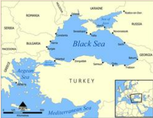
Kuva 2 Mustameri

H istoria toistaa itseään. "Savua tulee vetää syvään henkeen ja pitää keuhkoissa muutama sekunti, mikä on ei-tupakojien mielestä epämiellyttävää. Yrtti- tai mentolisavukkeen tupakka on miedompaa, mutta kurkun kannalta helpoin tapa on lisätä sätkään 6 jauhattua mausteneilikkaa. Pieninä, normaalisti nautittavina annoksina se tuottaa mukavan utuisen ja rentoutuneen tunteen. Ranskalaisilla impressionisteilla oli tapana ottaa suuria määriä, ja silloin vaikutus oli samantapainen kuin LSD:llä. "Näin kirjoitti Nicholas Saunders kirjassaan Alternative England and Wales (1975).