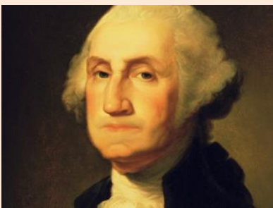
Kuva 18 George Washington