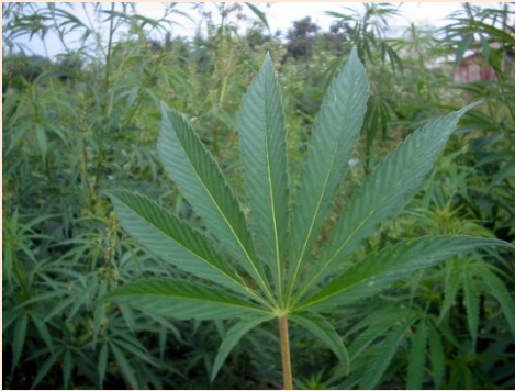
Kuva 1 Hamppu

K annabis, hamppu, marihuana; tämän kasvin kaikilla nimillä on ikävä kaiku. Vaikka poliitikot, poliisit ja nuorten vanhemmat tuomitsevat käyttämisen, sitä pidetään maailman levinneimpänä viihdehuumena. Hamppu on kuitenkin yksi vanhimmista viljelykasveista; sillä oli suuri merkitys vähintään kahdelle Yhdysvaltojen presidentille, Yhdysvaltojen itsenäisyysjulistus painettiin sille ja siitä saattaa tulla pelastava "vihreä" viljelykasvi. Mikä sitten meni vikaan Cannabis sativan osalta?