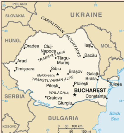
Kuva 8 Romania

paperikoneen raaka-aineena. (Sekä George Washingtonilla että Thomas Jeffersonilla oli oma hamppuviljelmä.) Itsenäisyysjulistusta luonnosteltaessa käytettiin melkein varmasti Franklinin tehtaan tuottamaa hamppupaperia.