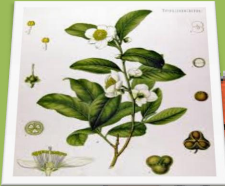
Kuva 4 Camelia sinensis