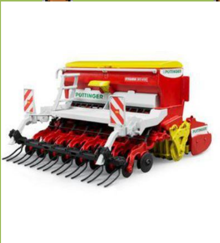
Kuva 6 rivikylvökone