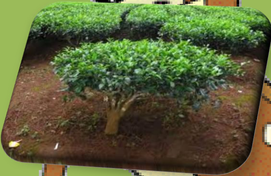
Kuva 5 Camelia sinensis-puu