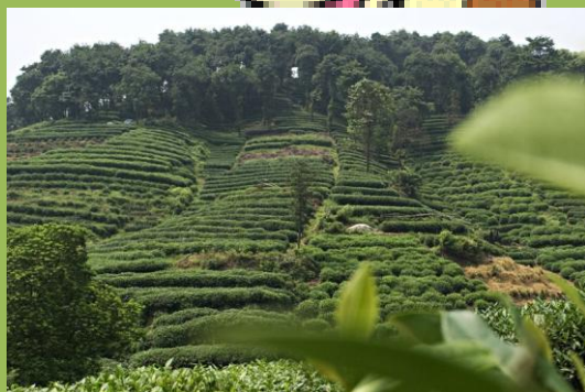
Kuva 1 teepeitto

Täyttyneet korit kuljetettiin varastoon, jossa vihreät lehdet saivat lakastua. Sitten ne käänittiin rullalle, fermentoitiin, 1 kuivattiin ja luokiteltiin tuotettavan teen tyyppiin mukaan. Kaukoidässä perinteisesti juotua vihreää teetä tehtiin kuumentamalla lehtiä niin, etteivät ne mustuneet fermentoimisen aikana. Länsimaalaisten suosima musta tee jaettiin laadun mukaan moneen luokkaan.