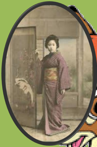
Kuva 2 Geishacyttö