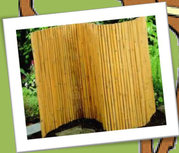
Kuva 3 Bambusermi