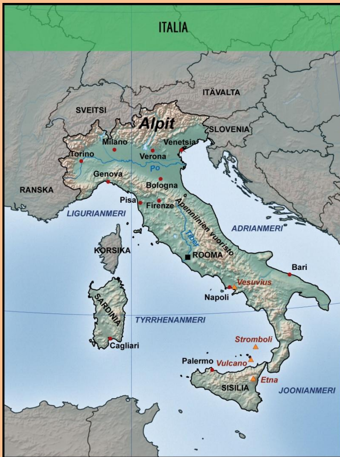
Kuva 6 Adrianmeri

56,2- kiloisesta maailmanennätyskaalista, jonka Bernard Lavery kasvatti Etelä-Walesin Llanbarrissa vuonna 1989.