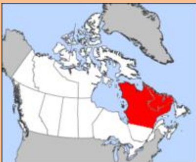
Kuva 8 Labradorin niemimaa3

Toisen maailmansodan aikoihin Yhdysvaltojen maatalousministeriö vastusti kaikkia yrityksiä "kyntää puistot ja nurmikentät vihannesten kasvattamista varten". Ruoan liikatuotanto oli suurempi kuin koskaan ja lanoitteeksi sopivaa typpe' käytettiin kannattavampiin tarkoituksiin, kuten räjähteiden valmistamiseen. Kun Burpee Victory Garden Seed Packet-siemenpaketti tuli myyntiin vuonna 1942, siemenkauppa kolminkertaistui ja noin neljä miljoonaa amerikkalaista liittyi omatarveviljelijöiden joukkoon. Vuonna 1943 ruokasäilykkeet pantiin kortille, ja presidentin rouva Eleanor Roosevelt käski istuttaa Valkoisen talon nurmikentille porkkanoita, papuja, tomaatteja ja kaaleja. Kasvilavat katosivat nurmikenttien tieltä 60 seuraavaksi vuodeksi, kunnes Michelle Obaman aviomies käski presidentiksi valitsemisensa jälkeen palauttaa kasvilavat ennalleen.