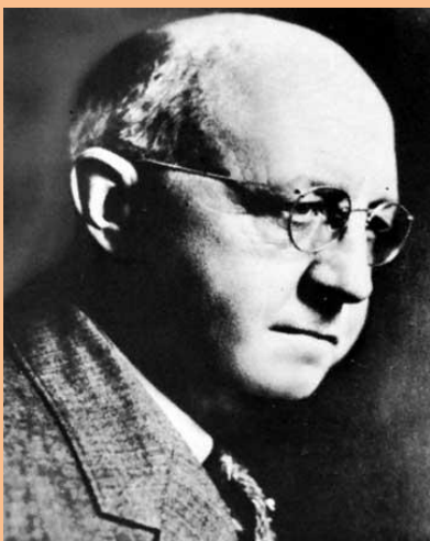
Kuva 9 Clarence Birdseye

Sotapönnöksissä autoivat "Chase Continuous Cloche", lasikuvut, jotka lupasivat "kaksinkertaistaa vihannestuotannon tilantarvetta lisäämättä, lyhentää kasvuaikaa viikkoja ja tuottaa tuoretta syötävää vuoden ympäri". Opaskirjan Cloches versus Hitler sai parilla kolikolla. Ministeriö järjesti Kaivamalla voittoon-näyttelyitä, teetti viihannesviljelmiä esittelykäyttöön ja kehotti maan jokaista koulua perustamaan oman kasvimaan. Näiltä viljelymailta saatiin runsaasti tuoreita vihanneksia, ja monista oppilaista tuli sodan jälkeen vihannesviljelijöitä. Sodanaikaisella kaalinkulutuksella oli toinenkin etu, kuten kirjailija George Orwell huomautti: "Useimmat ihmiset ovat paremmin ruokittuja kuin ennen. Lihavia on vähemmän." Kansalaisten luja terveys oli osaksi kaalin ansiota.