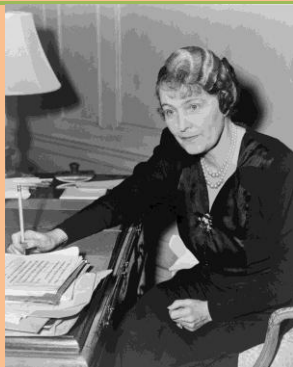
Kuva 13 Marjorie Merriweather Post