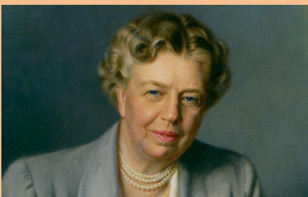
Kuva 2 Eleanor Roosevelt