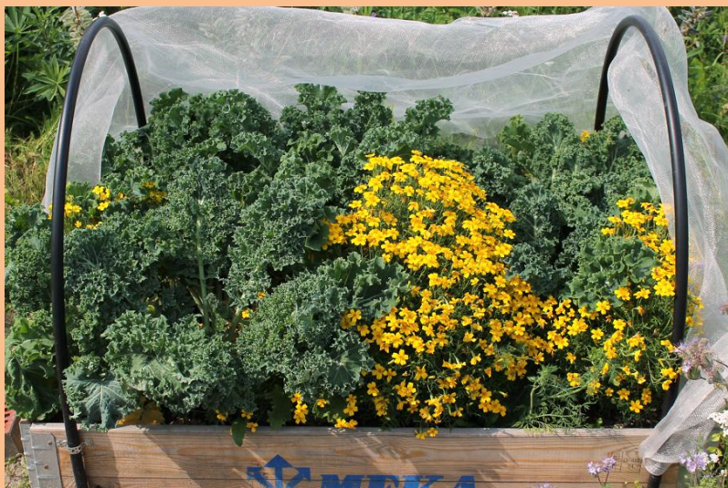
Kuva 12 lehtikaali

Keltakukkainen lehtikaali on levinnyt maailman useimpiin kolkkiin. Vihanneksilla on omat piilomerkityksensä, samoin kuin kukilla (punainen ruusu tarkoittaa rakkautta ja unikko muistamista). Esimerkiksi herne, "kevään airut", symboloi Viktorian ajan puutarhakirjailijan John Loudonin mielestä kunnioitusta, peruna hyvántahtoisuutta – kaali tietenkin voittoa ja hyötyä