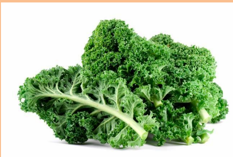
Kuva 4 lehtikaali

Asiakkaan lausunto Burpee-siemenluettelossa (1888)