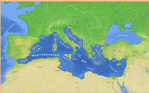
Kuva 5 Välimeri

Pohjois-Kanadan Labradorin jäisillä lakeuksilla 1900-luvun alussa eräs turkismetsästäjä rikkoi jääkuoren suolavesitynnyreiden päältä onkiakseen vedestä jäätyneen kaalinpään. Clarence Birdseye eli Bob, kuten hän halusi itseään kutsuttavan, oli omaksunut erikoislaatuisen tavan jäädyttää ruokaa ollakseen mieliksi vaimolleen Eleanorille, joka kaipasi kovasti tuoreita vihanneksia jään peittämässä erämaassa. Bob Birdseye ansaitsi ideallaan omaisuuden, kuten kohta näemme.