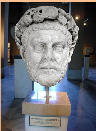
Kuva 1 Rooman keisari Diocletianus

Mihin puutarhuri joutuisikaan ilman kaalimaata? Keltit kasvattivat kaalia puutarhoissaan jo 2500 vuotta sitten, sitä ovat suosineet lukemattomat vihannesviljelijöiden sukupolvet Rooman keisarista Diocletianuksesta Yhdysvaltojen ensimmäisiin naisiin Eleanor Rooseveltiin ja Michelle Obamaan saakka. Siitä sai alkunsa myös säilykeruokien vallankumous.