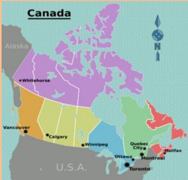
Kuva 7 Pohjois-Kanada

Sodan loppuessa englannissa kasvatettiin hämmästyttävät kaksi miljoonaa tonnia vihanneksia joka vuosi, ja monet sotilaat palasivat parantelemaan haavojaan ja viljelemään omia kaalimaitaan. Vihannestarhan hoitaminen auttoi sotilaita toipumaan rintaman kauhuista.