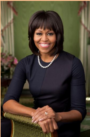
Kuva 3 Michelle Obama

Lähettämämme Vandergraw Cabbage-siemenet menestyivät paljon paremmin kuin Large Late Flat Dutch.