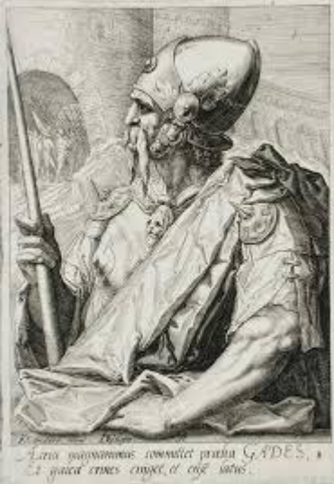
Kuva 6 Jacques de Gheyn III