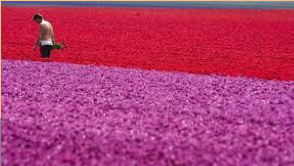
Kuva 3 Tulppaanipelto 2.

Mongoliaan ja saapunut sitten Eurooppaan. Turkkilaiset puutarhurit saivat nykyisin Alankomaita somistavat tulppaanit kukoistamaan tuhat vuotta sitten. (Vaikka tulppaanista tuli Alankomaiden tunnuskukka, se oli myös Unkarin, Turkin ja Kirgistanin kansalliskukka.)