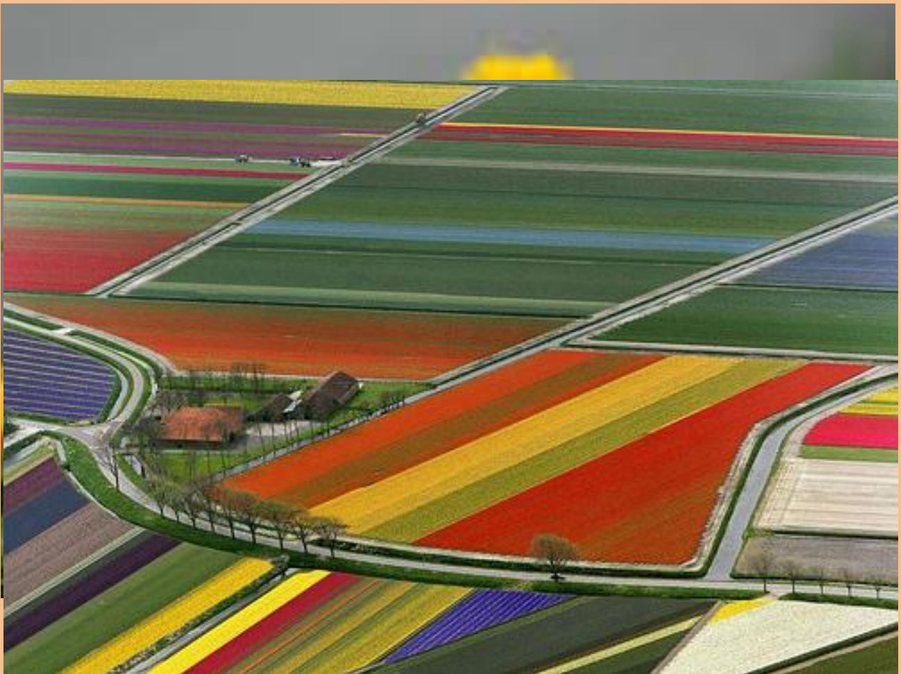
Kuva 2 Tulppaanipelto

Nykyään ihmiset kerääntyvät joka kevät ihailemaan Alankomaiden tulppaanipeltojen kukkaloistoa. Yli 10 000 hehtaarin laajuisilta pelloista saadaan 60 % maailmassa myytävistä leikkokukista ja noin 10 miljardia kukkasipulia.