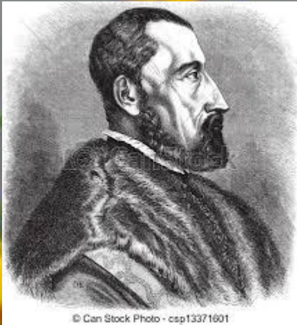
Kuva 5 Ogier Ghiselin de Busbecq

Leidenissä L' Écluse jatkoi kukkiensa kasvattamista. Anteliaana miehenä hän lahjoitti sipuleita muille kukkien ystäville ja taiteilijoille, kuten Jacques de Gheyn II:lle ja Rubensille (jonka töitä hän ihaili) kasvitieteellisiä tarkoituksia varten. Hän kieltäytyi myymästä sipuleita ahneille välittäjille. Sipulikauppa kuitenkin paisui yli äyräiden: vuonna 1637 myytiin kaksi kukkasipuli 6700 guldenilla, joka vastasi 50 vuoden keskiarvopalkkaa ja jolla sai talon puutarhoineen sievän amsterdamilaisen kanavan tuntumasta. Turhautuneet välittäjät eivät viitsineet kinastella L' Éclusen kanssa, vaan varastivat hänen kokoelmansa. Saaliista tuli Alankomaiden kukkateollisuuden perusta.