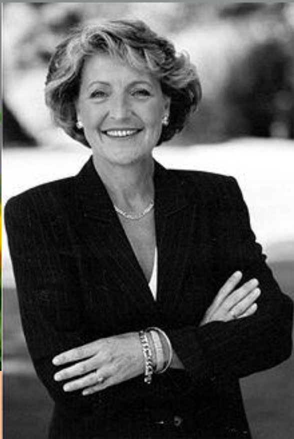
Kuva 7 Prinsessa Magriet