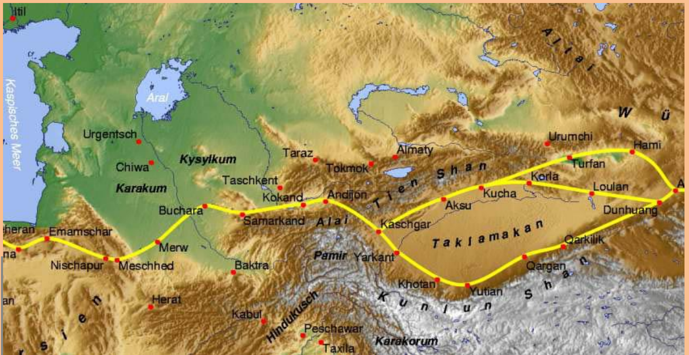
Kuva 8 Tien-Shan vuoristo