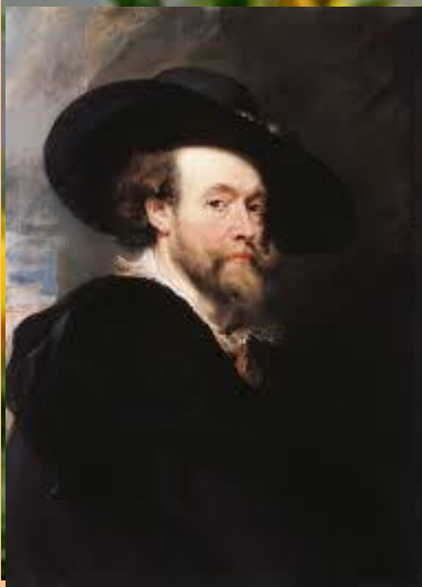
Kuva 1 Peter Paul Rubens