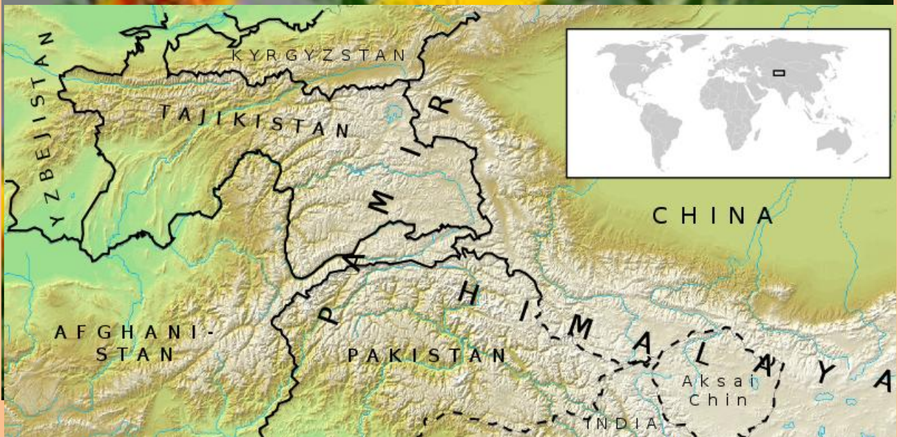
Kuva 9 Pamir-Alain vuoristo