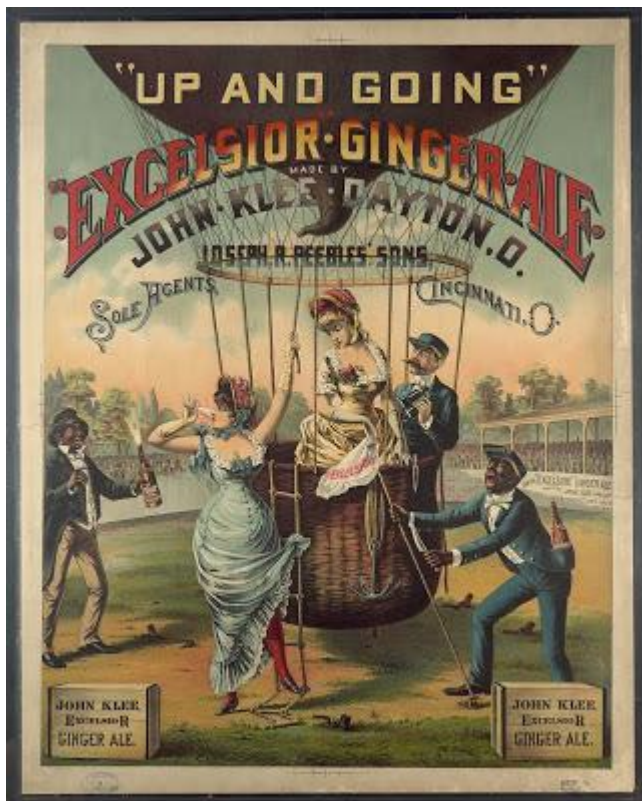
Kuva 2 Liikettä niveliin. Lämmittävä inkivääri, joolaa oli pistäväntuokuiset kukat, pani vauhtia maustekauppaan. Inkivääriolut oli suosittua Yhdysvaltojen kieltolain aikana, koska sitä pidettiin uskallettuna.