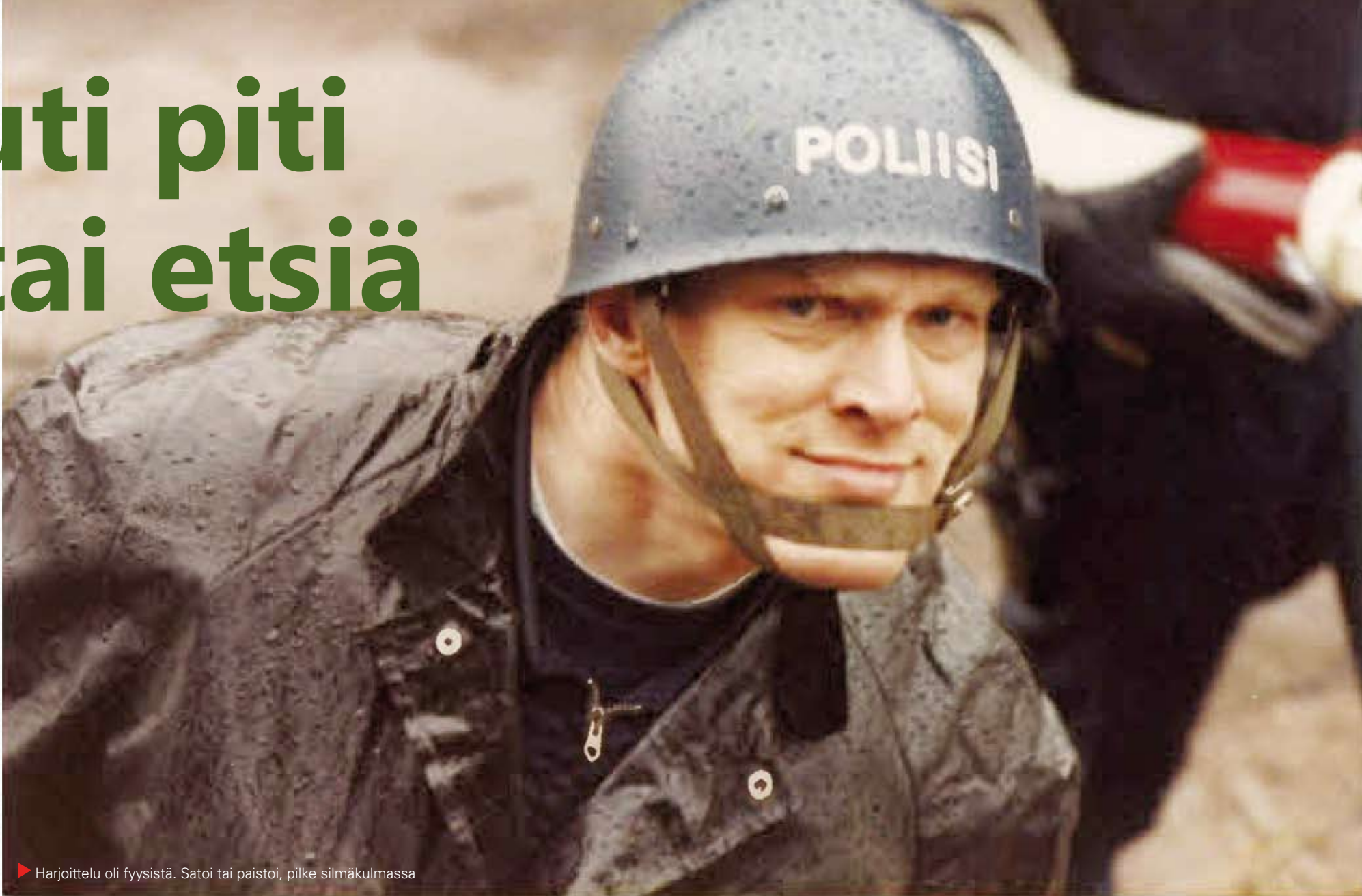
▶ Harjoittelu oli fyysistä. Satoi tai paistoi, pilke silmäkulmassa

*KOLMANNEN PÄIVÄN AAMUNA NEUVOSTOLIITON SUURLÄHETILÄS HALUSI RATKAISUN JA TARJOUTUI TUOMAAN VAIKIKALASTA TARVITTAVAT VOIMAT. SUOMEN HALLITUS JA POLIISIYLIJOHTAJA KIELSIVÄT PÄÄTTÄVÄISESTI TARJOTUN AVUN.