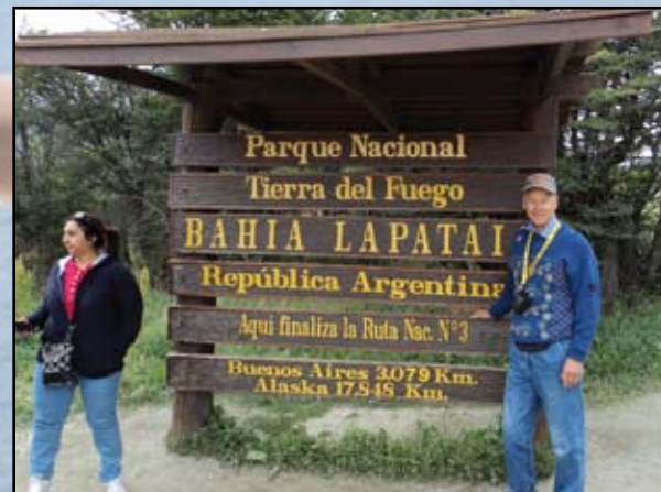
► The End of the World

” unelmani on vihdoin toteutunut - Etelämantereen oli enemmän kuin osasin odottaa! ”