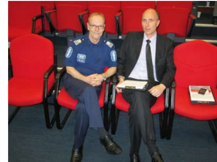
► Jutun kirjoittaja ja valokuvaaja neuvonpidossa.