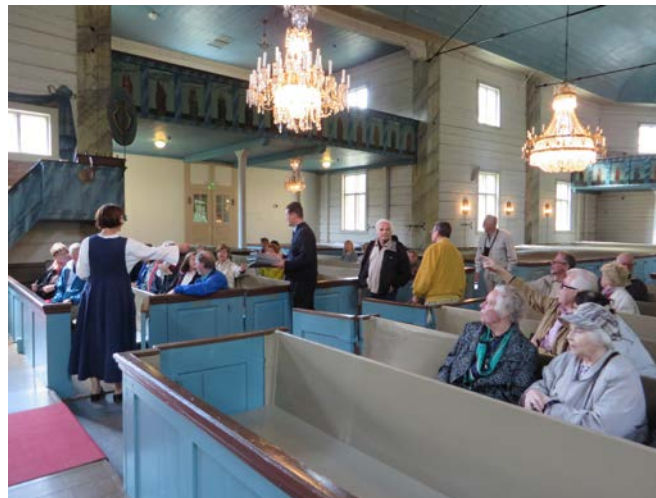
Vesilahden kirkko 2014. Oppaan takana lukkarin ”saarnastuoli”.