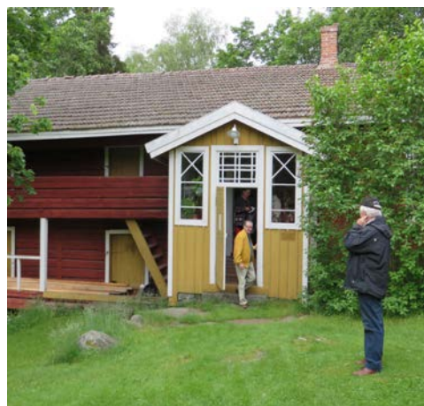
Oiva Paloheimon taiteilijakoti vanhan pappilan pihapiirissä