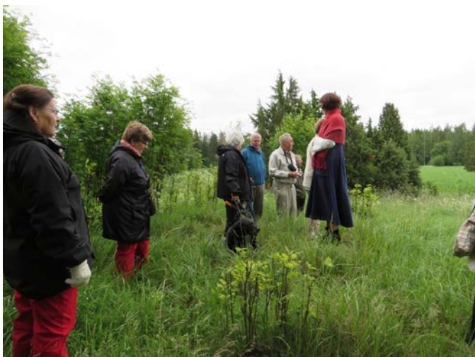
Marttilan talon” raunioilla”