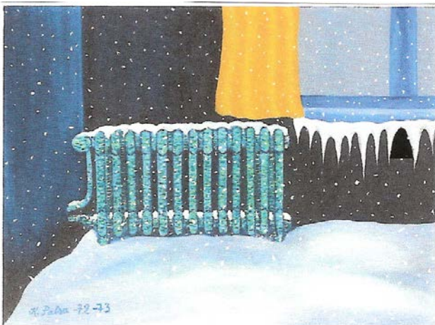
Kalervo Palsa: Sininen hetki 1972-1973

Ensimmäinen tutustumiskohde Mäntässä oli Taidekeskus Honkahovi. Funkkiskartano, jossa paperipatruunat kestivät valtionpäämiehiä, on nyt uniikki taidehotelli.