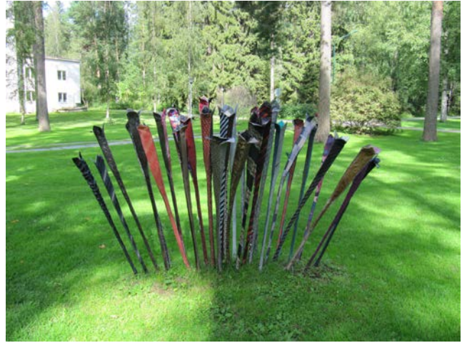
Kravatit suorana

jonka hän poltti sivu kerrallaan saunan pesässä. Palsa ei ollut taiteilija, eikä kirja sen arvoinen, että sen olisi voinut sijoittaa omaan hyllyyn. Taide ihastuttaa tai vihastuttaa.