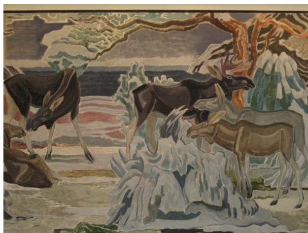
Osa Valkoisen talon aulan freskosta

Taiteen kyllästävä päivä oli kuitenkin edennyt jo niin pitkälle, että ihan jokainen meistä ei jaksanut täysipainoisesti paneutua näyttelyyn.