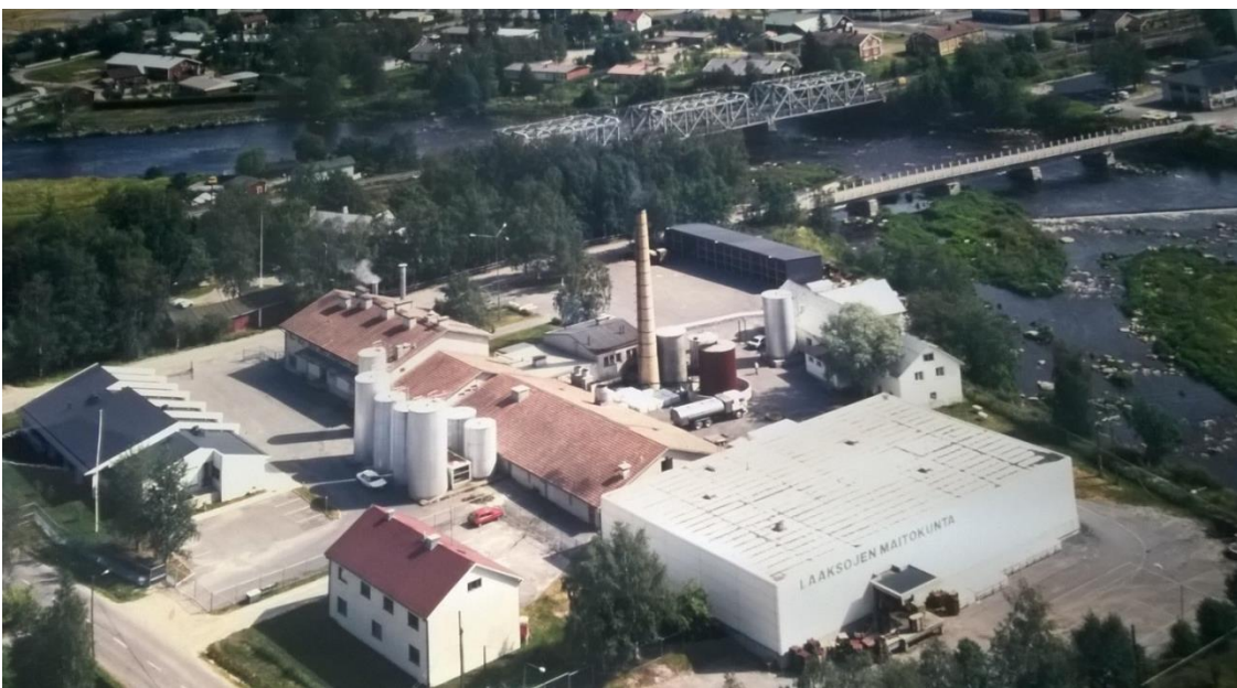
Laaksojen Maitokunnan rakennukset 1980-luvulla. Takana näkyy Savisilta ja vanha rautatiesilta.