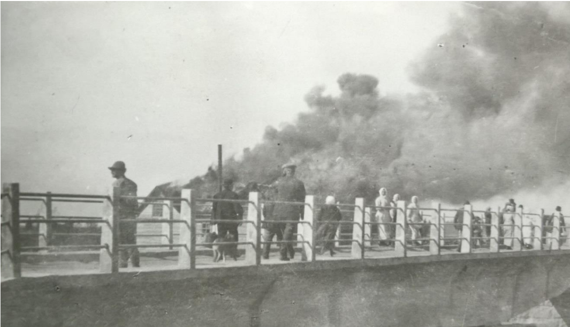
Kuvassa väkijoukko katsomassa meijerin paloa Savisillalta 31.5.1918

Ensimmäinen suuri vastoinkäyminen oli viedä monen jäsenen ja maidontuottajan uskon omaan meijeriin. Tuli nimittäin tuhosi vastarakennetun meijerin 31.5.1918. Palaneen osan korjaaminen vei aikaa noin puoli vuotta ja seisokki oli luonnollisesti raskasta aikaa taloudellisesti. Joulukuussa uusi meijeri oli kuitenkin taas valmis aloittamaan toimintansa. Jo tänä epäonnisena ensimmäisenä toimintavuotenaan meijeri otti vastaan 78 854 kg maitoa ja valmisti voita vajaan 3 000 kg. Juuri itsenäistynyt Suomi loi tulevaisuudenuskoa, joka sai jatkamaan entistä suuremmalla innolla vastoinkäymisten läpi.