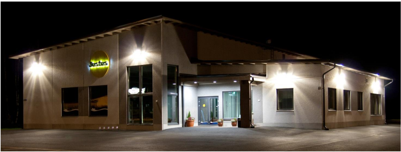
Uusi Justus-myymlä ja Laaksojen Maitokunnan konttoritilat valmistuivat keväällä 2011

Justus-myymlä on vakiinnuttanut paikkansa palvelevana erikoismyymlänä, josta löytää maataloustarvikkeiden lisäksi elintarvikkeita, lahjatavaroita ja paikallisia tuotteita.