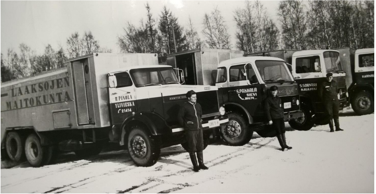
Imukeräilyautot maaliskuussa 1974. Meijerin nimi on vaihtunut Laaksojen Maitokunnaksi