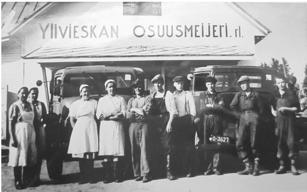
Meijerin henkilökuntaa ja kuljetuskalustoa 1950-luvulla

Maitomäärä alkoi kasvaa nopeasti: vuonna 1948 päästiin jo lähes takaisin vuoden 1930 lukemiin eli noin 750 000 kiloon, seuraavana vuonna maitoa tuotettiinkin jo lähes 1,8 miljoonaa kiloa. Aiemmat ennätykset lyötiin vuonna 1956, jolloin vastaanotettu maitomäärä ylitti 10 miljoonaa kiloa. Tämä tiesi meijerille merkittävää asemaa koko seudulla. Oulaisten Osuusmeijeri joutui lopettamaan toimintansa jo sodan aikana ja maidon kuljetukset aloitettiin Oulaisista Ylivieskaan. Ylivieskan Osuusmeijeriin saatiin myös runsaasti uusia jäseniä mm. Sievistä, Rautiosta ja Alavieskasta.