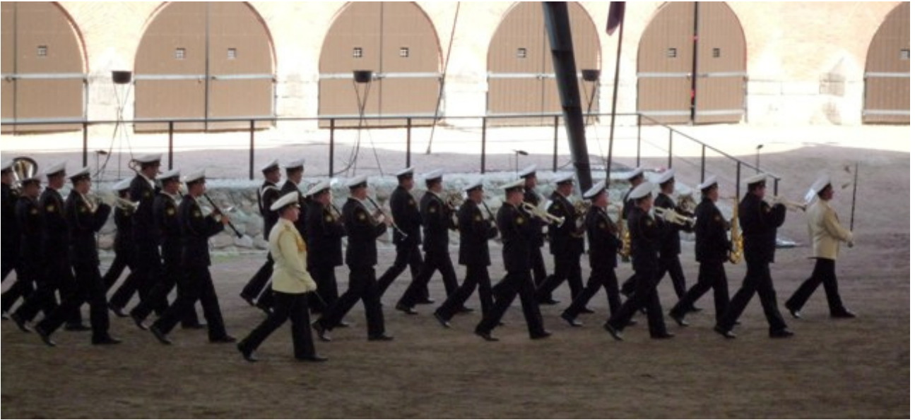
Sitten tulivat Merisota-akatemia Soittokunta Venäjältä.