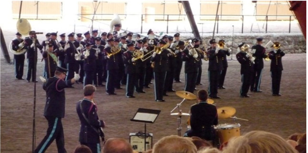
Belgian Ilmavoimien Kuninkaallinen Soittokunta Belgiasta.