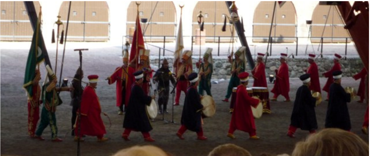
Bursa Mehter Turkista.