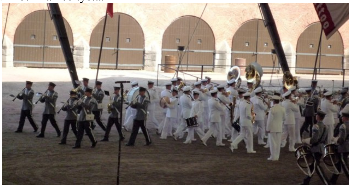
Prologina esiintyi Laivaston Soittokunta, Satakunnan Sotilassoittokunta ja Puolustusvoimien Varusmiessoittokunta. Prologin jälkeen kaksi ensin mainittua esitti oman ohjelmansa.