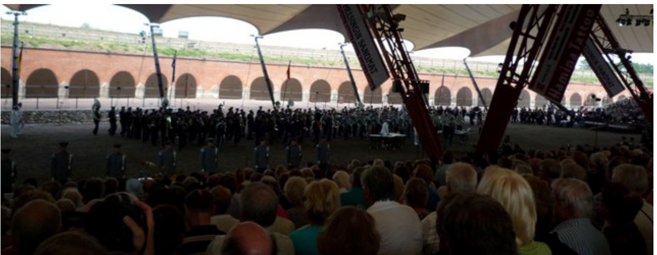
Minkä jälkeen kokoontuivat kaikki esiintyjät vielä kerran arenalle. Yhteisesityksenä esitetyn finaalin jälkeen olikin aika lähteä kotia kohti.