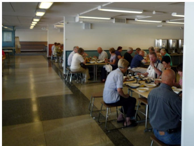
Bussimatkan ja Haminan varuskunnassa syödyn lounaan jälkeen