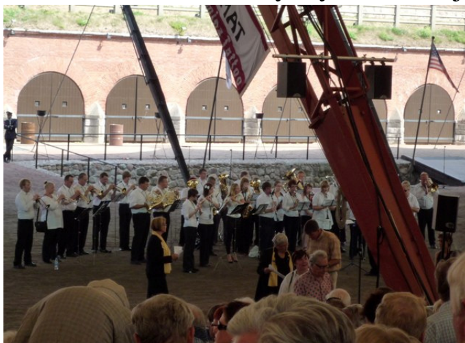
siirryttiin pikkuhiljaa Bastionille jossa alkuohjelmana kuultiin Quattro di Bothnian esitystä.