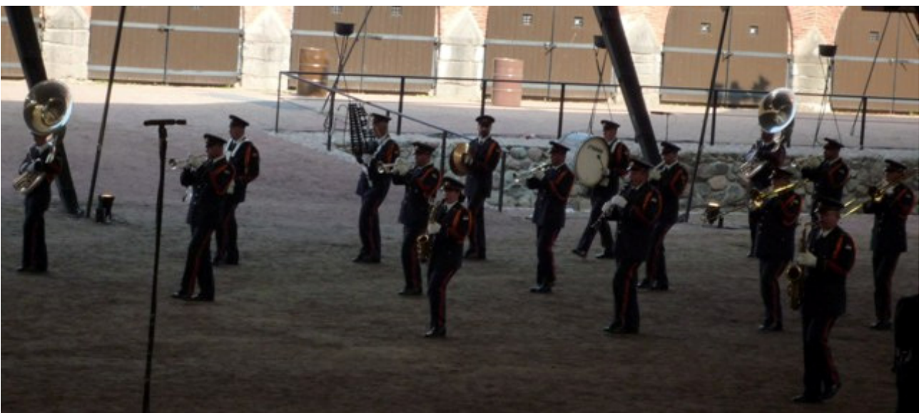
Viron Puolustusvoimien Soittokunta.