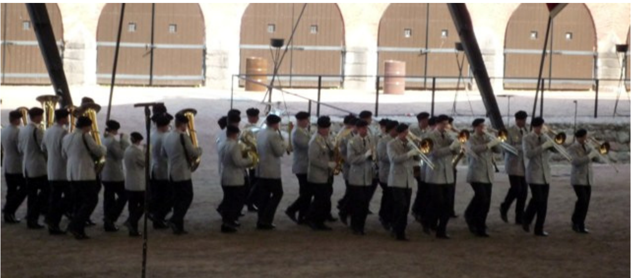
Heeresmusikkorps 10 Saksasta.