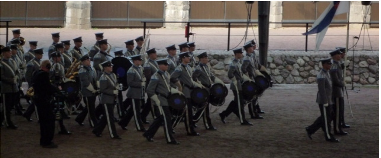
Sekä Puolustusvoimien Varusmiessoittokunta omalla esityksellään.