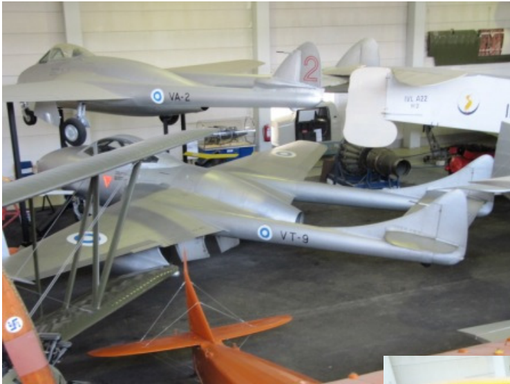
Koneita oli halliin