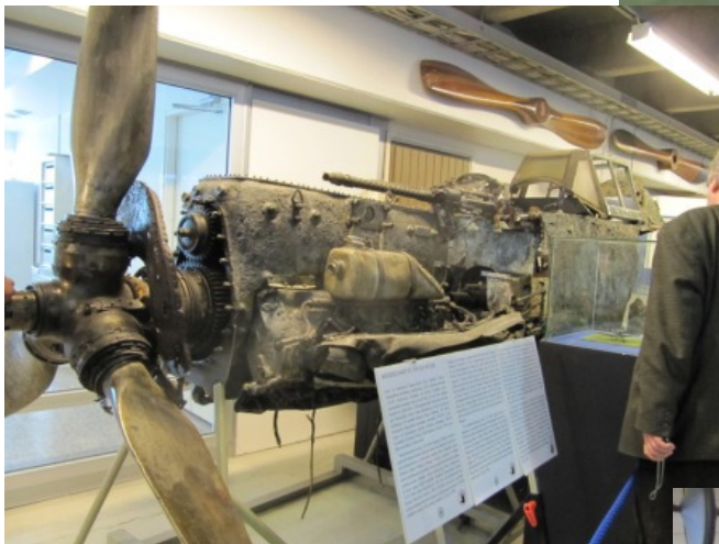
1. hallissa oli sotilaskoneita niin merestä pelastettuja vanhempia