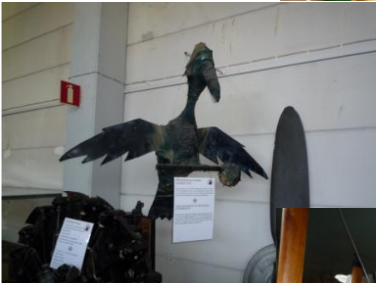
Lentolaivue 34:n tunnus vuodelta 1943