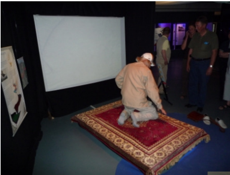
Välihallissa pääsi kokeilemaan lentävä matto simulaattoria