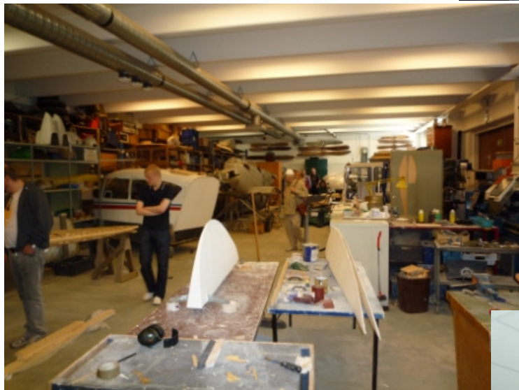
Pääsimme myös käymään museon verstaassa jossa koneita huolletaan ja kunnostetaan näytteillepanoa varten.