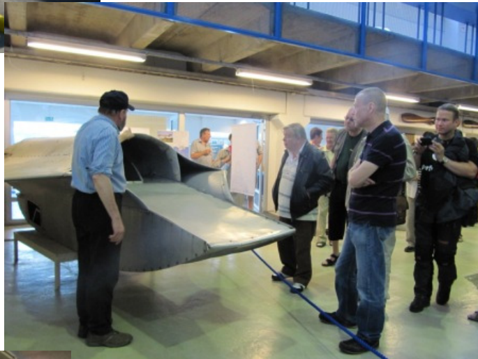
Joukko kiltalaisia kävi tutustumassa Ilmailumuseoon.