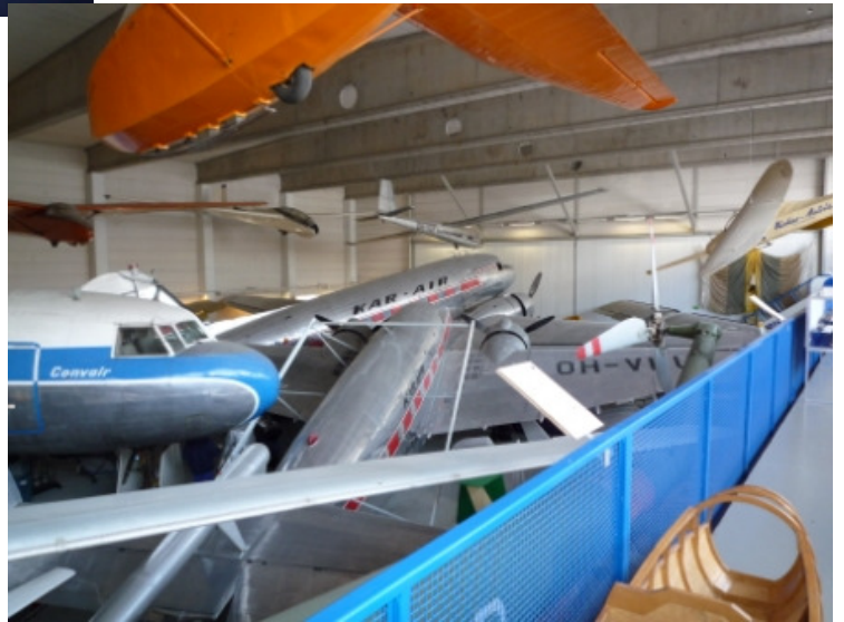
2. halli oli siviili-ilmailun käytössä.