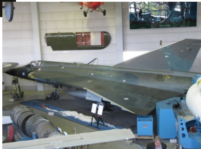
Kuin käytöstä poistettuja uudempiakin koneita.