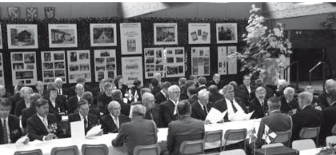
■ Sotilaskotiin koottu valokuvanäyttely kertoi killan uroteoista 40 vuoden ajalta.

Kiltalaisten on mahdollisuus osallistua myös rykmentin perinne- ja juhlatilaisuuksiin sekä Kaartin Soittokunnan konsertteihin. Rykmentti ja kilta järjestävät lisäksi yhdessä omaistenpäivät ja veteraanipäivät. Näihin osallistuu runsaasti kiltalaisia. Myös monet