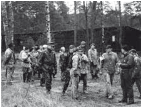
■ Kiltakisa yhdisti Helsingin kiltoja ja loi pohjaa tulevalle yhteistyölle.