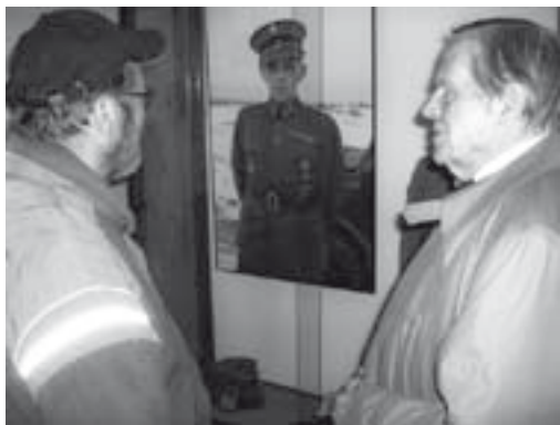
■ Killan retket kohdistuvat usein erilaisiin sotahistoriallisiin kohteisiin.

Kaksi kertaa vuodessa pidettäviin vuosikokouksiin ja niiden yhteydessä järjestettäviin esitelmiin osallistuu enimmillään jopa 80 jäsentä. Ennen varsinaista kokousta killan valtuuskunta kokoontuu omaan kokoukseensa. Vähintään kerran vuodessa rykmentin komentaja tai esikuntapäällikkö käy kertomassa rykmentin nykytilas-