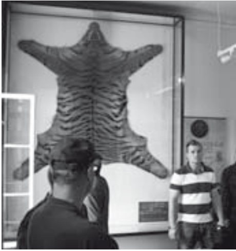
■ Jääkäritalon perinne-esineistöä kartutetaan jatkuvasti. Vuoden 2008 merkittävin lahjoitus oli Mannerheim-museosta Jääkäritalolle luovutettu tiikerintalja. Marsalkka Mannerheim toi taljan mukanaan Nepalin matkaltaan.

kana käytössä olleet tyypillisimmät mallit kivääreistä, konepistooleista ja pistooleista. Lisäksi esillä on muutamia yleisimpiä raskaita käsiaseita kuten pikakivääreitä, konekivääri, panssarintorjuntakivääri ja panssari-nyrkki.