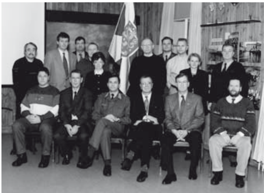
■ ”Yhteistyöryhmän tunnuslauseeksi muodostui ensimmäisen vuoden aikana: Me tuemme kaartin jääkäreitä – me tuemme pääkaupunkiseudun turvallisuutta.”

Yhteistoimintaryhmä ja sen alaiset työryhmät kokoontuivat ahkerasti vuoden 1997 aikana. Kokoukset olivat tärkeä tiedonsaanti ja -jakokanava sekä kiltojen että rykmentin johdolle.