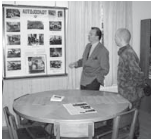
■ Kaartinsalissa on Mannerheimin 75-vuotissyntymäpäivälahjaksi saama aamiaispöytä. Pöydän takana olevien valokuvien joukossa on mm. kuva presidentti Rytistä ja Hitleristä.

Vuoden 2005 alussa rykmentti teki talossa sähköremontin. Samalla taloon rakennettiin hälytysjärjestelmä ja sinne asennettiin ajanmukaiset av-laitteet. Vuonna 2005 kiltalaiset remontoivat ja sisustivat asehuoneen. Asehuoneessa on nyt esillä itsenäisyyden ai-