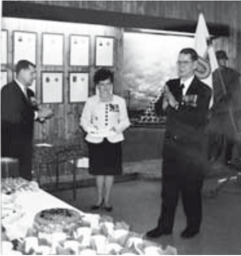
■ Uudenmaan Jääkäripataljoonan killan lippu juhlisti killan tilaisuuksia.

Kun killan perustavassa kokouksessa 4.8.1963 kävimme nimekeskustelua, lähes kaikki olivat JP2:n miehiä. He ehdottivat nimeksi JP2:n kiltaa. Pataljoonan komentaja huomautti siitä, että jos me valitsimme nimeksi Uudenmaan Jääkäripataljoonan Kiltta, me pystymme toimimaan sillä tulevaisuudessakin. Pitää katsoa tulevaisuuteen ja nuoriin, joista tulee uudenmaanjääkäreitä.