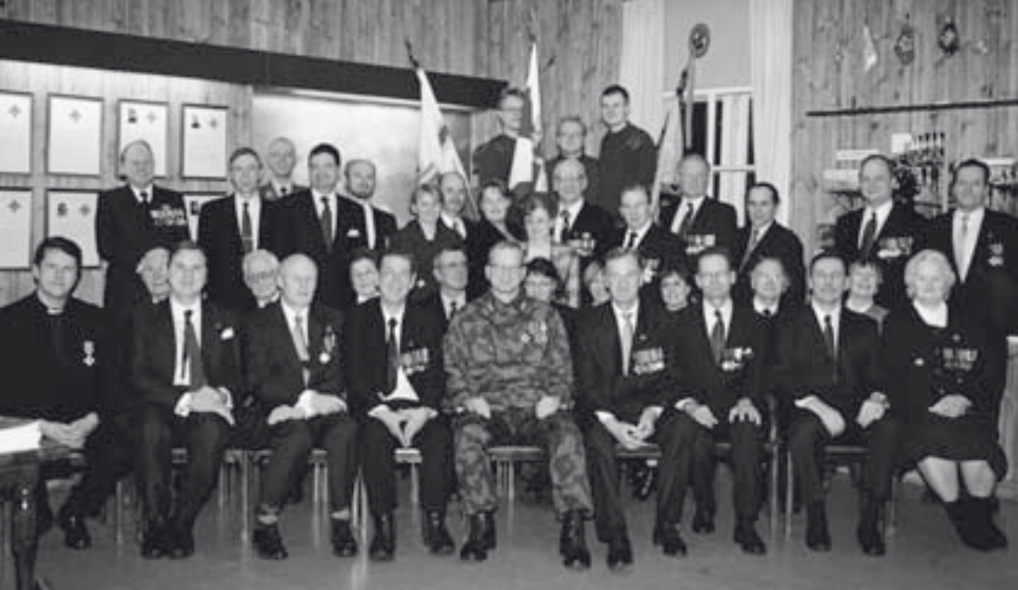
■ Yhteistyövaliokunta kokoontui Jääkäritalolle rykmentin valapäivänä 3.2.2002.

pungit, veteraanijärjestöjä sekä Roihuvuoren seurakunta. Varsinkin toiminnan alkuvaiheessa, killalla oli merkittävä rooli rykmenttiä koskevan ajankohtaisen tiedon välittämisessä yhteistyökumppaneille.