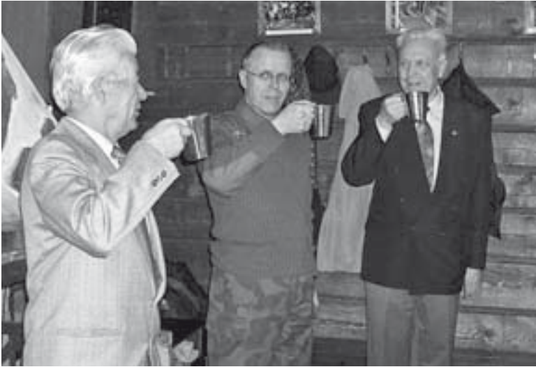
■ Killan hallitus ”kylvettä” tulevat ja lähtevät komentajat killan saunalla.

osallistuu erityisesti veteraani- ja maanpuolustusjärjestöjen vierailulla Jääkäritalon ja Santahaminan esittelyyn. Rykmentti ja kilta järjestävät Kansallisena veteraanipäivänä yhteisen kahvitilaisuuden. Tuolloin jääkäritalolle kokoontuvat killan veteraanit sekä rykmentin henkilökuntaa ja varusmiehiä. Kilta kutsuu veteraanejaan, rykmentti tuo henkilökuntaansa sekä varusmiehiä.