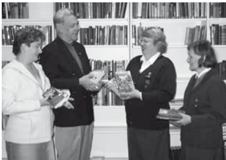
■ Vuonna 2004, omaisten päivän tuotolla täydennettiin sotilaskodin kirjaston valikoimaa.

lemaan Santahaminan maisemia. Ohjelman sisältöä on muokattu hieman vuosien varrella. Tällä hetkellä ohjelman rungon muodostaa perinteiden, perinnepukujen ja -esineistön esittely, musiikkiesitykset, arpajaiset ja kuntotestit. Päivien aikana Santahaminassa vieraillee noin 2 500 – 3 000 ihmistä.