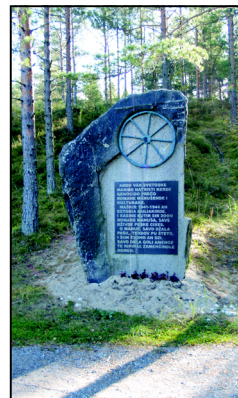
Teloitettujen romanien muistoksi pystytetty muistokivi Kalevi-Liivan hiekkadyneillä