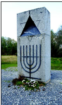
Kloogaan tuhotuille juu- talaisille pystytetty muisto- merkki

Fasisin Eestin päänatsiri- kollinen, turvallisuuspalvelun päällikkö, Mere sai turvapaikan Englannista. Todennäköisesti