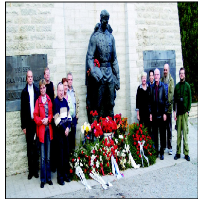
Päätettiin vierailtiin Tallinnan sotilashautausmaalla. Kukat monumentille on tuotu 22.9.-44 Eestin fasisim-

Fasisisen Saksan miehitysaikaiset (1941-1945) ja Baltian-maiden taholta unohtaa vaikenemalla. Kansan Äänen kustantajajärjestöjen jäseniä ystävienä kävimme Tallinnan ympäristössä tutustumassa aikaisten synkkien tapahtumien paikkoihin.