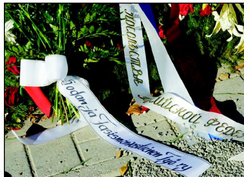
Kukkiä pronssisoturille tuodaan voitonpäivänä 9.5. sekä Eestin fasismistä vapauttamisen vuosipäivänä 22.9. Vierailumme yhteydessä myös SFT jätti pronssisoturille kukkatervehdyksensä