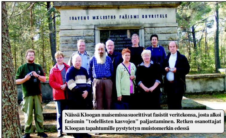
Näissä Kloogan maisemissa suorittivat fasisit veritekonsa, josta alkoi fasismin "todellisten kasvojen" paljastaminen. Retken osanottajat Kloogan tapahtumille pystytetyn muistomerkin edessä