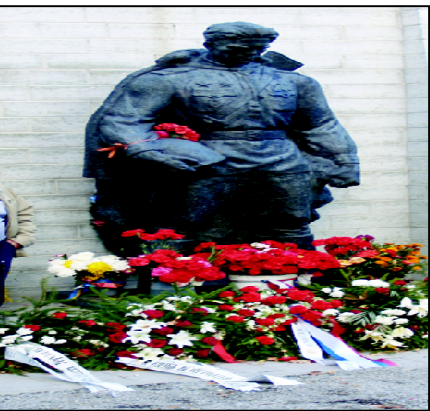
Pronssisoturi-patsaalla. 22.9.-44 Eestin fasismistä vapauttamisen vuosipäivänä.

1941-1945 tapahtumat yritetään virallisen Eestin historiassa vaikenemalla. Syys-lokakuun vaihteessa joukko natsi-SS:n jäseniä ystäviensä kera suuntasivat Tallinnaan. Matkan tarkoituksena oli tutustua fasisin Saksan miehityksen paikkoihin.