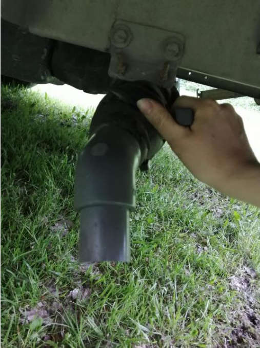
Kuva 5. Jättevesisäiliön tyhjennysvipu

Jätevesisäiliö (90l) sijaitsee auton kaksoispohjassa. Tyhjä jättevesisäiliö vain leirintäalueiden tai pysähdyspaikkojen erityisesti tähän tarkoitetuissa jättepisteissä. Useimmiten päälle ajettava kaivo. Jättevesisäiliön tyhjennysvipu (kuva 5) löytyy auton alta vasemman takarenkaan takaa. Jättevesisäiliön vesimäärän voi tarkistaa ulko-oven yläpuolella sijaitsevan paneelin kytkimestä (kuva 3, kohta 6).