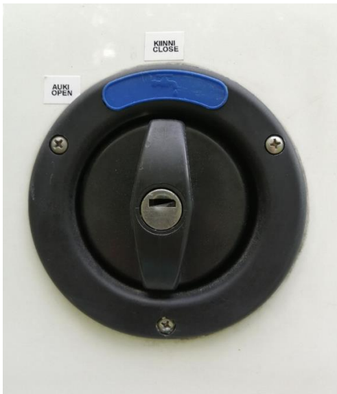
Kuva 4. Auton juomavesisäiliön täyttöaukko.

Juomavesisäiliön täyttöaukko sijaitsee auton vasemmalla sivulla. Juomavesisäiliön täyttöaukon kannen auki ja kiinni kohdat ovat merkittynä (kuva 4).