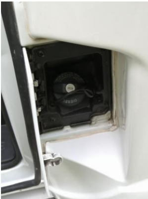
Kuva 1. Polttoaineen tankkausluukku.

Tankkaa autoon vain Diesel -polttoainetta. Polttoaineen luukku löytyy kuljettajan oven vierestä. Korkki aukeaa avaimella. Tankin on oltava täynnä autoa palautettaessa.