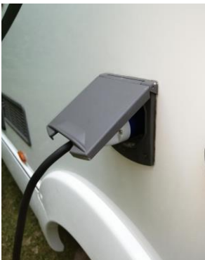
Kuva 2. Auton sähköjohto.

Aina kun vain mahdollista, kytke sähköjohto auton ja sähköpistokkeen väliin. Sähköjohto CEE/ CEE (25m) löytyy auton takatallista (kuva 2). Käytä tarvittaessa adapteria SCHUKO/ CEE. Kahvinkeitin, vedenkeitin ja mikroaaltouuni toimivat ainoastaan 230V sähköllä.