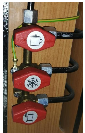
Kuva 6. Kaasuhanat.

Hana on auki, kun nuolet kuvan vieressä ovat vaakatasossa. Jos jotain hanaa ei tarvita, on hana syytä pitää suljettuna. Kaasupullon kierresuljin avataan täysin auki kevyesti ja kierretään kiinni kevyesti, ei saa käyttää mitään työkaluja kiristämiseen.