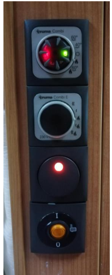
Kuva 7. Lämmitys.