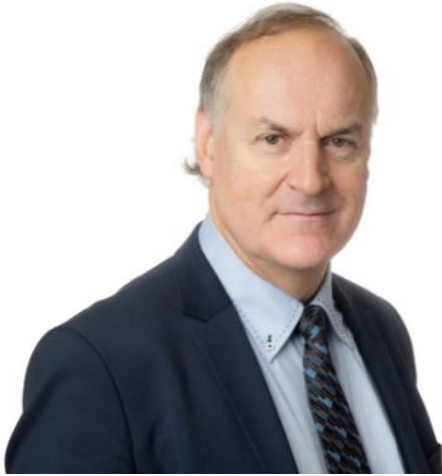
FT; VTM Martin Stenberg www.martinstenberg.fi