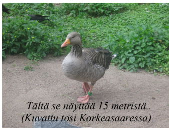
Tältä se näyttää 15 metristä.. (Kuvattu tosi Korkeasaarella)