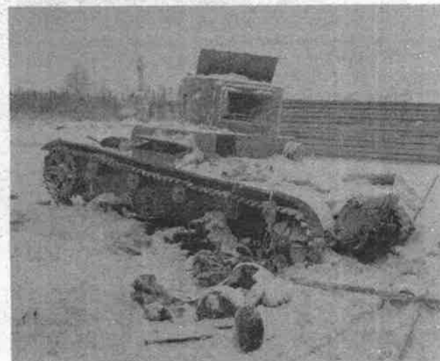
Tuhotto T-26 vaunu Syskyjärvellä.