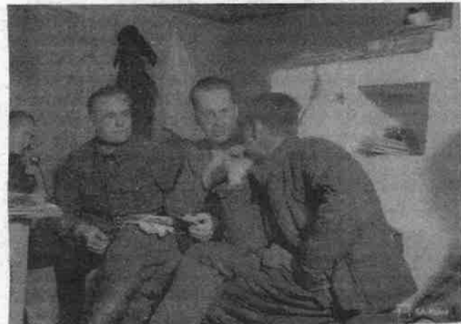
Vangiksi jäänyttä venäläistä kapteenia kuulustellaan Kelivaarassa 28.1.1940.