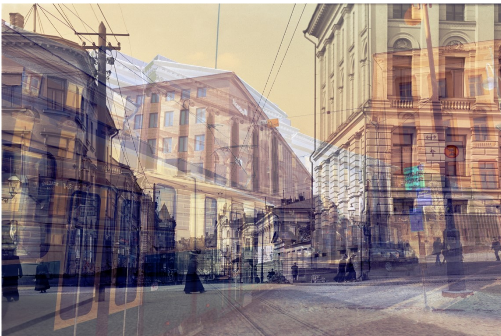
”Aleksanterinkatu”, 2016, 80x53cm