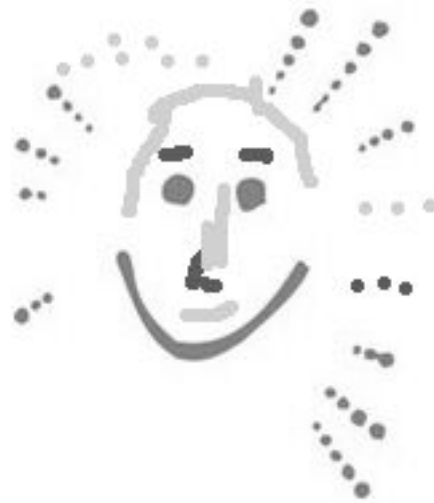
Kuva 1: Minä - Tero