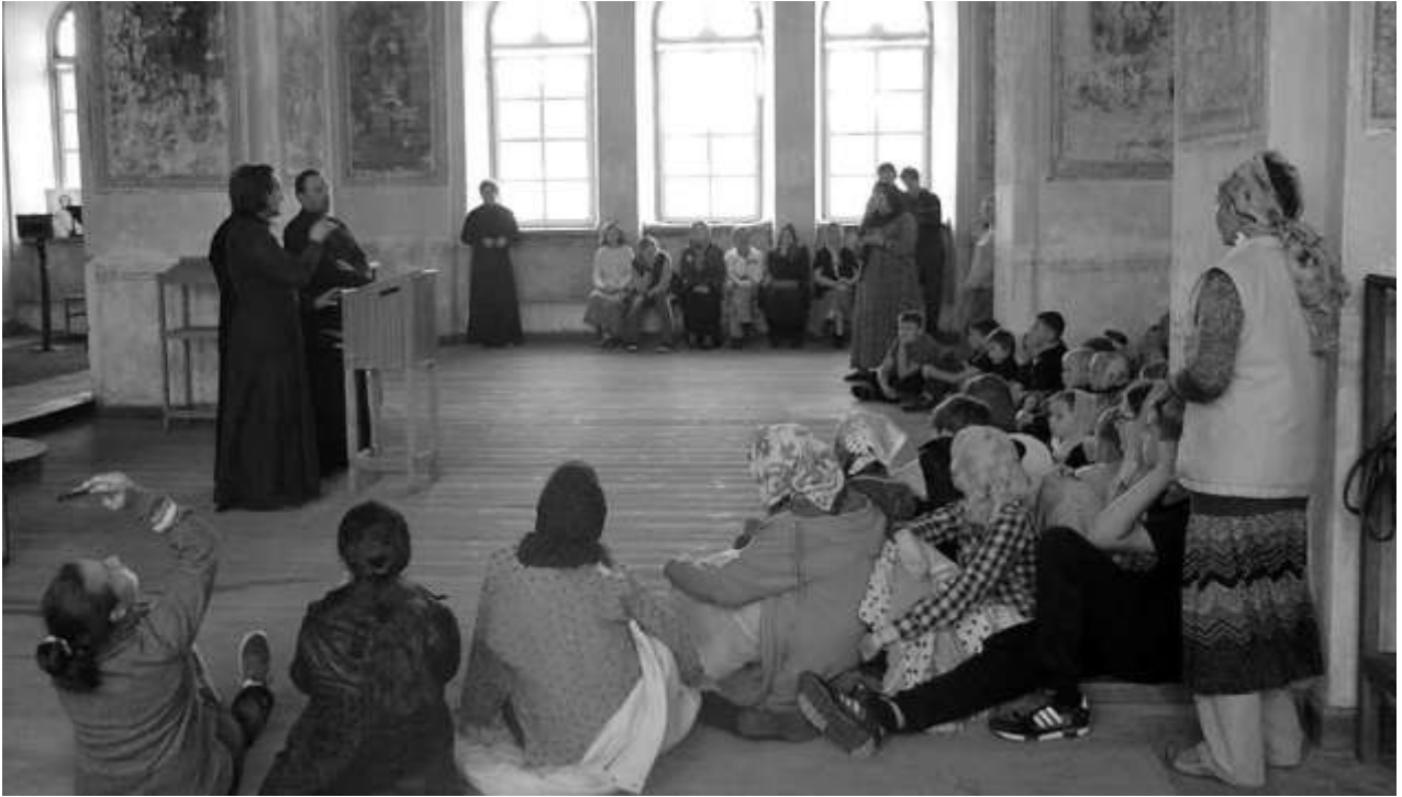
Pietarin musiikkikorkeakoulun opettajat ja saaren lapsileiriläiset ohjaajineen konsertoivat meille Yläkirkossa.