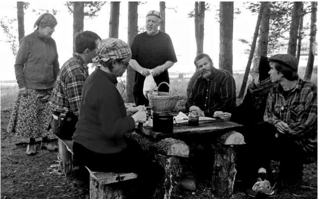
Mustikoita riitti niin saaren lehmillä ja kanoille kuin luostarin tarpeisiin. Kokonaissaalis oli 530 litraa.