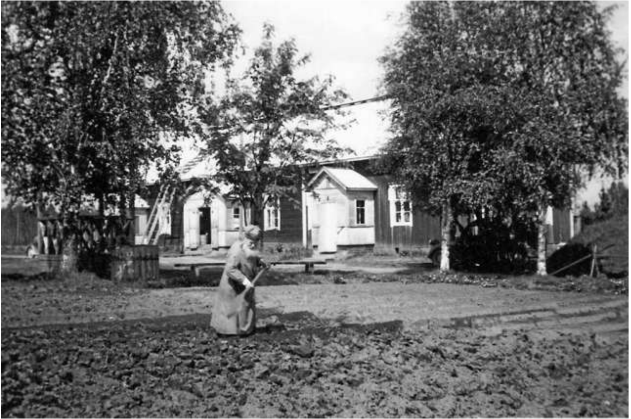
Konevitsan luostari Keiteleellä. Vanha munkki kurkkupenkin laitossa.