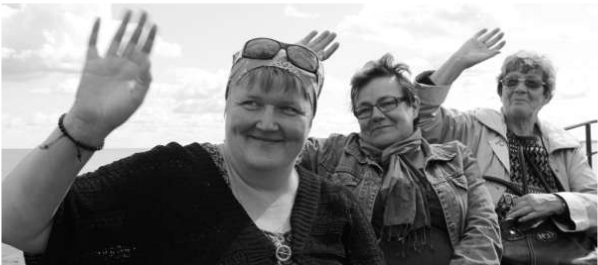
Näkemiin, Konevitsa, rauhan maja, toivottavat hämeenlinnalaiset pyhiinvaeltajat.