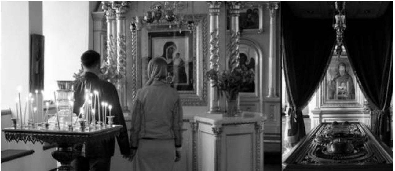
Konevitsan Jumalanäidin ikoni ja Pyhittäjä Arsenin sarkofagi. – Yläkirkon herkkää kauneutta.