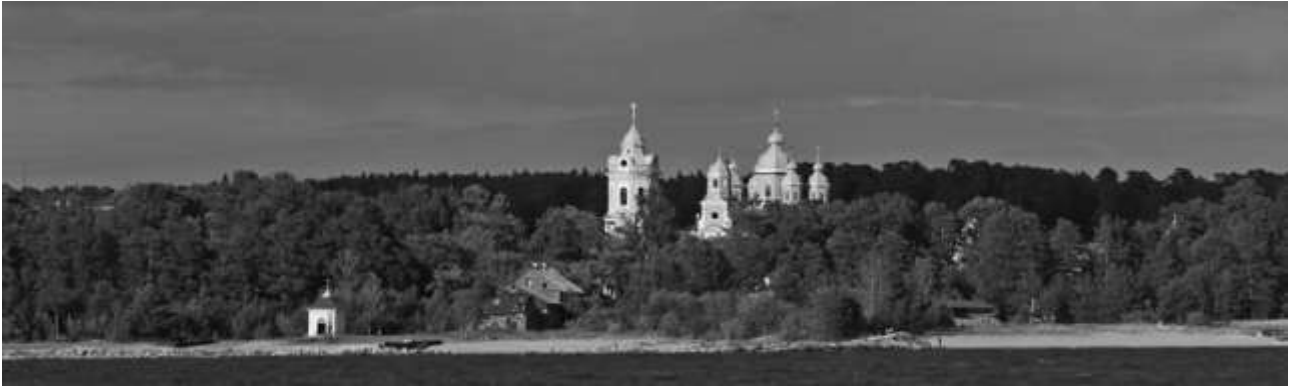
Konevitsan kutsuvat kupolit.