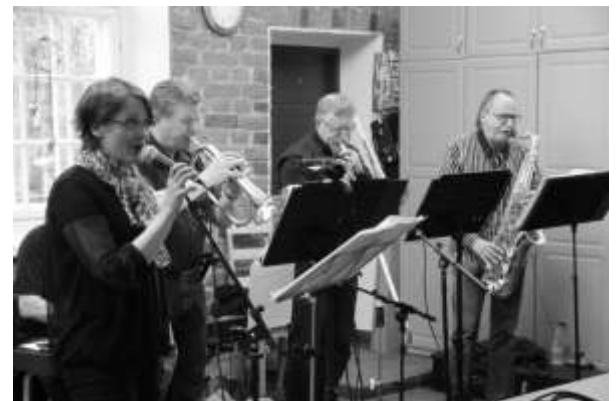
Arsenin jazzit Wanhalla meijerillä.