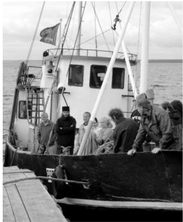
Kalastaja-alus on lastattu pyhiinvaeltajilla.