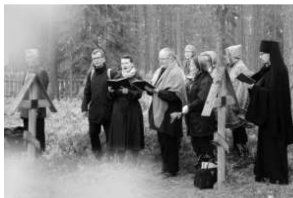
Panihida veljestön hautausmaalla.