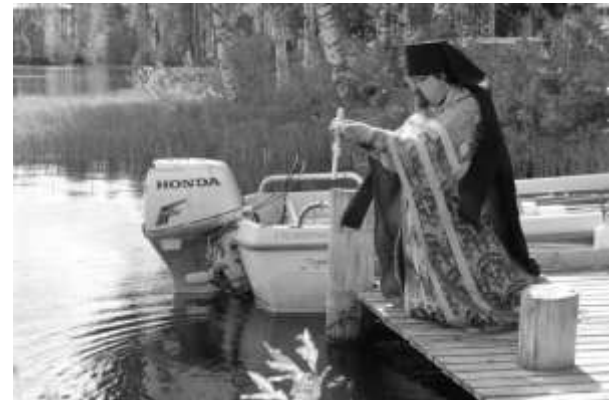
Ristisaatto ja vedenpyhitys.