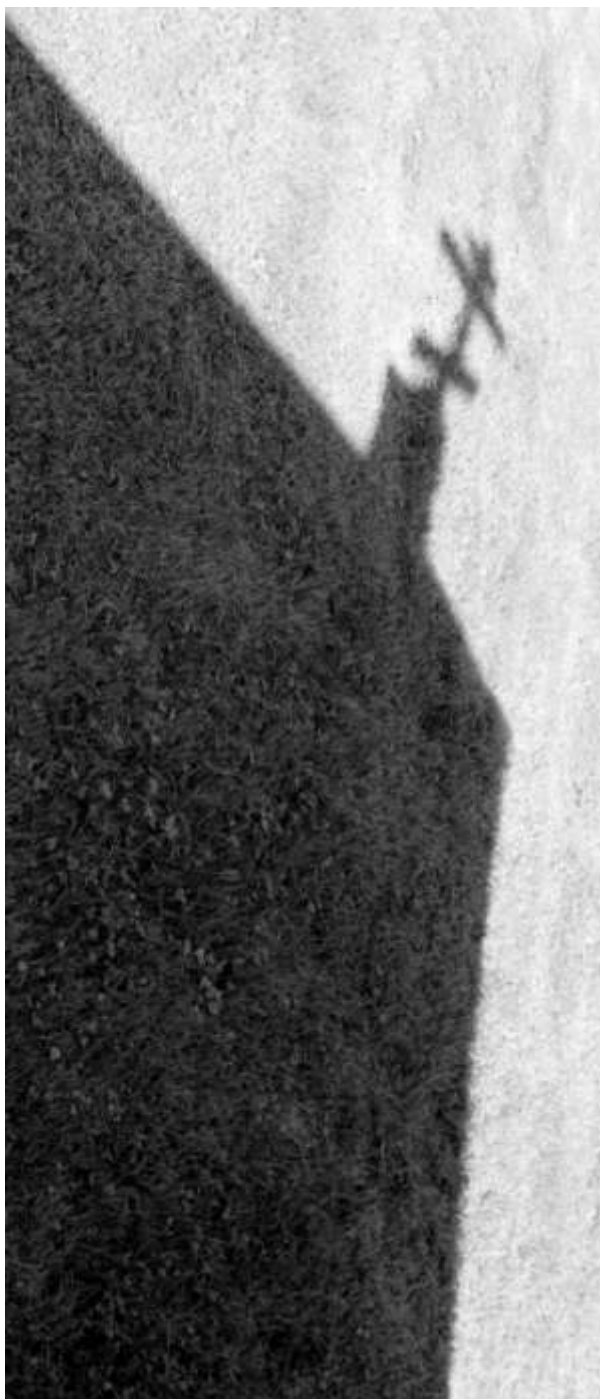
Kellokatoksen varjo Hiekan tilan nurmikolla.