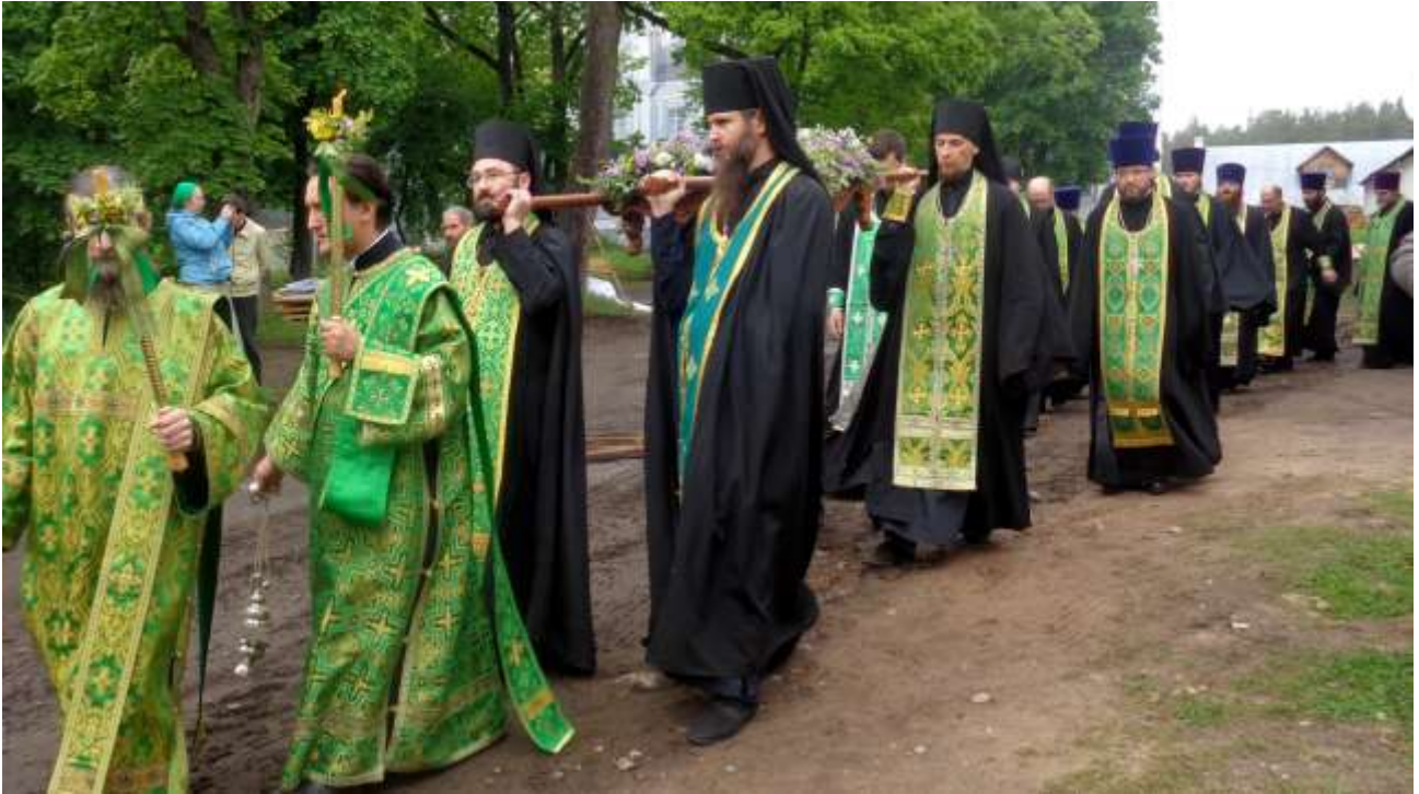
Ristisaatto matkalla Pyhälle vuorelle.