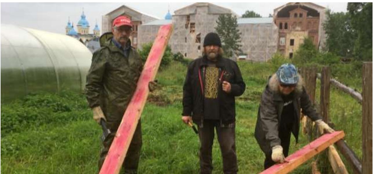
Perunapello kitkettiin ja aidattiin villisioilta. ”Tukimme porsaanreikiä”, totesivat aidantekijät.