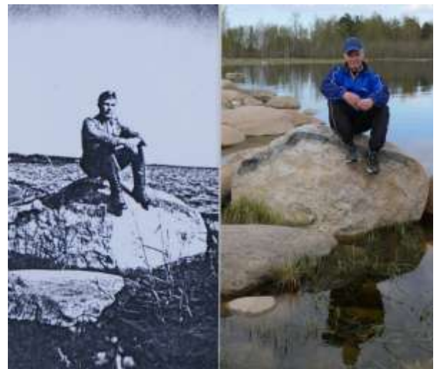
Isä ja poika Eteläpatterin kivellä 1943 ja 2017

Omatoimimatkailua pattereille ei Konevitsassakaan suositeta. Pohjoispatteri on suljettua aluetta ja Eteläpatteria vartioivat ainakin äänekkäät, jossakin määrin arvaamattomat koirat.