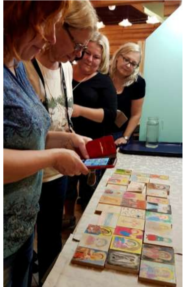
Ikonityöpaja kokosi kokemuksia Konevitsan luostarisaarelta.

Teimme kävelyretken niin kuin se yleensä tehdään, Jumalanäidin kuolonuneen nukkumisen tsasounan kautta Kazanin skiitalle ja Ilmestystsasounalle. Punkkeja ja vilisikoja vältellen Hevoskivelle.