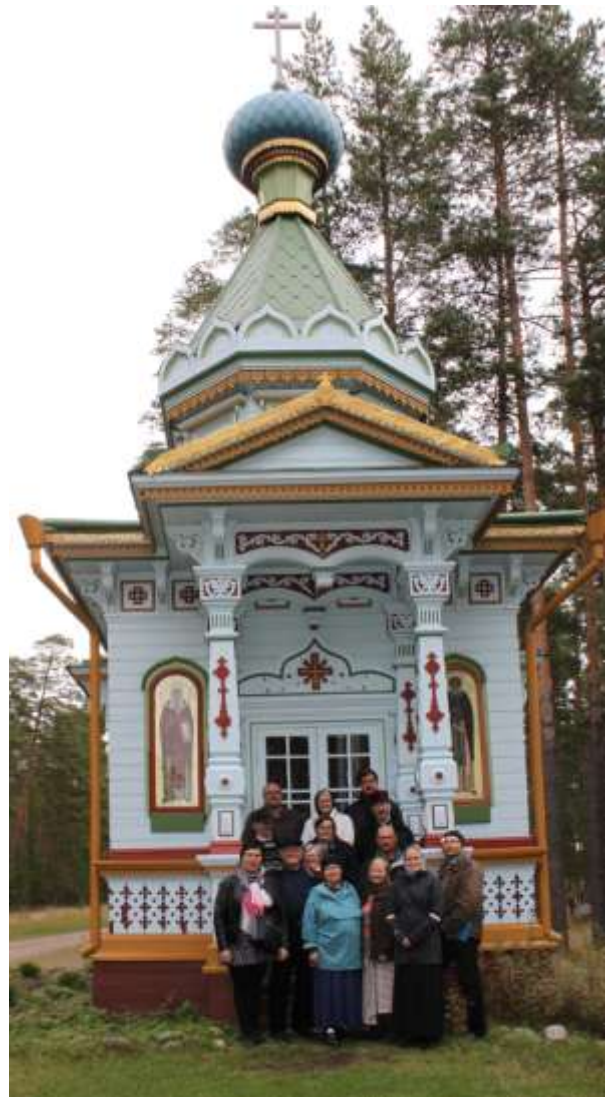
Uспенian tsasouna otti keiteleläiset ja pie-laveteläiset syleilyynsä.