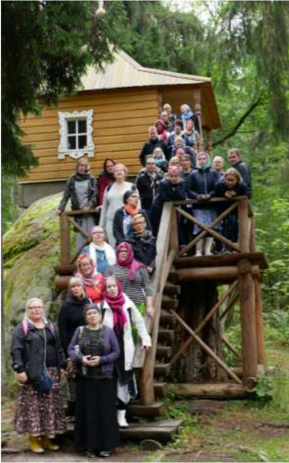
Karjalaisten laulu kajatti Hevoskiven tsasounalla.

antoi hyvän kuvan siitä, mitä on ollut ja mitä on tulossa. Tosin luksushuoneen kuva esittelyjulistessa oli vähän epäsopiva mielikuva askeettisesta luostarivierailusta.