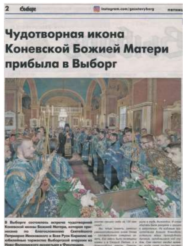
Paikallislehti Gazetta Viborg noteerasi monilla sivuillaan ikonin vierailun täysin siivun..

Konevitsan Jumalanäidin ihmeitekevä ikoni vieraili Venäjällä nyt toista kertaa, Edellinen vierailu tapahtui heinäkuussa 2006, jolloin ikoni oli kahden viikon ajan kunnioitettavana Pietarissa ja Konevitsan luostarissa. - HJ