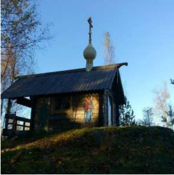
Pyhän perheen ja Konevitsalaisen Jumalanäidin ikonin tsasouna Uukuniemen Akkakalliolla.