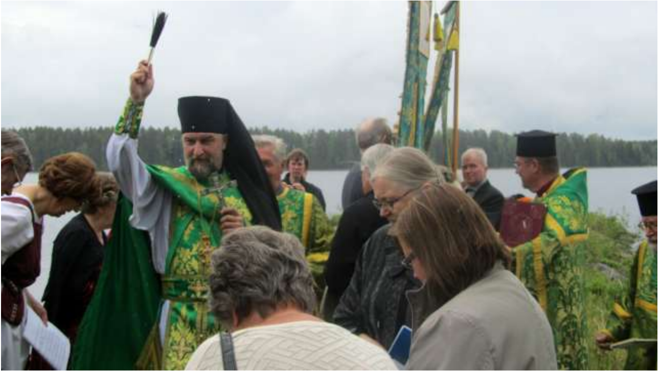
Igumeni Aleksandr vihmoi järven, rannat, luonnon, veneet, autot, kirkon ja kaikki...