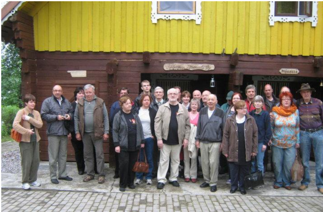
Kuva: Harri Kekki 2010