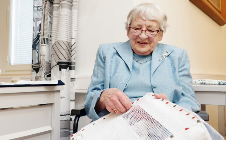
Hyvä näkö ja kärsivällisyys ovat revinnäiskirjonnassa tarpeen.