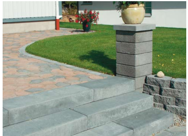
Bender Porraskivestä tehty porras.