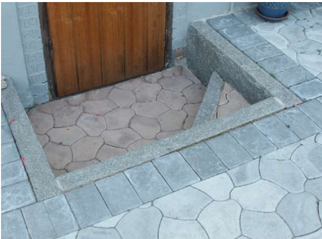
Graniitista ja Bender Pompeiji kivistä tehty porras.