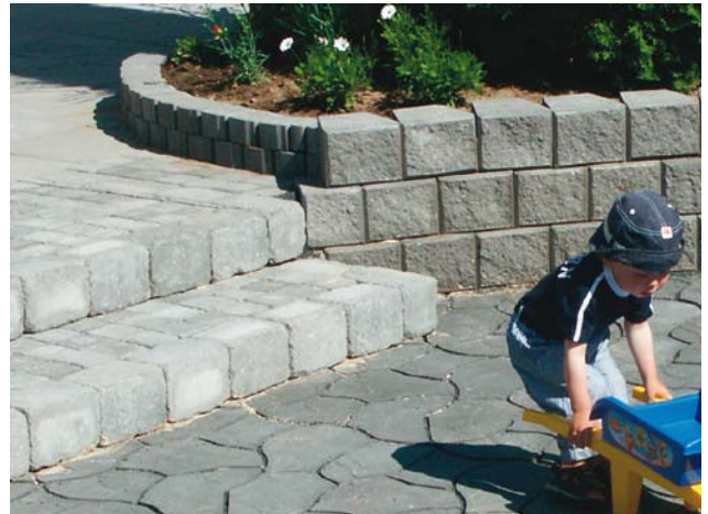
Bender Labyrint antik Reuna- ja Knottkivestä tehty porras. Muurikivi Bender Megawall.