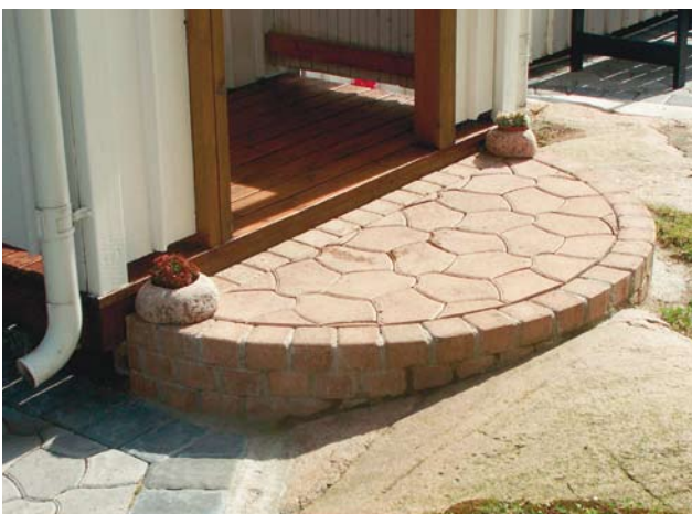
Bender Labyrint Knott kivistä ja Bender Pompeijista tehty porras.