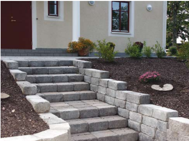
Labyrinth Antik Muurikivistä tehty porras