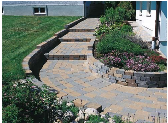
Bender Antik Labyrinth Kokokivistä tehty porras.