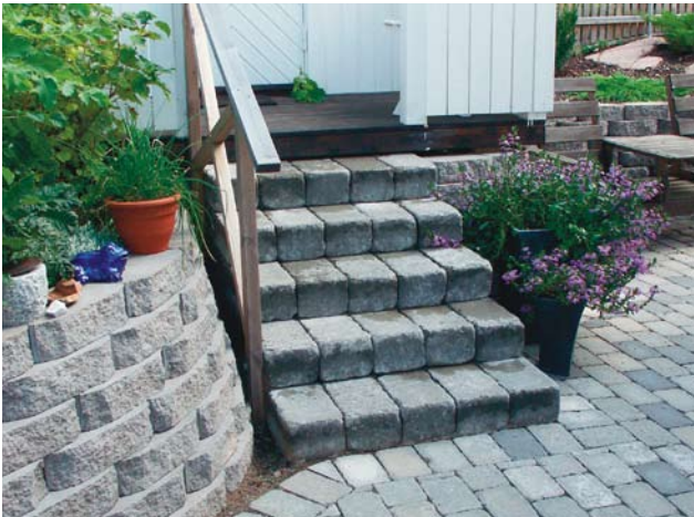
Labyrint Antik Muurikivestä tehty porras. Muurikivi Bender Megastone 150 pyöreäksi lohkottu.