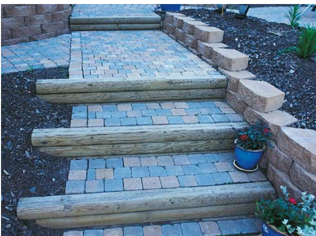
Puusta ja Bender Labyrinth Antik kivistä tehty porras.