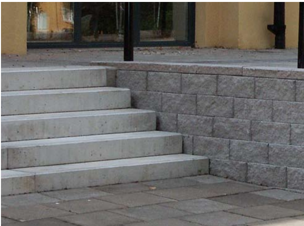
Bender Porraskivistä tehty porras. Muurikivi Bender Megastone 150 suoraksi lohkottu.