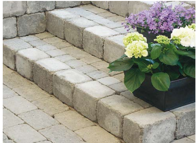
Bender Labyrinth Antik, Nupu- ja reunakivistä tehty porras.