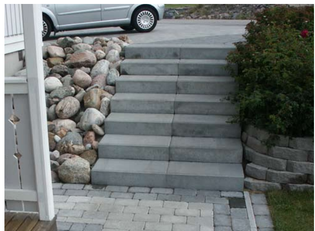
Bender Porraskivistä tehty porras.