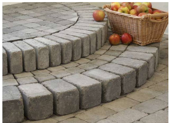
Bender Labyrint antik, Koko-, reuna ja Knott kivistä tehty porras.