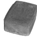
Klassikkokivi, suorakaide 172x115x80 mm Menekki/m 2 : 32 kpl