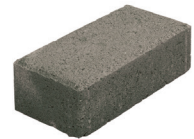
Torikivi koko: 280*140*60 mm