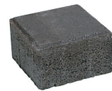
Aukiokivi koko: 140*140*60 mm