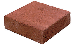
Torilaatta koko: 280*280*60 mm

Menekki/m2: Torilaatta 10 kpl + Aukiokivi 10 kpl