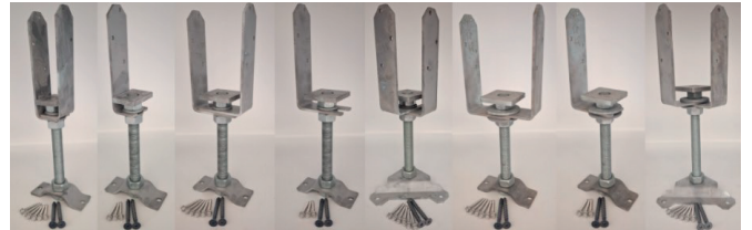
vakio pieli XL XL pieli XL nurkka XXL (5x5) pieli XXL (5x5) nurkka

Asennuskorkeudet 125, 150, 175, 200, 225, 250, 300 ja 350 mm