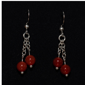
Kaulakoru 40 €, korvakorut 15 €. Helmet ovat karneolia.