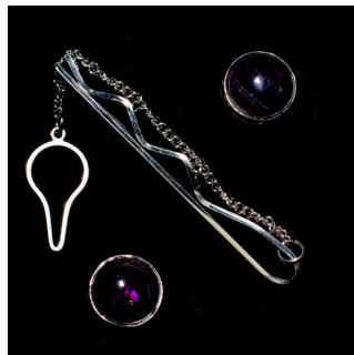
Kaulakoru miehille 38 €. Kivihelmi on Picasso jaspis. Kalvosinnapit ja solmiopidike 35 €. Kivihelmet ovat ametistia.