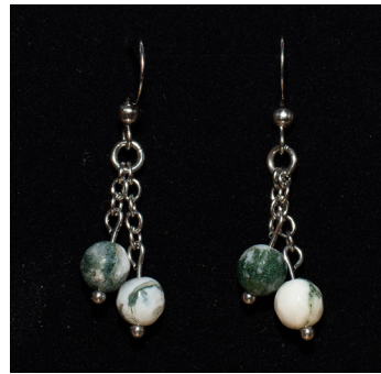
Kaulakoru 40 €, korvakorut 15 €. Helmet ovat puuakaattia.