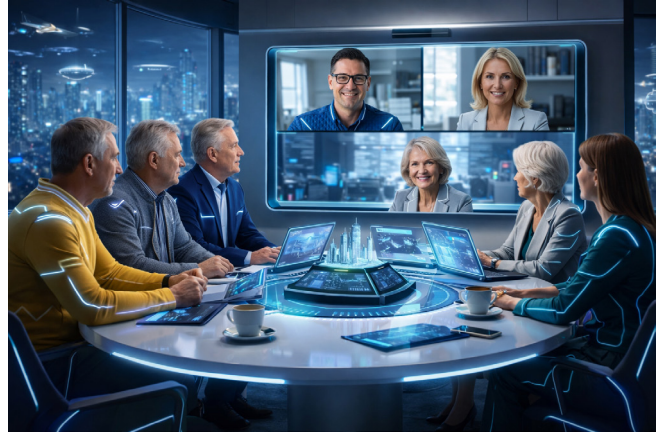
Tekoälyn näkemys sukuseuran hallituksen kokouksesta vuonna 2050.

Vaan on tällä ajatuksella hauskaa leikkiä. Ohessa tekoälyn muokkaama kuva sukuseuran hallituksen kokouksesta vuonna 2050. Kovin olemme nuoren näköisiä, mutta kai tekoäly tietää paremmin.