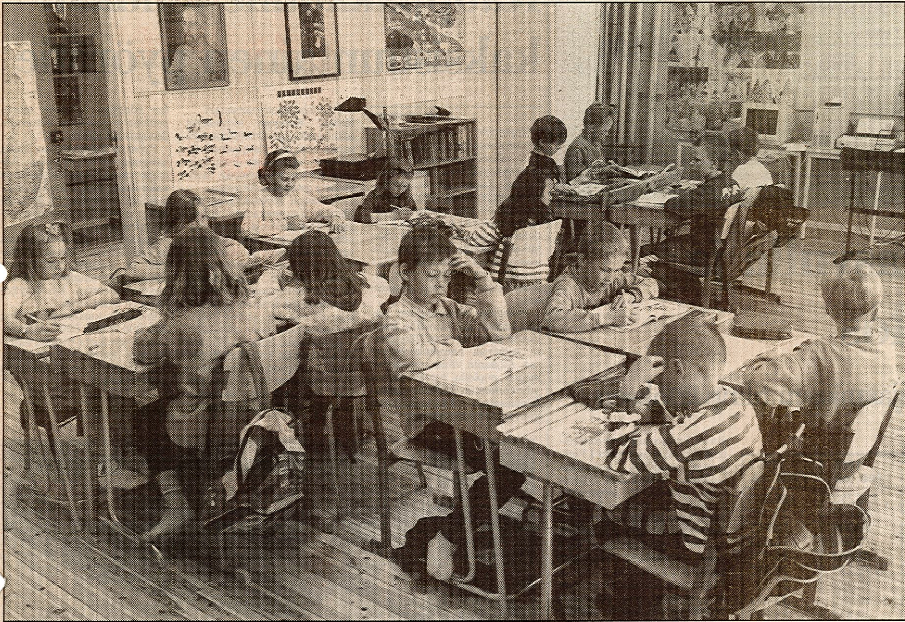
Vuoreslahden ala-asteen kolmosnelonen äidinkielen pauloissa. Kuusi näistä oppilasta siirtyy ehkä ensi syksynä Keskuskoulun pulpetteihin.