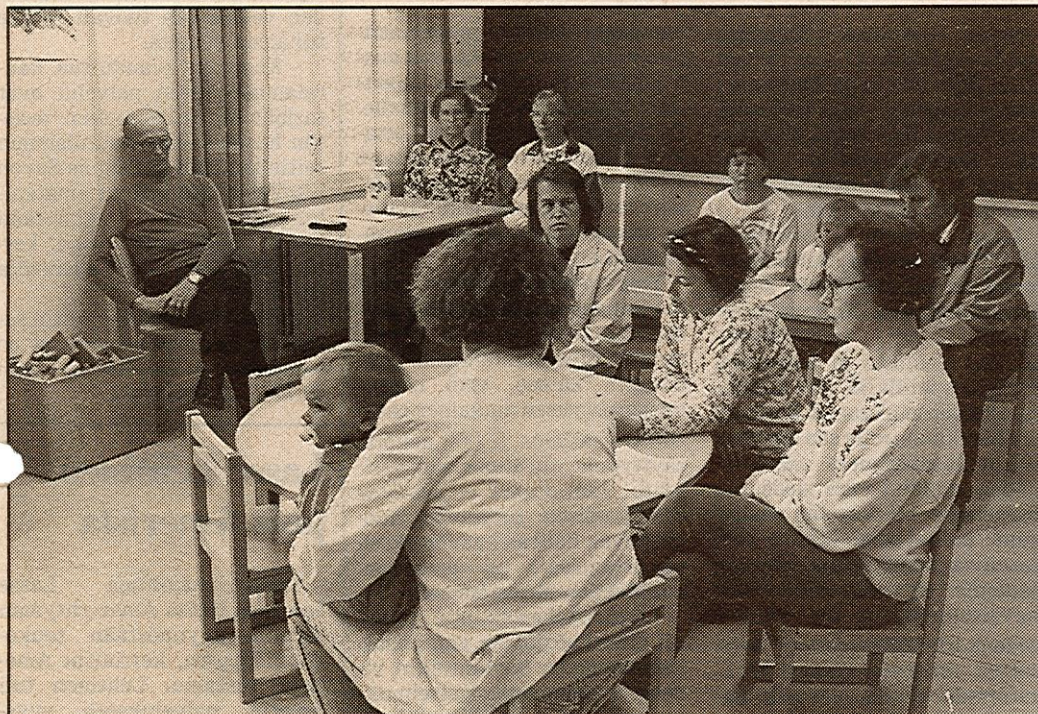
Vanhemmat haluavat, että heidän lapsensa saavat käydä koko ala-asteen Vuoreslahden koulussa. "On olemassa arvokkaita asioita, joita ei rahassa mitata."

Pelko koulun lakkauttamisesta näkyy muun muassa oppilaiden kielivalinnoissa. Vanhemmat valitsevat lastensa ensimmäiseksi vieraaksi kieleksi englannin, jotta englannin kielen opetusta tarjoava Vuoreslahden koulu säilyisi.