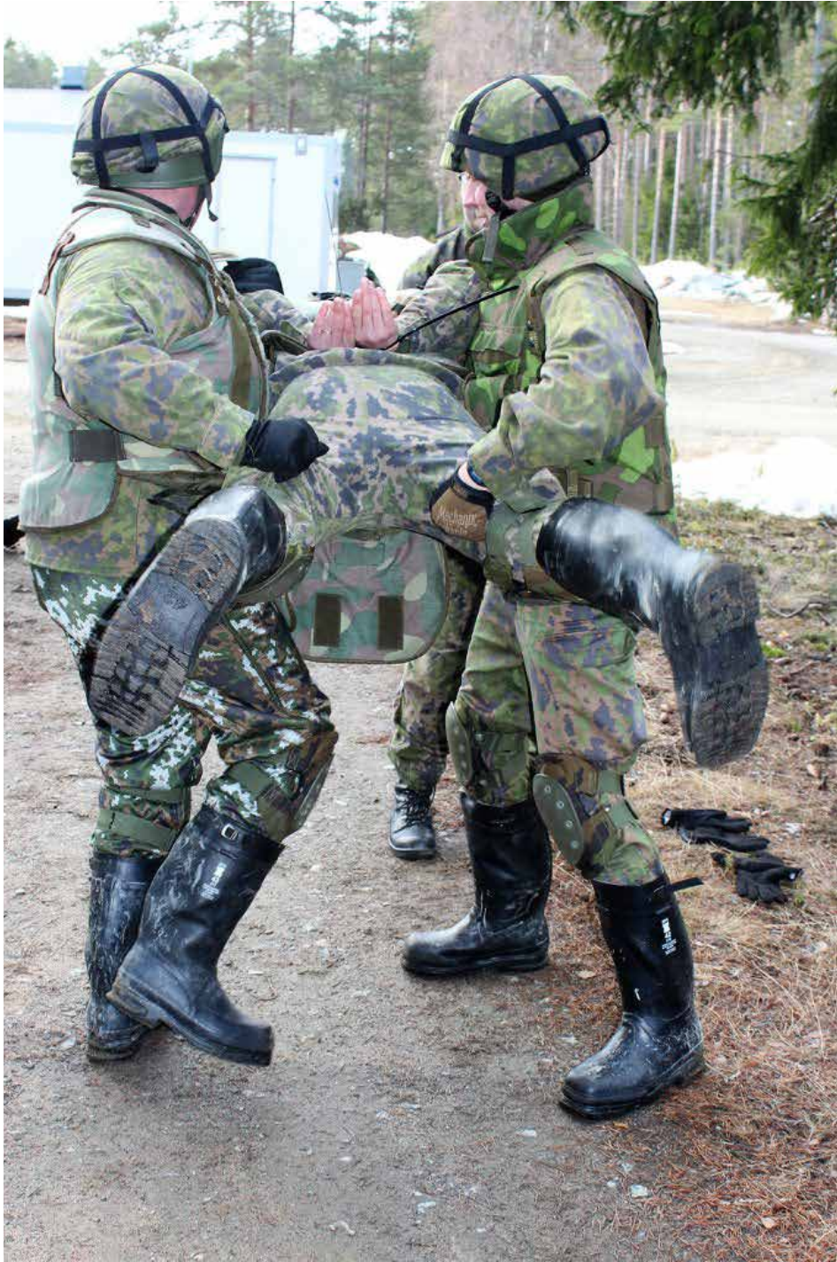
Suojaustehtävissä pitää harjoitella voimaotteitakin.