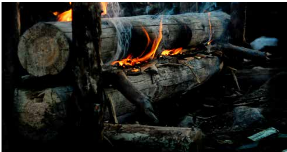
rakovalkean sytyttäminen on pitkäaikainen ja kärsivällisyyttä vaativa prosessi