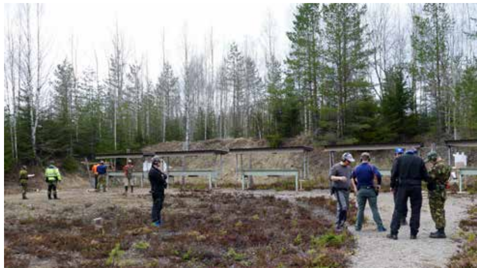
Rasteilla vaihdettiin välillä maalien paikkaa, sama suoritusaktiikka ei välttämättä toiminut toista kertaa.