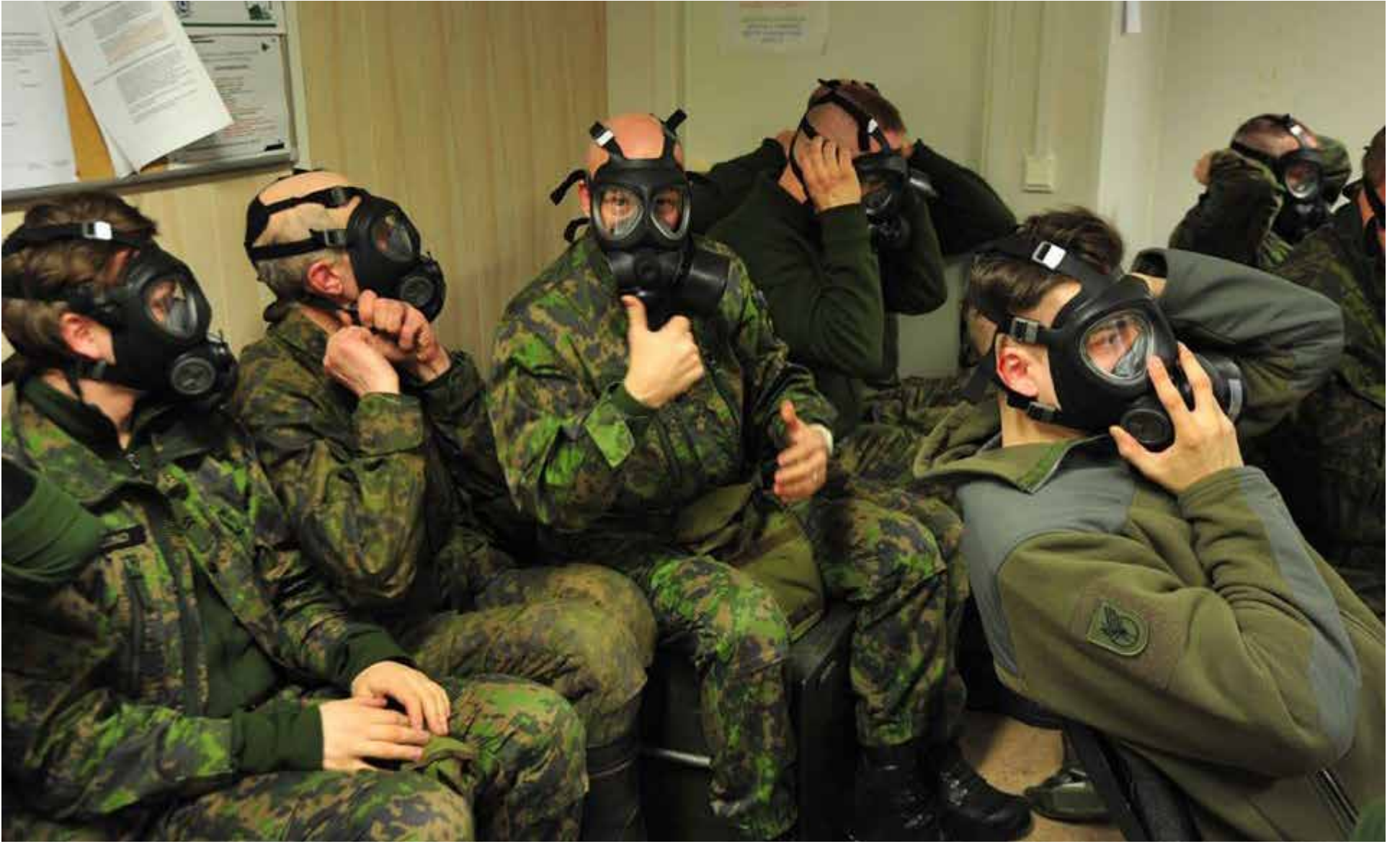
Suojanaamarin oikeaoppinen käyttö säästää monelta murheelta.