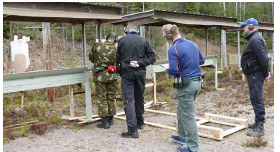
Koska kyse oli tuomarikoulutuksesta, kaikkien toimijoiden suoritus seurattiin tarkkaan ja palaute oli suoraa, mutta rehellistä