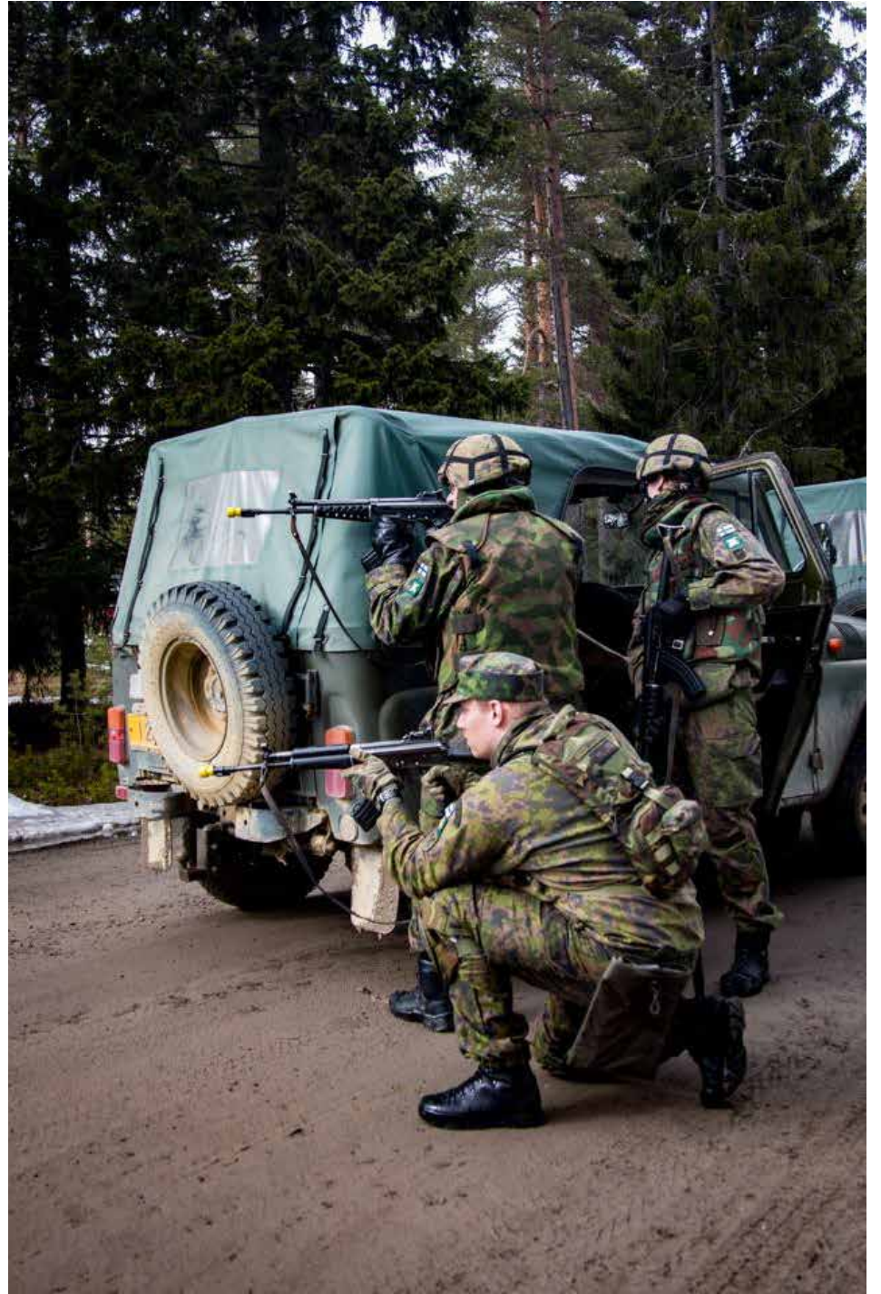
Kuljetuksen suojaus -kurssin käytännön harjoitusta.