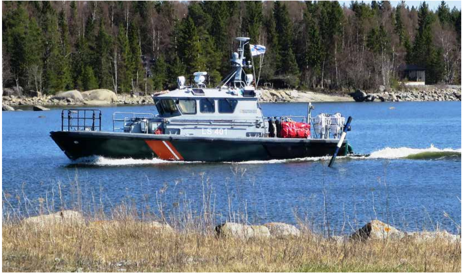
Pelastusharjoitukseen osallistunut vartiovene palaamassa asemapaikalleen. Vieraiden risteily tapahtui myös tällä veneellä.

Vallgrundin merivartiostasema on yksi Länsi-Suomen merivartioston 13 merivartiostasemasta ja on niiden joukossa yksi viidestä keskusasemasta (Kaskinen ja Kokkola ovat kaksi muuta Merenkurkun asemia). Länsi-Suomen merivartiosto puolestaan on osa maamme Rajavartiolaistosta, jonka yhdeksän hallintoyksikköä ovat Rajavartiolaistoksen esikunta, neljä rajavartiosta,