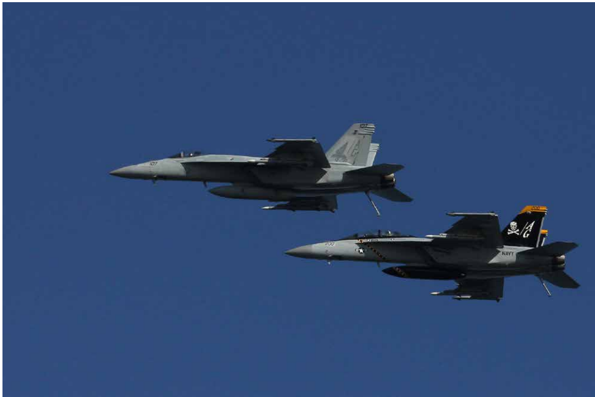
HX-programmet syns också på Finlands flyguppvisningar. Här en Boeing F/A-18E och en F/A-18F Super Hornet under Kaivopuisto flyguppvisning ifjol. Till årets uppvisning i Tikkakoski väntas också flera av kandidaterna.