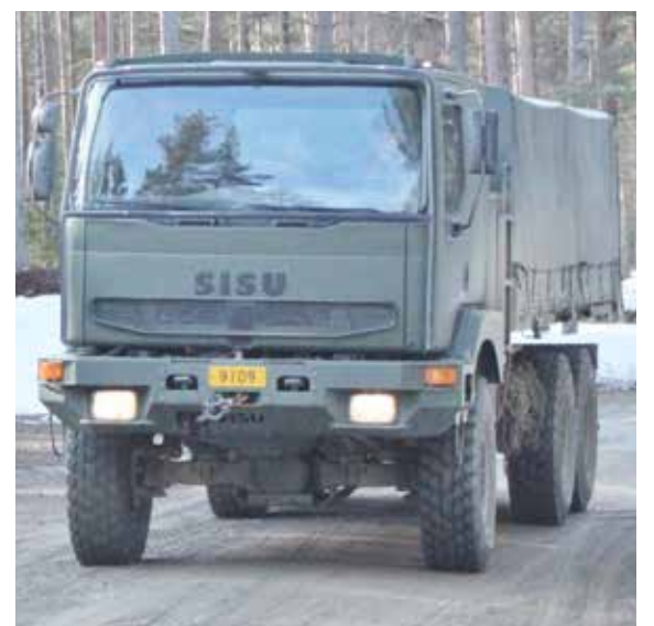
Suomalaisella Sisulla harjoituksetkin sujuvat!