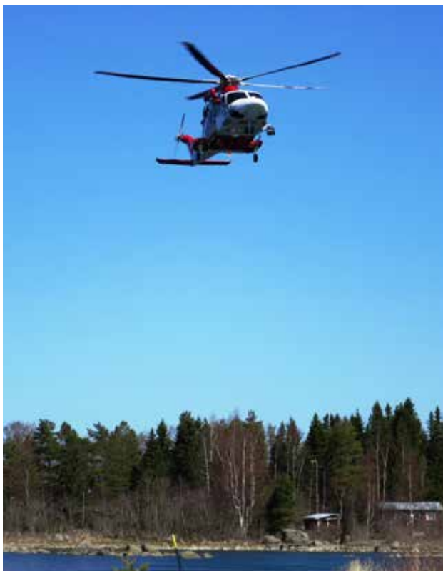
Svenska Sjöfartsverketin pelastushelikopteri Uumajasta osallistui Vallgrundin pelastusharjoitukseen helatorstaina.

Ilkka Virtanen Österbottens Försvargille - Pohjanmaan Maanpuolustuskilta rf:n puheenjohtaja