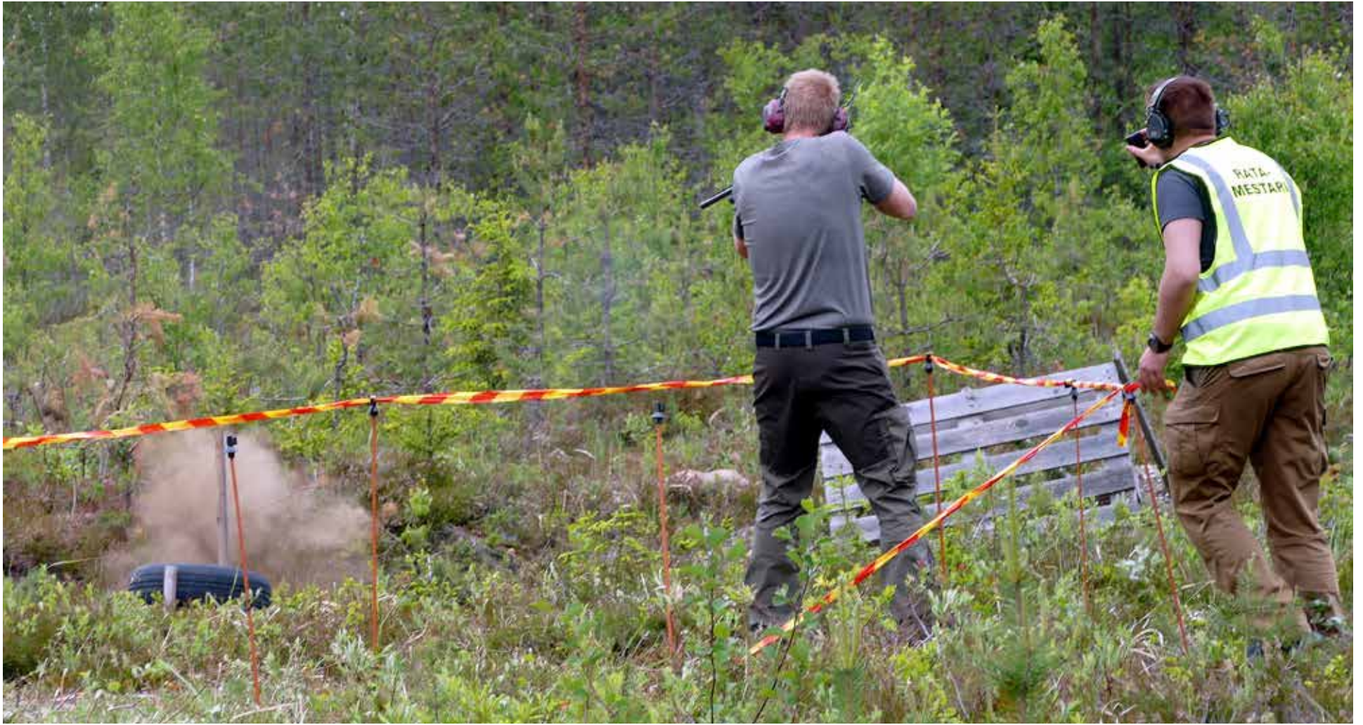
Vaihtelevat ja osin piilossa olevat kohteet antoivat haastetta kilpailijoille.