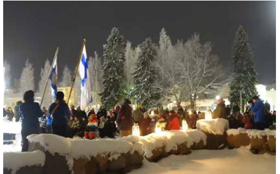
Ylivieskan partiolippukunta Viessojen itsenäisyyspäivän perinteisiin kuuluu illan soihtukulkue kaupungilla ja nuorimpien partiolupauksen antaminen ulkoilmakirkossa, vanhan palaneen kirkon raunioilla.