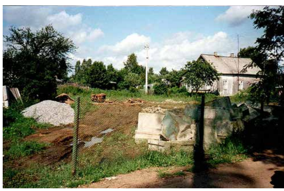
Tyhjä tontti tätini ja isän kotitalon välissä.