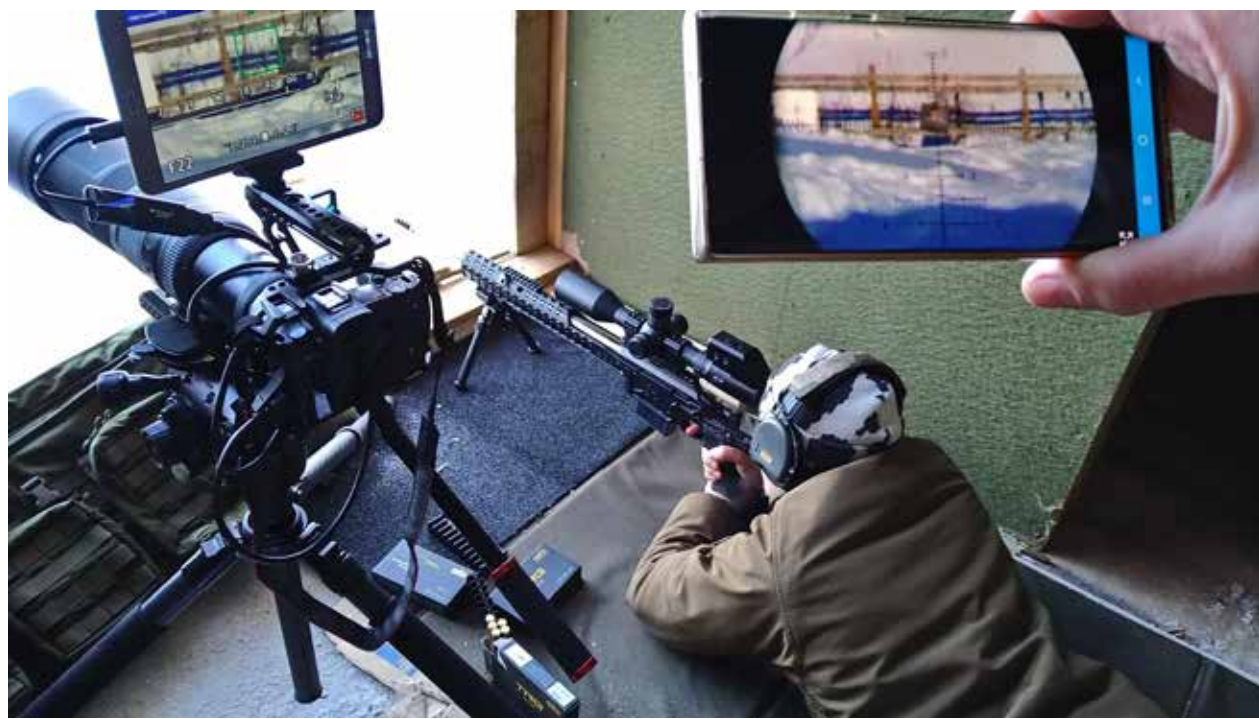
Reserviläinen testaa Tikan kivääriä 300 m radalla.