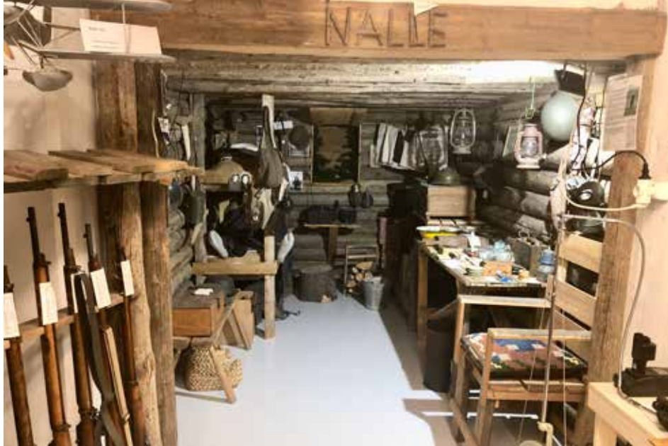
Hirsinen Nalle-korsu aidoin rintamaolosuhteet kokenein esinein. Koululaisryhmien ehdoton suosikki.

Också jägarna har fått ett eget avsnitt. En karta ut-