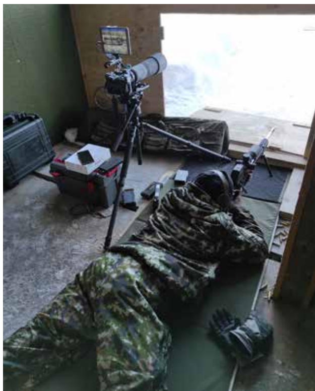
Reserviläinen ja lisälaitteet ammunnan suorittamiseen.

Kalajoen Reserviläiset ry:n puheenjohtaja