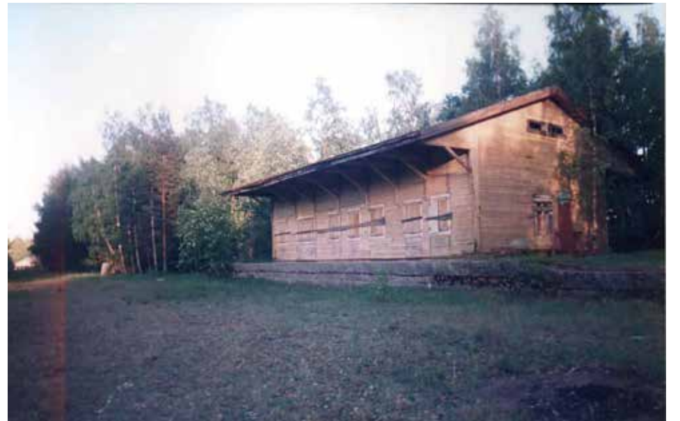
Sodissa säilynyt asemamakasiini kuvan vuonna 1991. Ratapihalta on purettu raiteet pois.

liikenneyhteydet ja some tavoittavat ihmisiä paremmin tavoittamaan auttavia ihmisiä ja esim. sukulaisia muualta Euroopasta. Talvisodan syttyessä piti luottaa enemmän vain viranomais-tietoon. Samoin ukrainalaisilla on nyt samanlaisia tuntemuksia kuin suomalaisillakin evakoilla, eli lapset