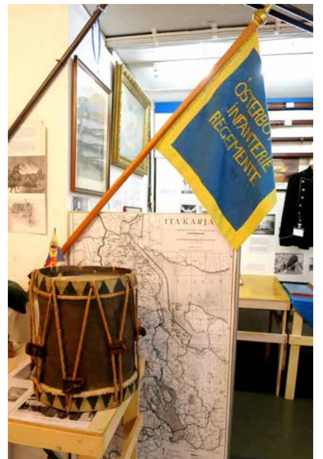
Suomen sodassa 1808-1809 käytössä ollut Pohjanmaan Rykmentin Närpiön komppanien rumpu ja komppanien lipun näköiskopio.