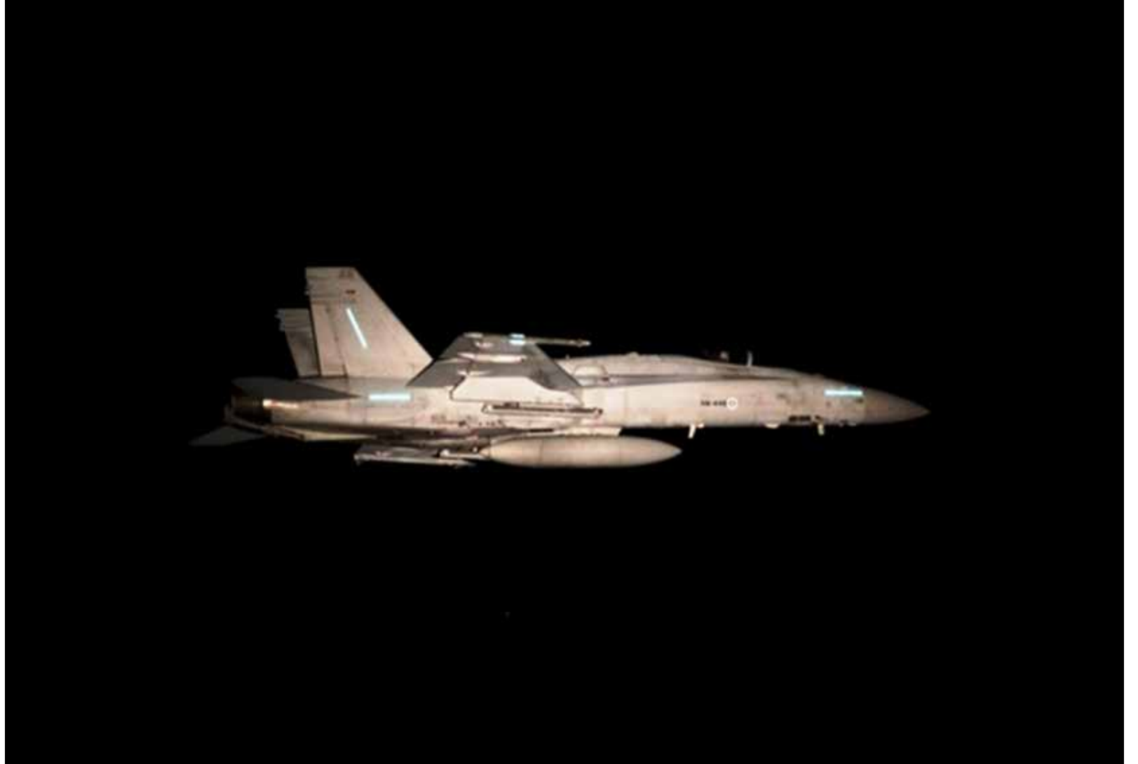
Pimeätunnistamisen harjoittelu kaikissa sää- ja valaistusolosuhteissa kuuluu Hornet-valmiusohjaajien koulutukseen. Kuvassa tunnistettavaa ilma-alusta esittävä ilmavoimien Hornet valokuvattuna harjoituslennolla syystalvella 2016.

– Päivystävänä ohjaajana toimiva Hornet-lentäjä kantaa merkittävää vastuuta. Hän toteuttaa aluevalvontaviranomaisena ilmavoimille annettua tehtävää näyttäessään, että Suomi kykenee valvomaan ja tur-