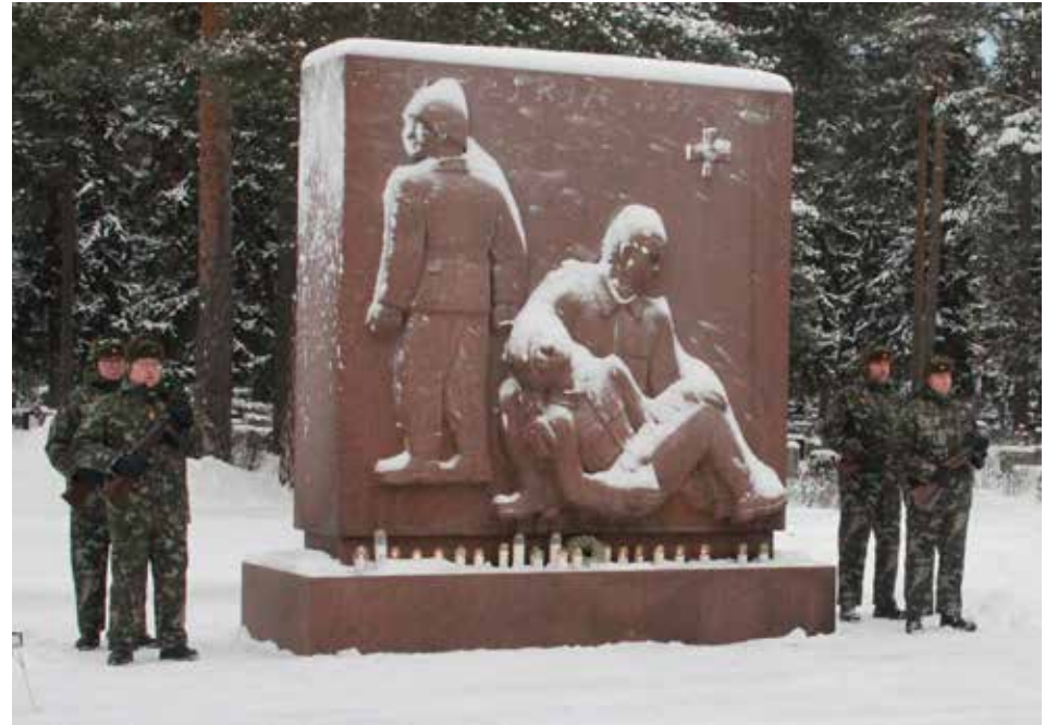
Kunniavartiossa Marian hautausmaan sankarimuistomerkillä oli kerrallaan neljä reserviläistä, tässä maastoasussa. Seuraavalla osastolla olikin sitten yhdenmukainen lumipukuvarustus.