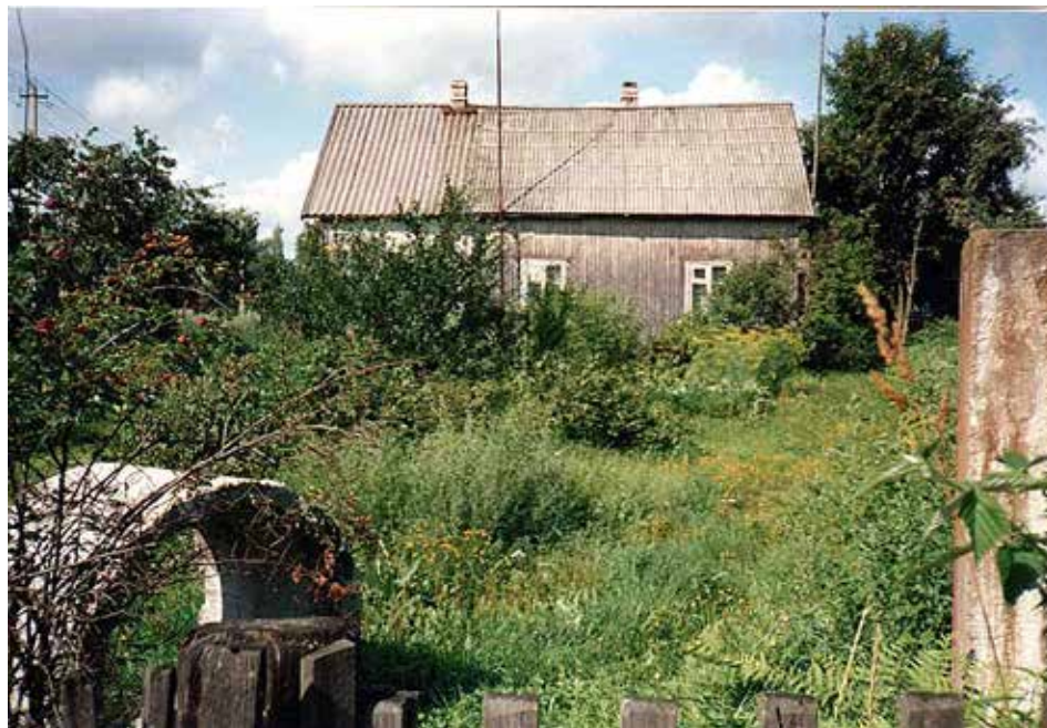
Sipposten talo eli tätini talo v. 1991, kun kävin ensimmäisen kerran Valkjärvellä. Taloa ei ehditty polttaa marraskuussa 1939 eikä elokuussa 1941, ja se jäi sinne ehjänä 1944. Taloa ei oltu maalattu 47 vuoden aikana, ja se on vielä nytkin jäljellä.