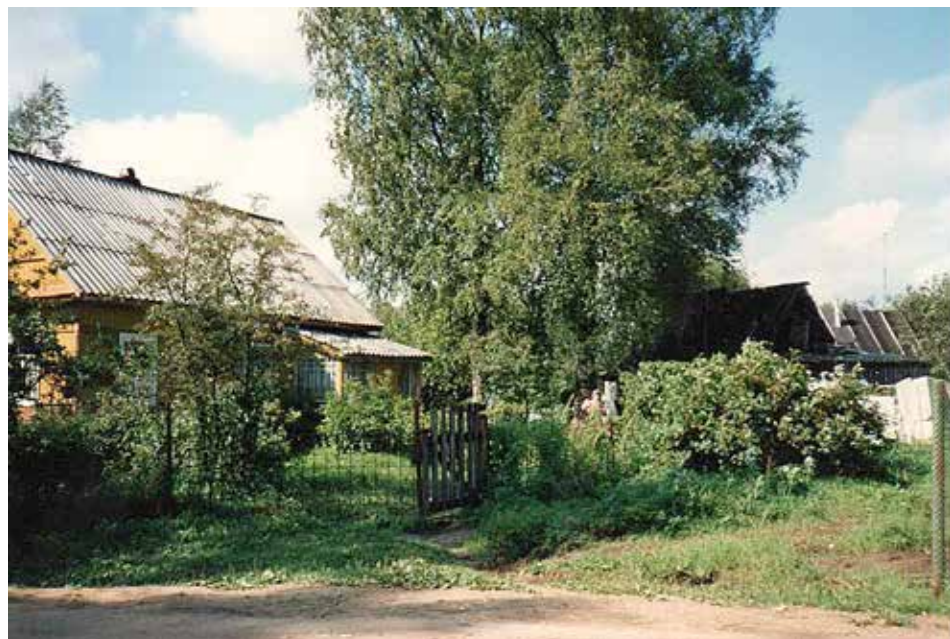
Isäni kotitalon pihakoivu on jäljellä talon kivijalan vieressä. Paikalla on vieressä venäläisten rakentama talo.

Ypäjällä majoitustilanne oli aluksi huono, kun satoja ihmisiä majoitettiin aluksi koulujen ym. lattioille, peseytymismahdollisuudet olivat vähäiset, vaatteet samat kuin lähtiessä, mutta ruokahuolto toimi kuitenkin olosuhteet huomioon ottaen kohtalaisesti. Hämmäläinen vähäpuheinen kulttuuri ja karjalainen puheliaisuus aiheutti välillä kuitenkin ongelmia. Kaikki paikalliset eivät ymmärtäneet evakkojen tai viranomaisien tilannetta. Suhtautuminen alkoi muuttua, kun ypäjälaisten omat rintamalla olevat pojat pääsivät lomilla kertomaan,