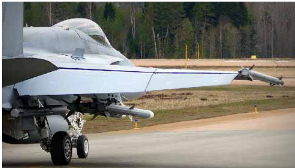
Hornet F/A-18 pm" ja kuvatekstiksi: Kuva: Jouko Liikanen, Kauhava 2019