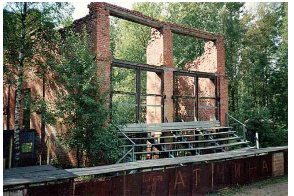
Veturitallin rauniot, joihin oli tehty maauimala. Kuva vuodesta 1991. Rauniot on nykyään purettu pois.

Evakkojen lapsena on vaikea ymmärtää, että yli 80 vuoden jälkeen pitää Ukrainan siviiliväestön kokea samoja asioita. Heitä kuljetetaan pimennetyissä junissa kuten ennenkin ilman aivan varmaa tietoa määränpästä. Onneksi tieto-