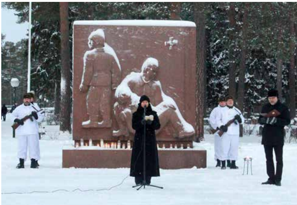
Hartaushetki Marian hautausmaan sankarimuistomerkillä 24.12.2021.