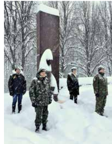
Kunniavartiovuorossa edustajat Pohjanlahden Laivastokillasta (reserviläisäsuiset) ja Pohjanmaan Maanpuolustuskillasta (siviiliasuiset).

merkeille kuitenkin toteutettiin. Vaasassa seppeleenlaskun kohteena on perinteisesti Kasarmintorin Perinnemuri. Seppeleenlaskusta kerrotaan toisaalla tässä lehdessä.