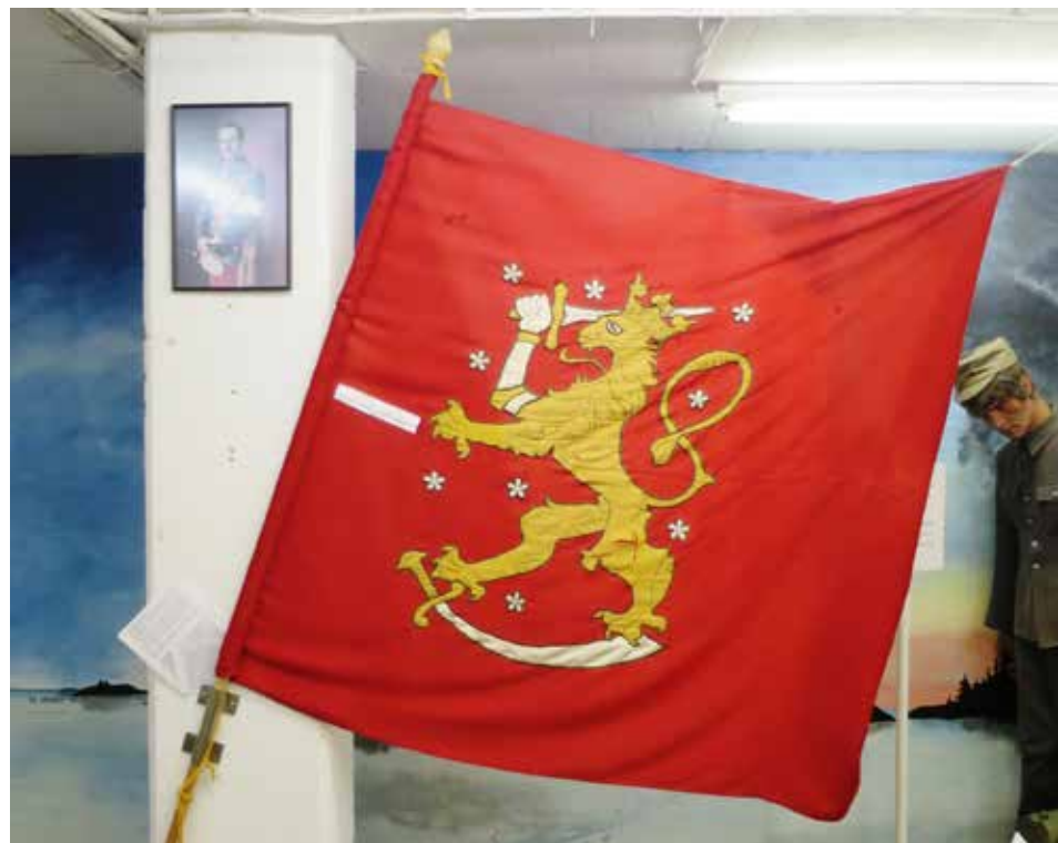
Svinhufvudin Itsenäisyssenaatin asettama lippukomitea esitti Suomen lipuksi Leijonavaakunaan perustuvaa lippua. Museon lippu on valmistettu yksityisenä käsityönä keväällä 1918 kaatuneen vapaussoturien hautajaisia varten.

Ilkka Virtanen, Österbottens Försvarsgille-Pohjanmaan Maanpuolustusilta r.f.