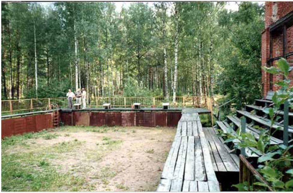
Veturitallin rauniot, joihin oli tehty maauimala. Kuva vuodesta 1991. Rauniot on nykyään purettu pois.

mistä evakot ovat ja mitä he ovat kokeneet. Sen jälkeen jopa polttopuiden saanti kylmiin asumuksiin alkoi onnistua paremmin. Luovutetun Karjalan 180 000 lehmästä saatiin siirrettyä 120 000 kpl, mutta 1940 lopussa niistä oli jäljellä enää 30 000. Lehmät tulivat eri junissa, jopa avovaunuissa, nälkäisinä ja huonossa kunnossa. Lehmä oli monelle arvokkain omaisuus ja niistä yritettiin pitää hyvää huolta. Ihmisiltä jäi koteihin myös tärkeät ompelukoneet ja polkupyörät.