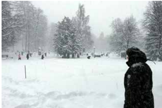
Kaikki 381 sankarihautaa ovat peittyneet joulukuun tuoreen puolimetrisen lumihangon alle.

paikoitellen mahdotonta. Joulukuun aamun perinteisiin kuuluvaa sotaveteraanien kynttilöiden sytytystapahtumaa ei voitu toteuttaa. Iltopäivän kunnioitustapahtumat Vanhan hautausmaan sankarihautojen muistomerkillä sen sijaan toteutettiin. Osa vartioista tosin jäi kulkuvaikeuksien takia ilmeisesti vajaiksi. Vartiotehtävää suorittaneet eivät tällä kertaa päässeet seuraamaan kynttilöiden sytytystä haudoille, kävijöitä oli olosuhteista johtuen vain muutamia ja näilläkin oli mahdoton tehtävä löytää omaisensa hautapaikka vastasataneessa puolimetrisessä lumihangassa. Paikalle tulleet toivatkin usein kynttilänsä muistomerkin