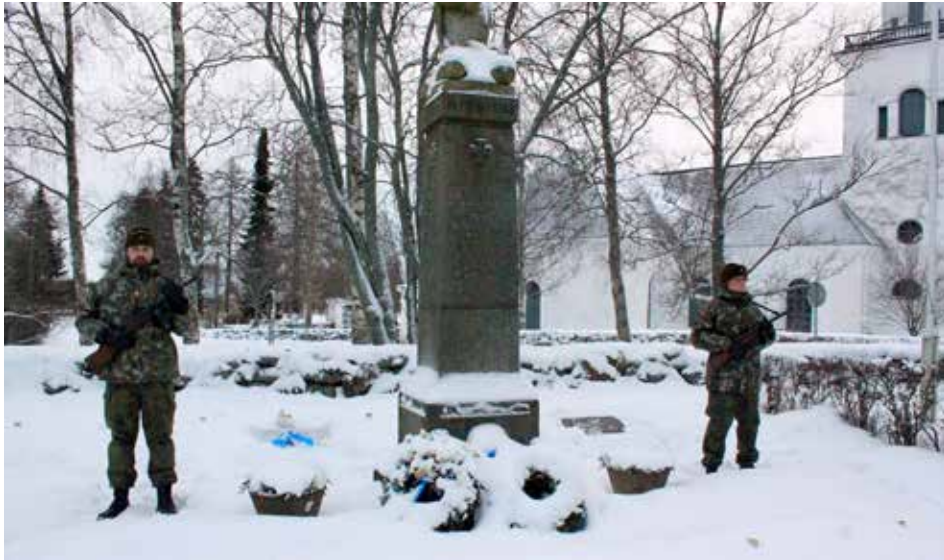
Kunniavartio Kaarlelan kirkon sankarimuistomerkillä 24.12.2021.