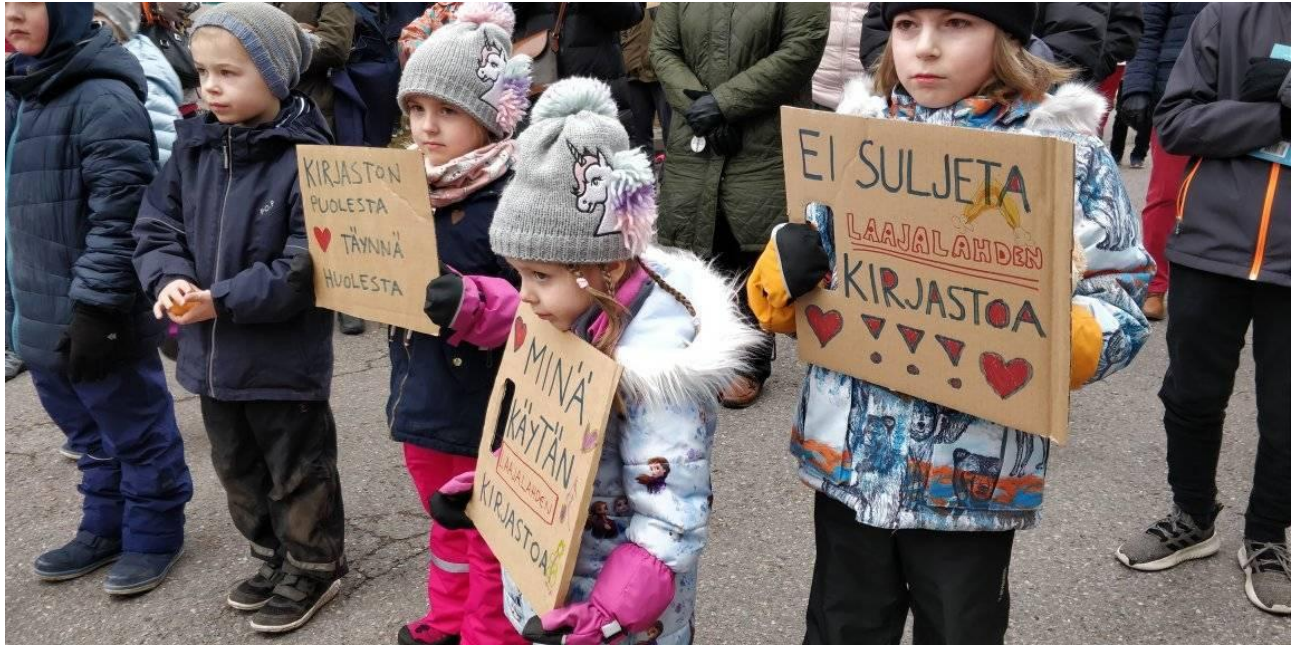
Mielenosoitus kirjaston puolesta 13.11.2021

Vuosi 2021 oli Laajalahti ry:n 71. toimintavuosi. Vuoden 2021 lopussa jäseniä oli 280.