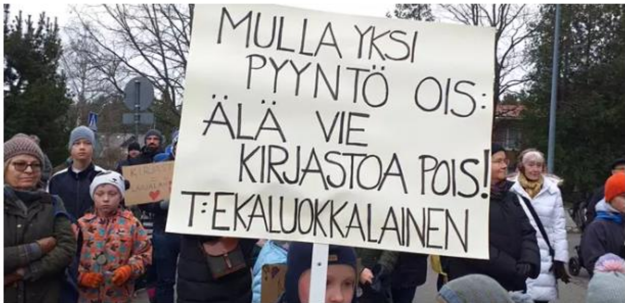
Mielenosoittajat pyysivät, että Laajalahden kirjasto säilytetään.

Mielenosoitukseen saapui yli 200 ihmistä.