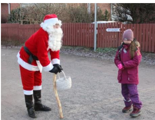
Laajalahti ry järjesti yhdessä Marttojen ja Vanhempainyhdistyksen kanssa myyjäiset 27.11.2021 kirjaston alakerrassa.