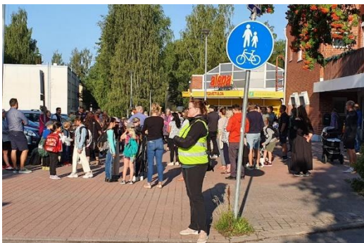
Lasten koulutietä turvattiin 11.-13.8.2021