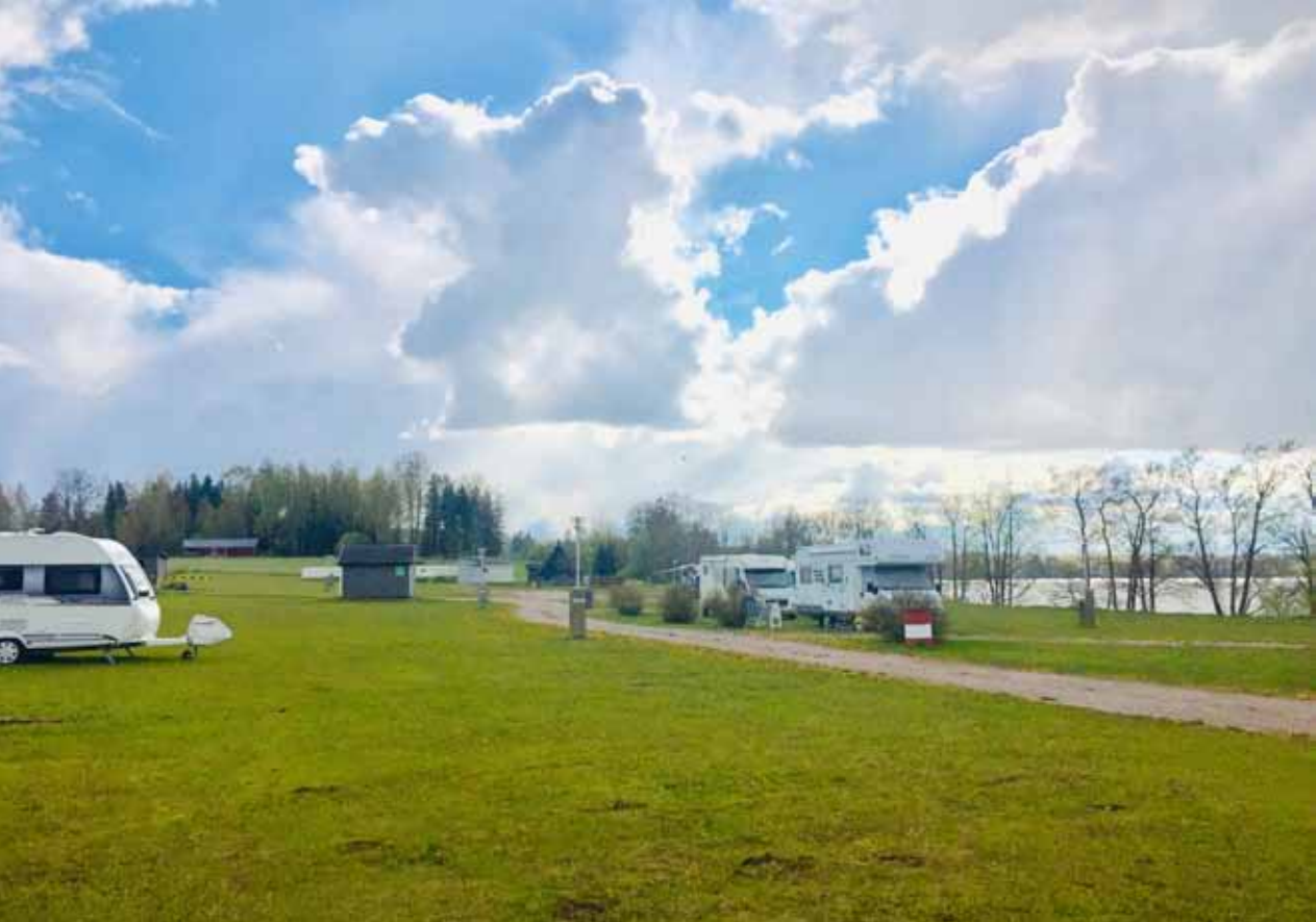
Yläkuva: Ensimmäiset saapuivat ajoissa nauttimaan hyvästä säästä. Alakuva: Henkka ajoi nurmikon kesäkuuntoon.