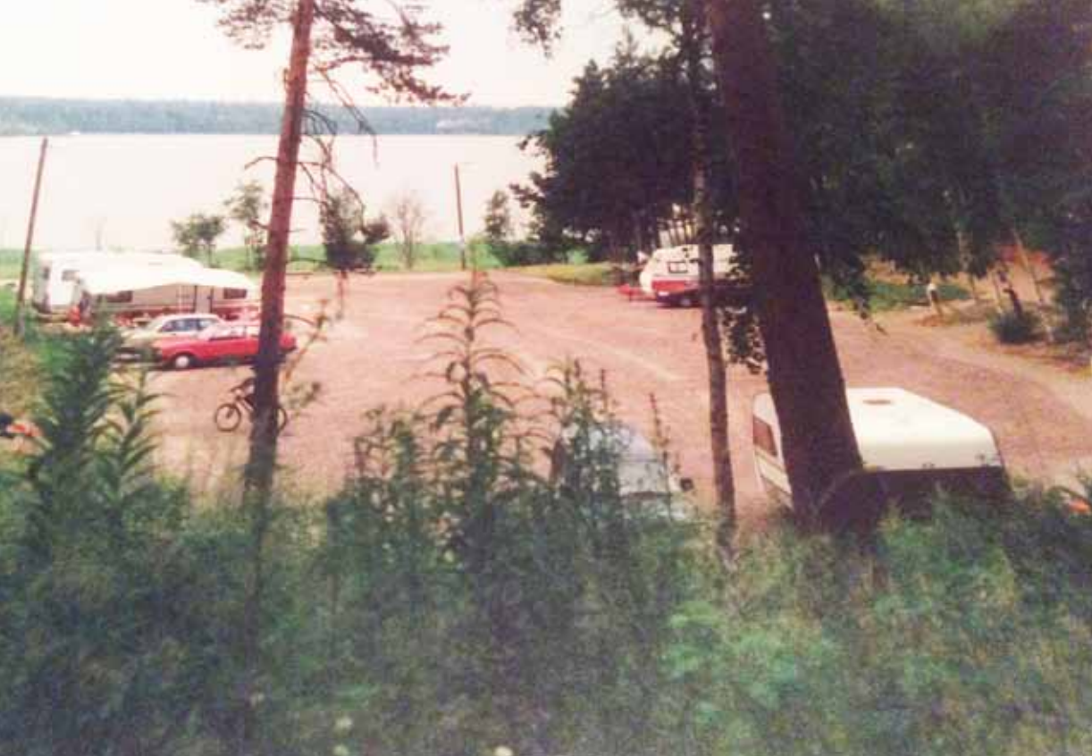
Pelitreffien aika niin sanotulla ”vanhal- la” alueella sillan toisella puolen.