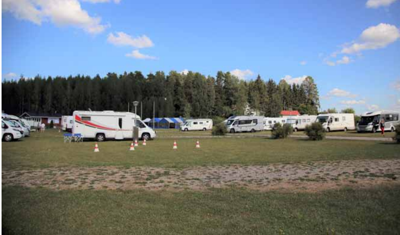
Karavaanarit valmistautumassa 50-vuotis juhliin Artjärvellä.