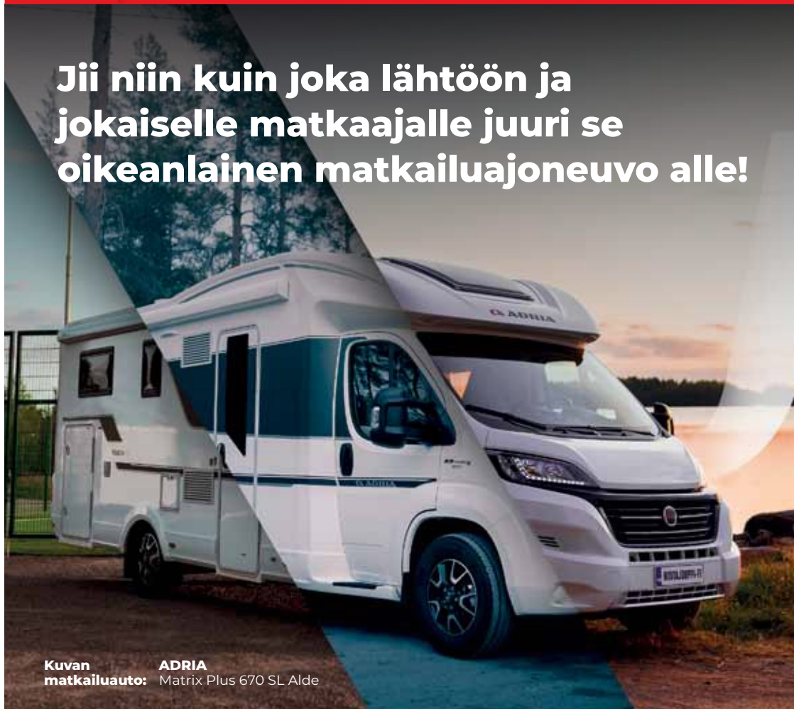
Kuvan matkailuauto: ADRIA Matrix Plus 670 SL Alde

Jii niin kuin joka lähtöön ja jokaiselle matkaajalle juuri se oikeanlainen matkailuajoneuvo alle!