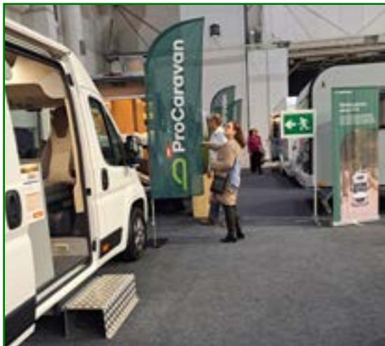
Messuosastoa Helsingin messuilla.