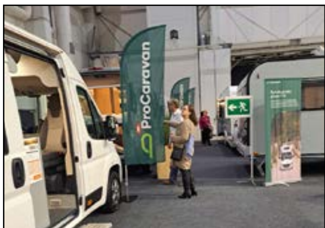
Caravan messuilla oli laaja valikoima kalustoa. Yhteistyökumppanimme ProCaravan osasto.