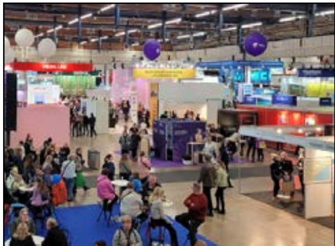
Matkamessujen puolella oli paljon tarjontaa.

SF-Caravan ry:llä oli oma osasto jossa sai päivitettyä tietojaan tai kysyttyä neuvoja. Liiton juhluvuonna eli nyt 2024 oli myös SF-Caravan ry:n väkeä markkinoimassa Kiuruveittä heidän osastollaan. Tästä tulee varmasti hieno tapahtuma. Samalla viikolla on Pohjoismaiset karavaanipäivät sekä 60.v juhlat. Jos et vielä ole varannut paikkaa, niin nyt se kannattaa tehdä, jos mukaan haluat.