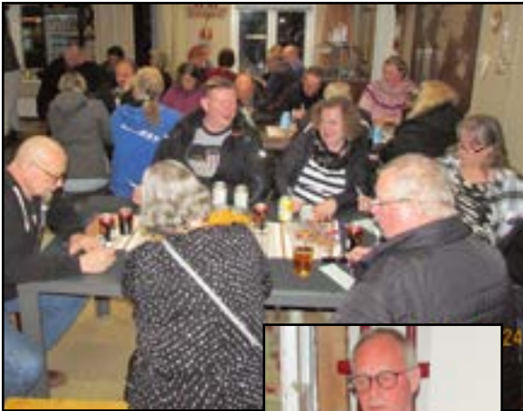
Yllättävästi Bingo-peliin keskittyminen hiljensi salin, pj Hanskin toimiessa bingon vetäjänä.