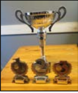
Palkinnot odottavat noutajaansa.

Yhdistysten välisen haastekisan voitti Nurmijärvi 1 kokonaissaaliilla 3900 grammaa. Toiseksi sijoittui Helsinki 1 kokonaissaaliilla 1160 grammaa ja kolmanneksi Lahti 1 kokonaissaaliilla 1080 grammaa. Helsingin yhdistys oli hankkinut joukkuepilkkiä varten kiertopalkinnon, joka siten lähti nurmijärveläisten mukaan.