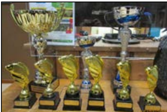
Pilkkikisan palkinnot rivissä.