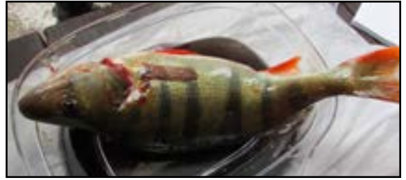
Järvestä onnistuttiin isompiakin vonkaleita narraamaan.