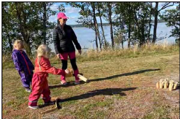
Mölkky on perhe- ja seurapeli, sen todistaa nämä kuvatkin.