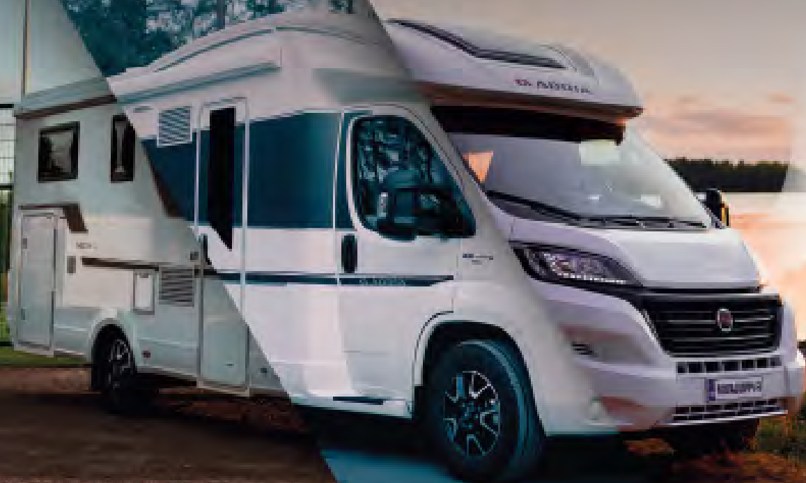
Kuvan matkailuauto ADRIA Matrix Plus 670 SL Aido

Jii niin kuin joka lähtöön ja jokaiselle matkaajalle juuri se oikeanlainen matkailuajoneuvo alle!