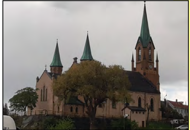
Kragerön kirkko on rakennettu 1870.

Norjan eteläisin kohta. Osloon ohitimme eteläpuolelta ja matkan varrella yövyimme pari yötä ennen Lindesnesin majakkaa. Esimerkiksi Kragerön ja Arendalin kaupungit ovat hyvinkin tutustumisen arvoisia rinteeseen rakennettuine taloineen ja kapeine katuineen.