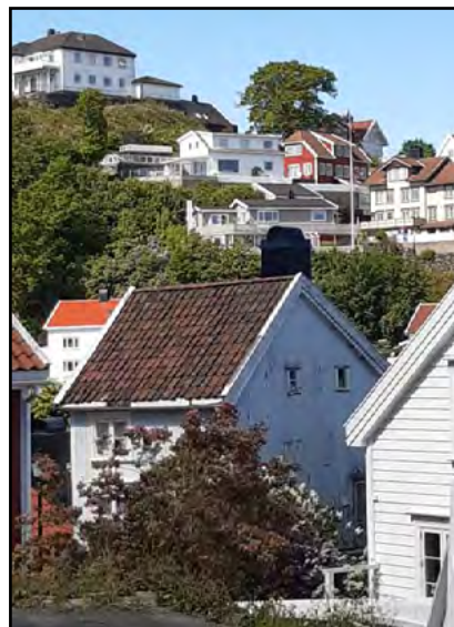
Kragerön rinne- rakentamista.