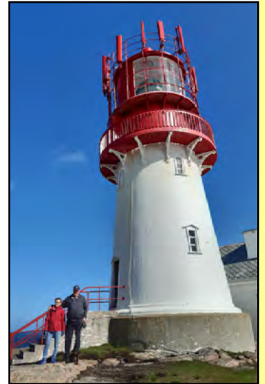
Lindesnesin nykyinen majakka on seissyt tällä paikalla vuodesta 1915.

Lindesnes oli mutkaisen tien päässä ja tässä yövyimme me ja moni muu.