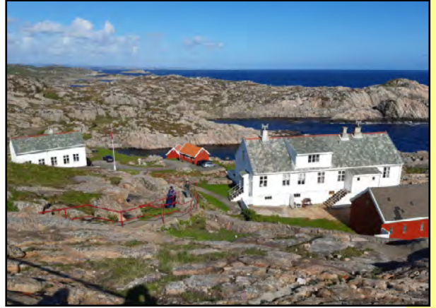
Norjan eteläisin kohta on maisemaltaan varsin karua.

Lindesnesin majakalle saavuttiin kapean ja mutkikkaan tien kautta ja hämmästyksemme oli suuri saavuttuamme perille. Alueen parkkipaikka oli jo täynnä henkilö- ja matkailuautoja ja sovimme juuri ja juuri pysäköimään automme. Tähän sitten jäimme yöksi ja illalla pieni kävelyretki kallioille kohti majakkaa. Ensimmäinen majakka tälle paikalle lienee rakennettu 1600-luvun puolivälissä ja nykyinen majakka on vuodelta 1915. Lisäksi kallioilta löytyy sotien aikaisia puolustusvarustuksia. Siis karut olivat maisemat.