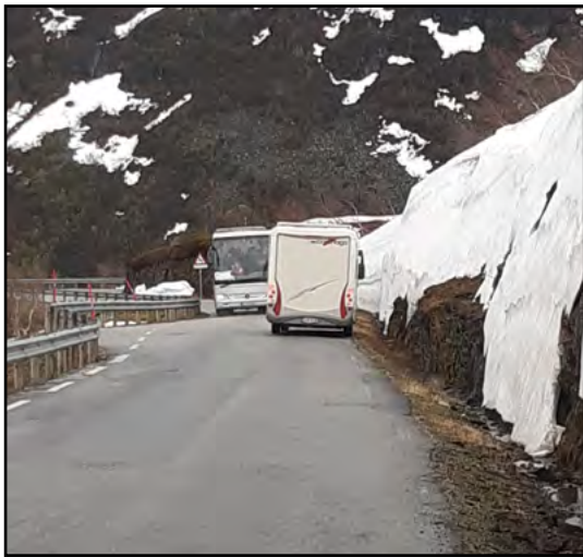
Vastaan tuli bussejakin, levennyksen ansiosta ohittaminen onnistui.