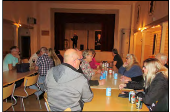
Juttu luisti perjantai-iltana Maamiesseuran- talolla Syystreffien osallistujien kesken.