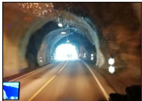
Tunneleita osui matkallemme satoja.

Tämän reitin kohokohta oli näköalapaikka Geirangerin vuonoon ja kylään. Tämä vuono kuuluu maailmanperintökohteisiin ja siellä vierailee muutaman kesäkuukauden aikana noin 150 risteilyalusta. Norjan nähtävyyksiin kuuluu myös alkuperäinen Peikkopolku, mutta se oli suljettu lomamme aikana. Ratin kääntelyä kuitenkin riitti ilman sitäkin.