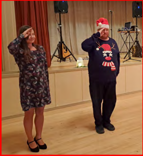
Joulupukin nopeita hoksottimia vaatineen kilpailun finalistit, naisenergia voitti.

Mutta ei Pukki päästänyt aikuisiakaan helpolla. Hän halusi valita joukkoonsa uuden apurin, ja sellaiseksi pääsi voittamalla pienen kilpailun. Ja löytyihän se uusi apuri tonttuarmeijaan naurun saattelemana. Joulupukki vilkutti ja jatkoi matkaansa ties minne.