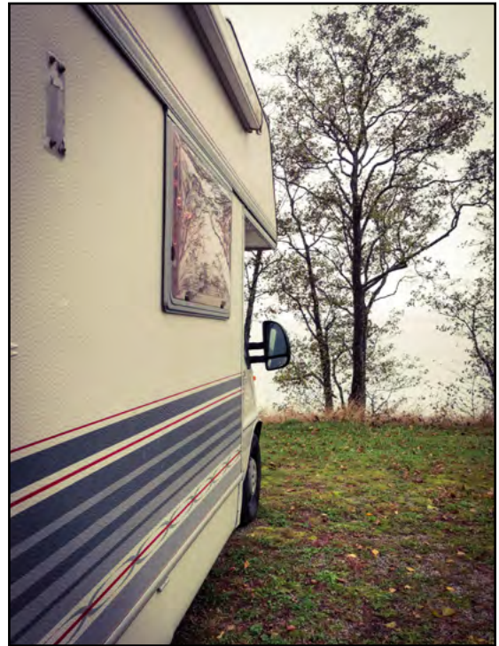
Sumuinen Villikkalajärvi sunnuntai- aamuna.