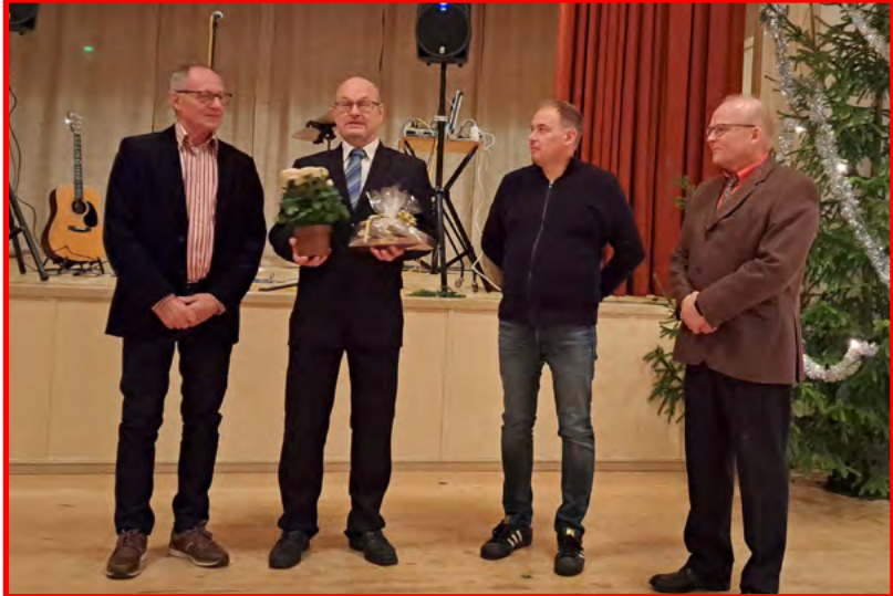
Hallitus yllätti pestinsä vuoden lopussa jättävän pitkäaikaisen puheenjohtajan lahjalla ja kukilla.

Kun kilpailujen vauhtiin oli päästy, allekirjoittanut veti vielä kaikille viime vuodesta tutun kilpailun, jossa piti