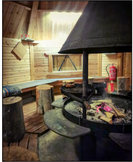
Kota ennen treffiväen sisäänrynnistystä.

Sunnuntaiamu näyttäytyi sumuise- na ja tiikusateisena. Kauniin Villikkalajärven yllä oli tasaisen paksu usvakerros. Väki pakkasi hiljalleen matkailuajoneuvonsa ja Vuorenmäki hiljeni - mutta vain hetkeksi.