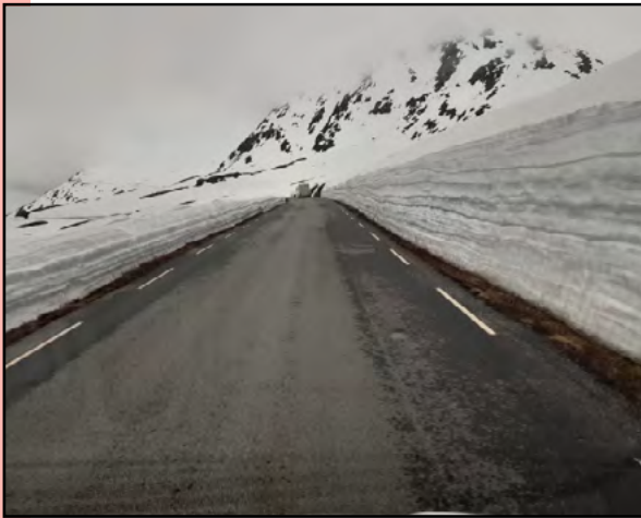
Geirangerin Peikkotien korkeat lumivallit.

Tämä eteläinen osa Norjaa on varsin vuoristoinen ja emme mekään välttyneet lumen kohtaamiselta. Nyt olimme sittenkin vasta Jyväskylän korkeudella. Matkan varrelle osui Geirangerin Peikkopolku, jota reunusti komeat lumivallit. Tie oli kuitenkin sula ja lumeton. Tämä reittimme osa oli kovin kapea ja mutkainen. Vastaantulijan kohdatessa oli pysähdyttävä levennettyyn kohtaan ja suoritettava ohitus.