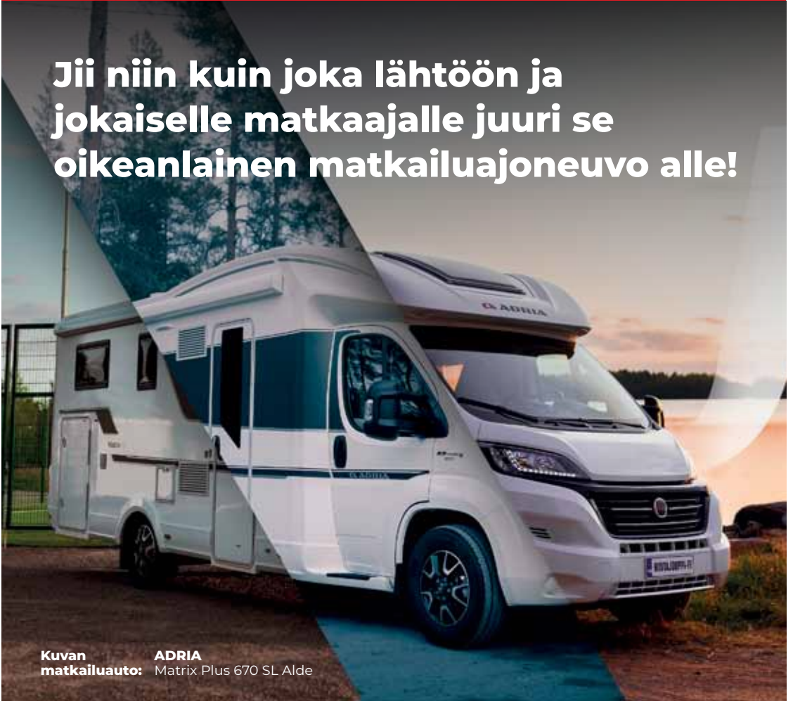
Kuvan matkailuauto: ADRIA Matrix Plus 670 SL Alde

Jii niin kuin joka lähtöön ja jokaiselle matkaajalle juuri se oikeanlainen matkailuajoneuvo alle!