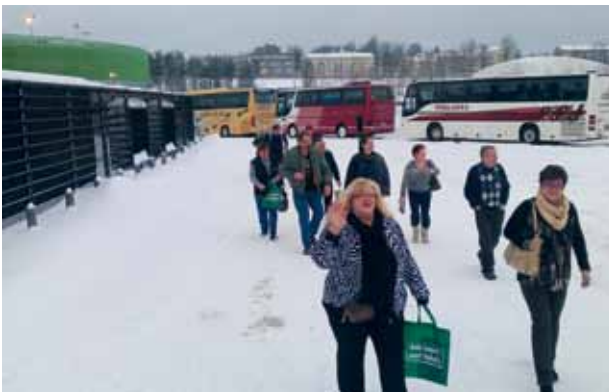
Matkalla bussille, kaupat tehty ja kotia kohti.