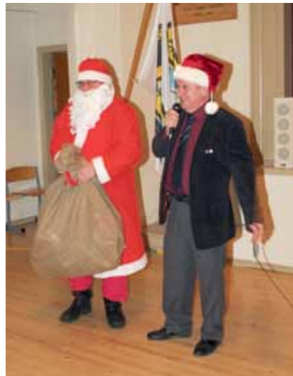
Timppa haastattelee Joulupukkia!