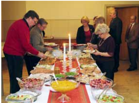
Juhlavieraita herkkupöydän ääressä.