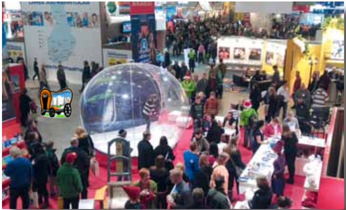
Messuhulinaa Rovaniemen osastolla.