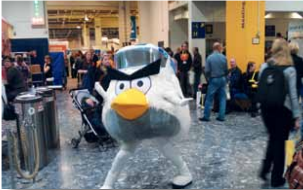
”Angry Birds oli myös messuilla”