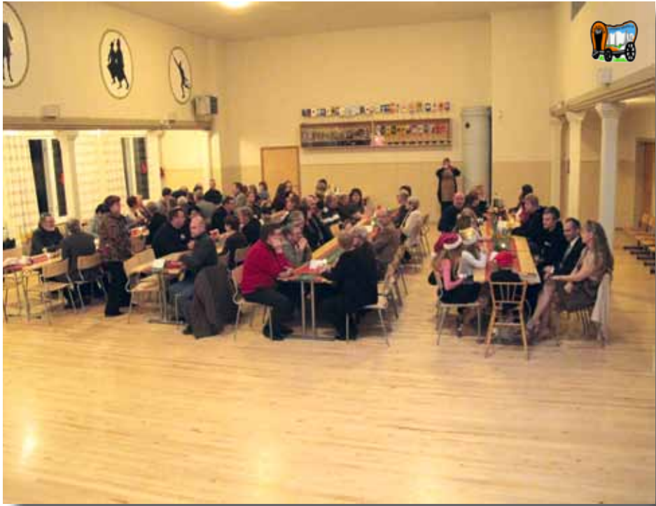
Juhlaväki odottelee H-hetkeä.... ja ei muuta kun herkuttelemaan.