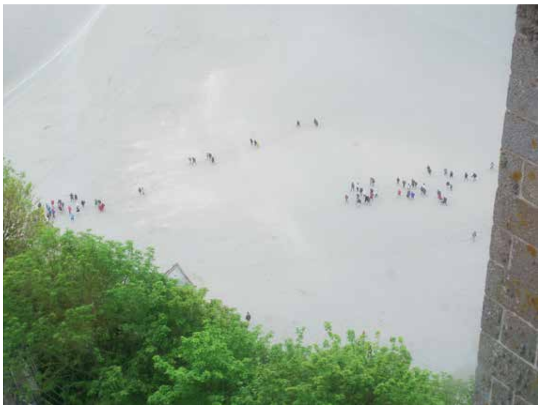
Paljasjalkaiset retkeilijät laskuvesialueella