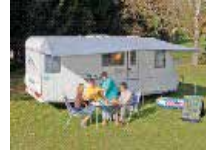
COMO AURINKOKATOKSET ALK.93,45,-