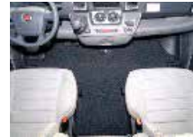
OHJAAMON MATOT ALK.87,80,-