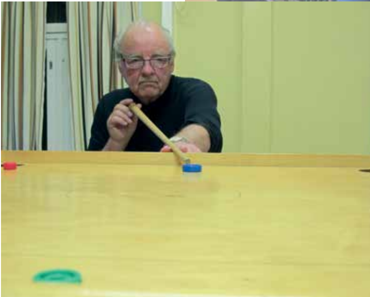
Mestari Eki ja tyylinäyte