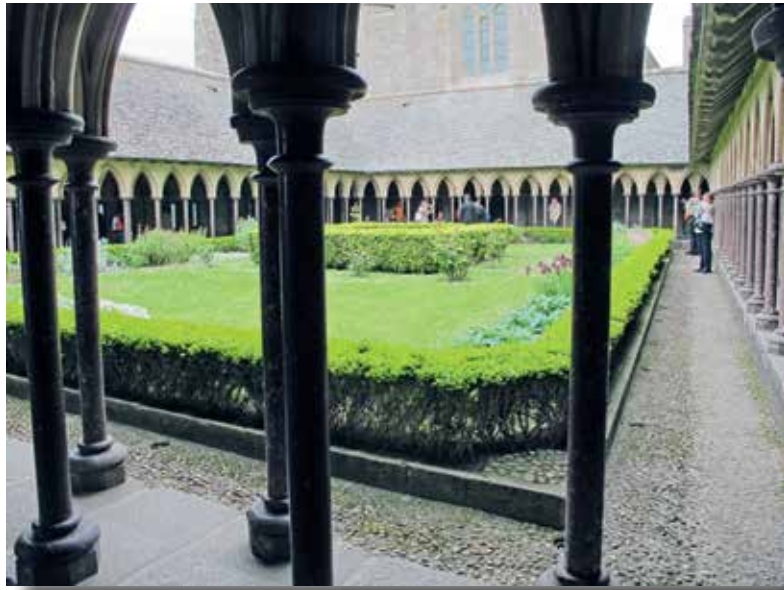
Luostarin sisäpiha kai- kessa vehreydessään