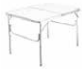
RETKIPÖYDÄT ALK. 22,50,-