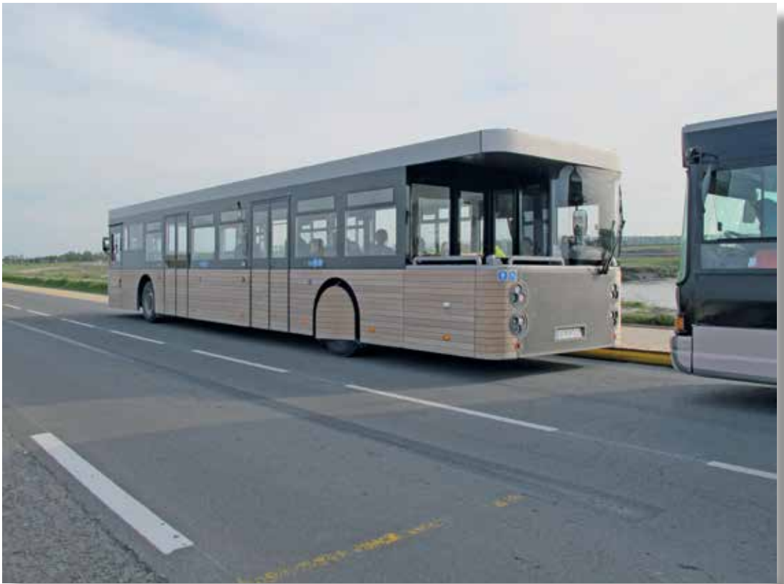
Ohjaamo bussin molemmissa päissä

Tällä Normandian alueella on erittäin suuri vuorovesivaihtelu. Laskuveden aikaan laskuvesialueelle tehdään opastettuja retkiä joko paljain jaloin tai hevosilla, oppaalla usein repussa ranskalaiseen tapaan patonkeja. Muuten saaren lähiympäristö on rauhoitettu autoliikenteeltä ja pysäköintipaikat sijaitsevatkin muutaman kilometrin päässä. Vierailijat kuljetetaan saarelle linja-autoilla, joissa on ohjaamo molemmissa päissä autoa. Näinollen ei bussi tarvitse suurta tilaa kääntyäkseen, vaan kuljettaja vain siirtyy toiseen päähän autoa ja lähtee toiseen suuntaan.