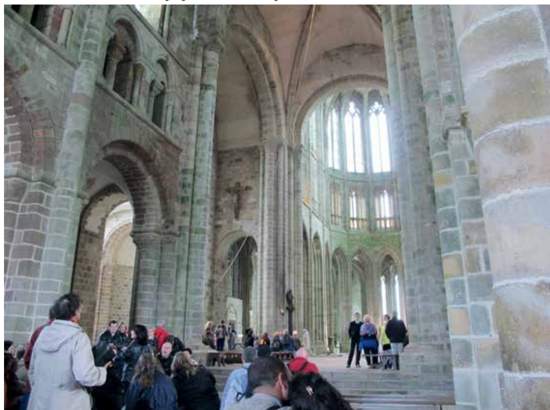
Luostarin kirkko on edelleen jokapäiväisessä käytössä