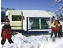
ETUTELTAT VAUNUUN ALK.317,10,-