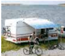
OMNISTOR PUSSIMARKKIISIT ALK. 301,95,-

NÄMÄ JA YLI 2000 MUUTA TUOTETTA LÖYDÄT OSOITTEESTA WWW.MLCARAVAN.FI