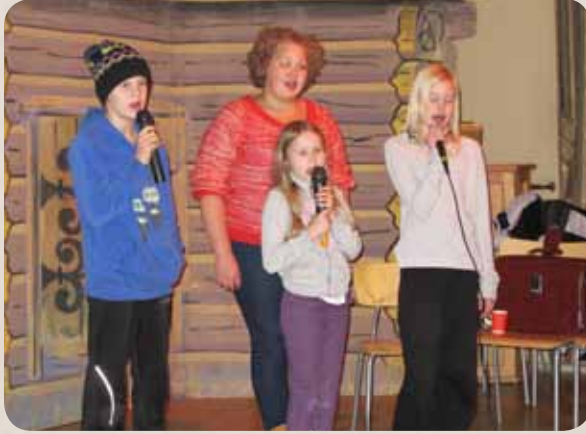
Karaoke sujui kuorolauluna hienosti