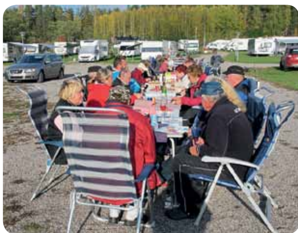
Pitkässä pöydässä rosvopaisti maistui