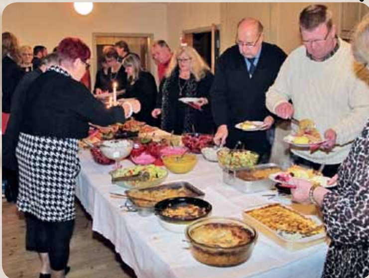
Jouluisen herkkupöydän antimia