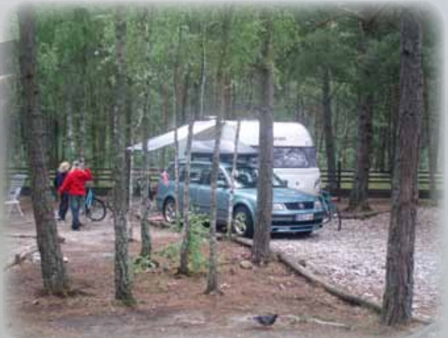
Leirintäalue Nidos Kempingas