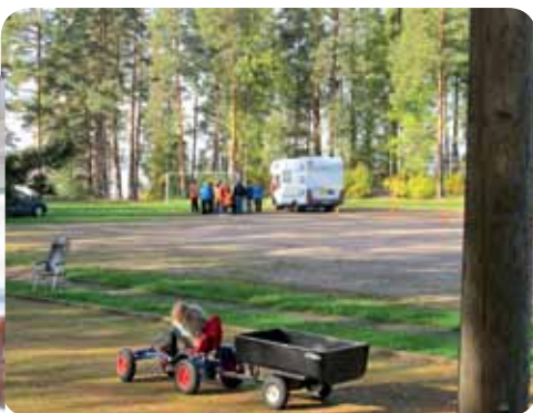
Näin taito karttuu harjoittelemalla