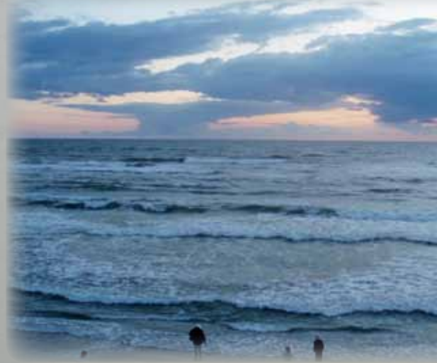
Vastarannalla Ruotsin eteläkärki