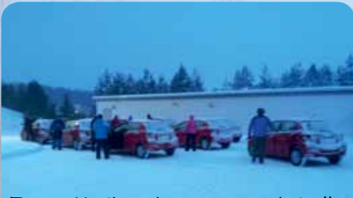
Toyota Yarikset käyttöön ja jokaiselle oma auto