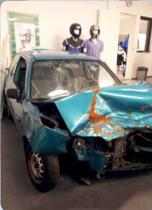
Halliin oli tuotu myös kolariauto