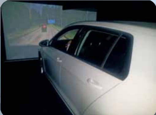
Missä vaiheessa jalankulkiija näkyy heijastimen kanssa ja missä vaiheessa ilman