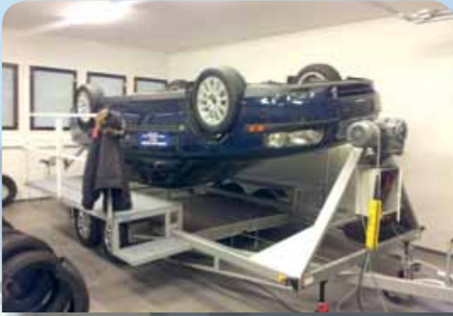
Kun auto pyörähtää ympäri, miltä tuntuu olla sisäpuolella