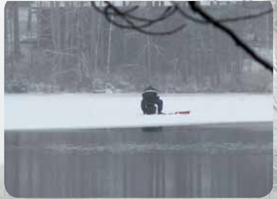
Sulan reunalla pilkkijä