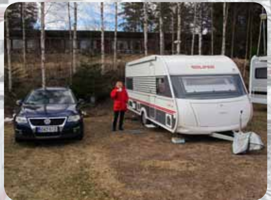
Kesäinen tunnelma Talvipäivillä perjantaina, kun ei ollut yhtään lunta