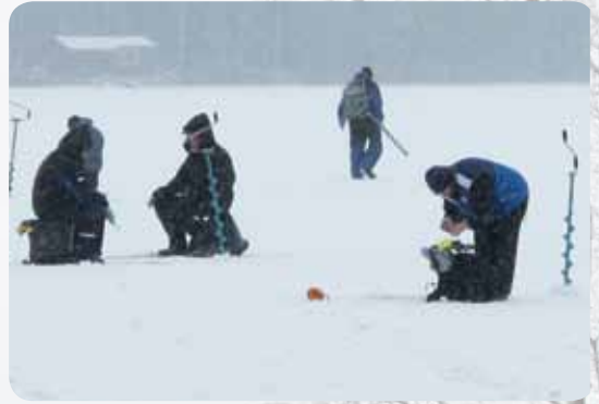
Talveksihan säätila muuttui lauantaina