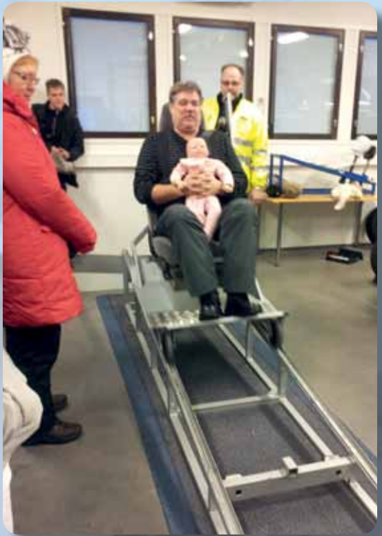
Äkkipysähdys vain 7 km tuntinopeudessa. 'Lapsi' lentää kuin leppäkeihäs käsistäsi kun ei ole turvavyötä. Miten kävisi 50 km:n nopeudessa

me myös havainnointia pimeällä heijastinta käyttävävästä ja ilman heijastinta liikkuvasta jalankulkijasta. Valojen kunnossapidon tärkeyttä ja niiden oikealaista käyttöä kannattaisi jokaisen kerrata esim. auton rikkoutuessa kesken matkan.